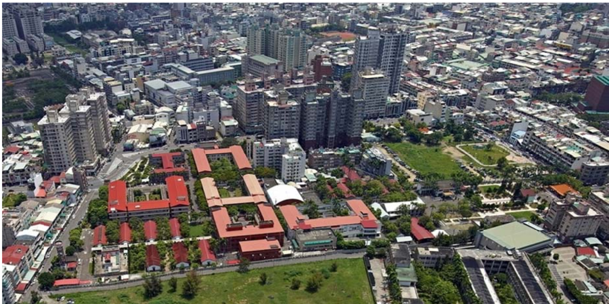
圖 3-6 2020 年台南榮家空照圖

以此，從馬蘭、白河、彰化、板橋、台北等五所榮家的建家歷程可看出依循輔導會原則辦理。輔導會在統籌督導成立新榮家方面，提出多項節省經費之作法與原則，採取運用美援經費、先求安置榮民，後續應因需求再行增加的作法，全台各處榮家均有出現家區內建築型式混雜的情況，諸如一棟高層化的鋼筋混凝土建築，旁邊坐落著平房紅磚黑瓦建築的風貌（如圖 3-6）。