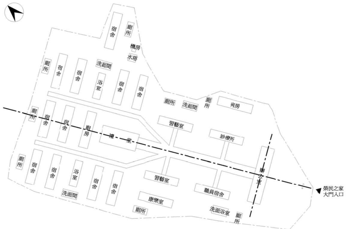
圖 3-3 1954 年台南榮家家區規劃圖 ( 本研究重新繪製 )