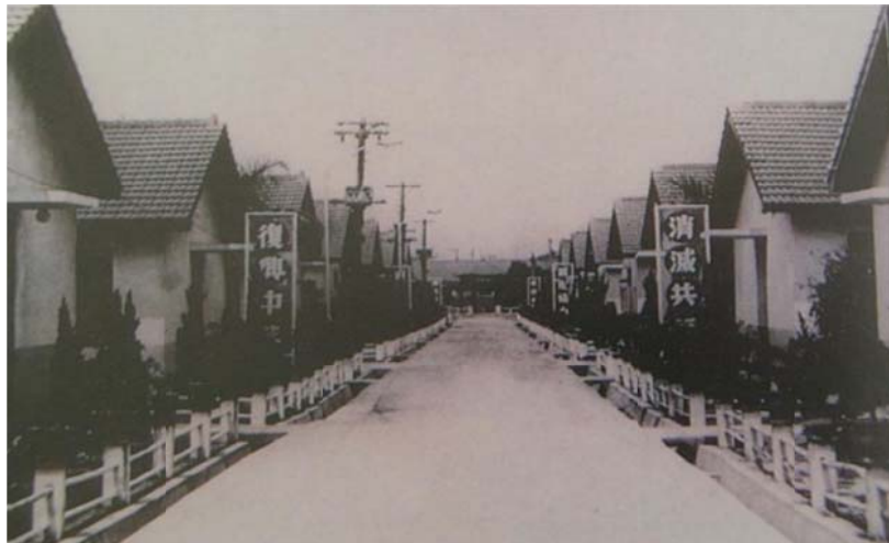
圖 3-1 1950 年代台南榮民宿舍紅磚水泥牆灰瓦建築

台灣榮家的出現，是因政府為照護因公傷殘的退役軍人。1950 年代榮家草創時期，輔導會尚未成立，當時由台灣省政府社會處籌設，建設廳負責設計，工礦公司負責施工。在此時期設立之榮家，包含：新竹、台南、屏東、花蓮等四處，除花蓮榮家是由花蓮縣政府興辦，其餘三家由社會處負責。榮家宿舍建築形態是以單層建築為主( 詳圖 3-1 )，沿襲日治時期的紅磚水泥牆、屋頂木構造、屋面鋪設灰瓦的建築工法；此工法在興建上較為快速，得以因應緊急安置傷殘需求。