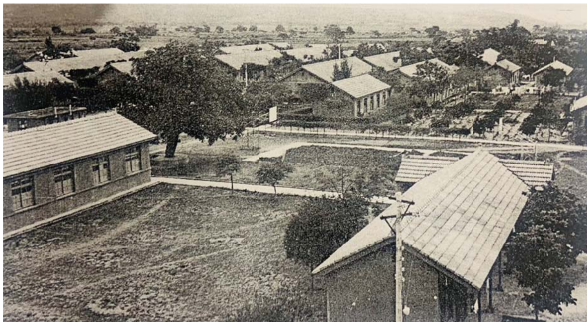
圖 3-5 1950 年代太平榮家家區空照圖 資料來源：《十年來之輔導工作》，1964