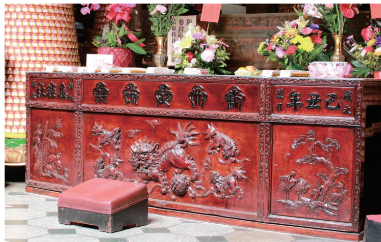
▲ 新竹都城隍廟的八仙桌，即為「五獅戲球」的圖樣，四方角落有四隻小獅，圍繞著中間一隻大獅。

部分區域流行的雕飾圖案也能成為辨識家具產地的依據，例如在新竹多間廟宇的八仙桌上，都能見到構圖一致的「五獅戲球」圖樣，家庭中的新竹體紅眠床腳也常見「獅子戲球」雕刻。戰後外銷家具的興起，則讓傳統神話與演義故事中的人物場景，進一步成為新竹木器雕刻圖樣的流行特色之一。