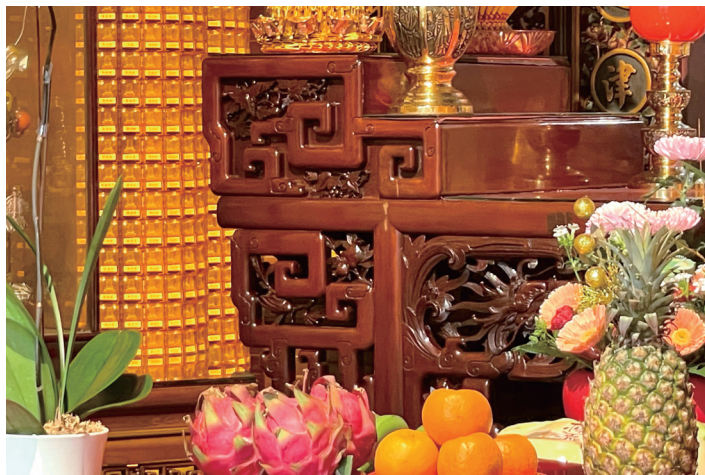
▲ 新竹長和宮後殿所供奉的觀世音菩薩之花案，華麗的造型以曲矩造型為骨幹，空隙間填滿雕工細膩的花飾，是新竹供桌特有的樣式。