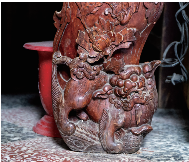
▲ 紅眠床的床腳為「獅子戲球」，也是新竹常見的雕刻樣式。