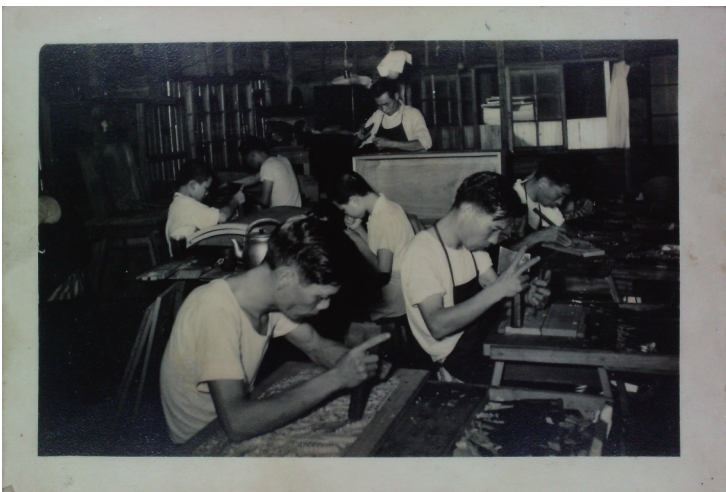
▲ 早期在新竹南大路、境福街及中華路一帶，有許多木雕家具工廠，興盛時期生意供不應求，曾締造可觀的外銷產值。此為1954年位於新竹境福街的臺灣藝術雕刻家具工廠的工作照。