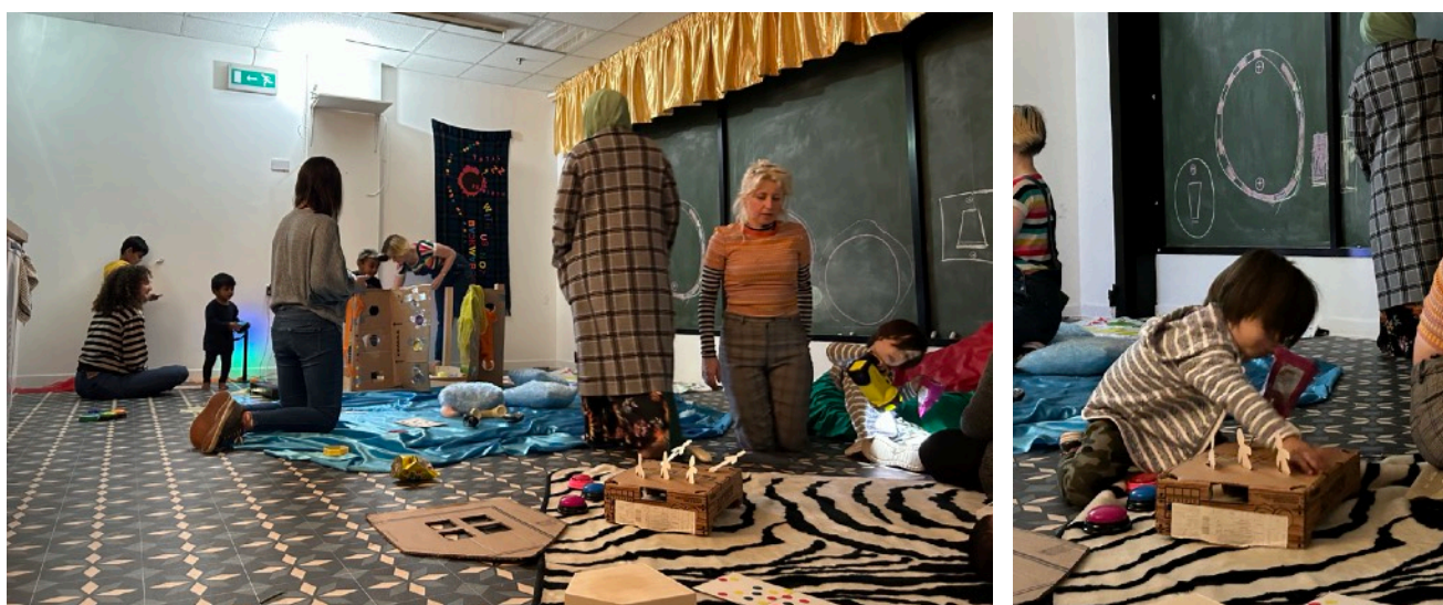
圖說：Starcatchers' Saturdays 活動現場紀錄