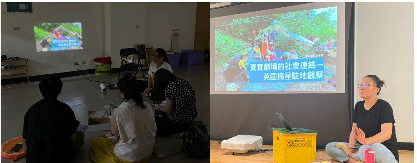
圖說：分享會高雄（左）、臺北（右）現場活動紀錄

本次回台後目前已分別於6月28日、7月19日在高雄兩兩家、臺北囡仔人排練空間辦理海外藝遊分享會。於高雄兩兩家可能為周間的時間，臨時報名民眾無法參與之外，以臺灣寶寶劇場藝術家平台成員為主要參與成員；而在臺北場次，則是以過往曾經有或是未來即將希望朝向嬰幼兒或孩童藝術體驗、作品發展的藝術團隊為主要邀請對象，兩場次參與人數總計為17人。