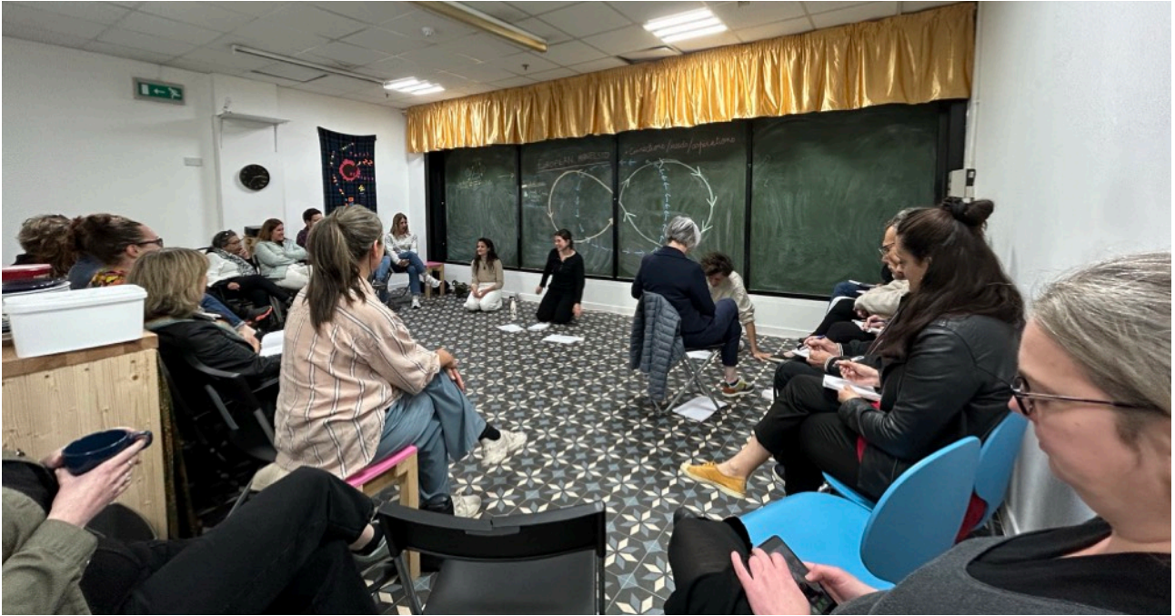
圖說：Erasmus交流計畫，第二日最終的交流討論現場

為每次交流的參與成員。而本計畫因為是針對歐盟國家，因此在符合補助規定（至少三個歐盟國家參與），在英國脫歐影響之下，參與之交流國家分別是：荷蘭、法國、西班牙（加泰隆尼雅地區）和蘇格蘭。