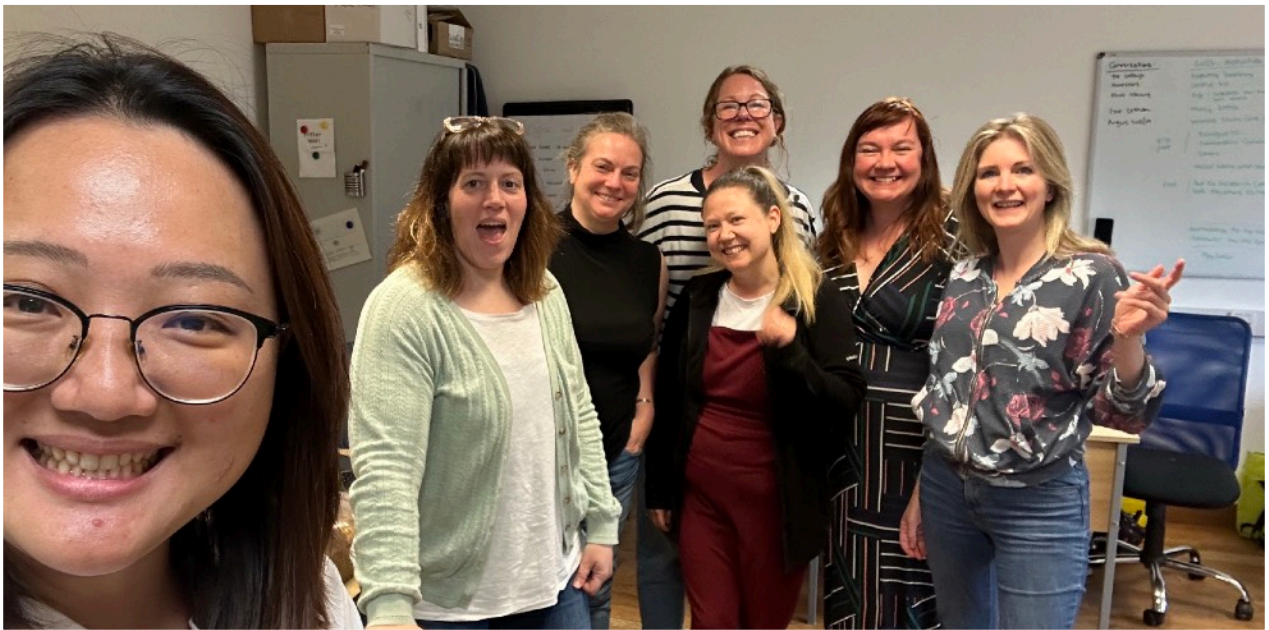
圖說：與摘星行政辦公室成員合影