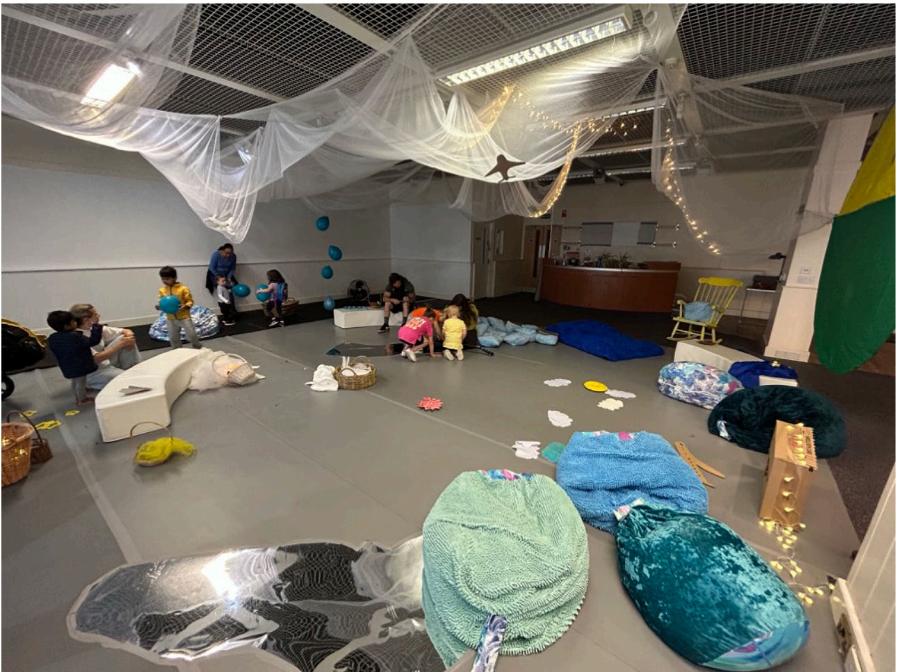
圖說：Starcatchers' Saturdays 活動現場紀錄

進出，也因此每組家庭停留的時間不同，有些家庭是短時間進來探索、遊戲後就隨即離去，有些家庭則是完整待滿整個時段後，再離去或是留下來到Community Wellbeing Space用餐。