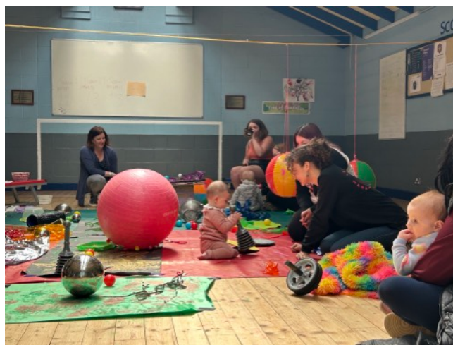
圖說：Play & Explore活動現場紀錄