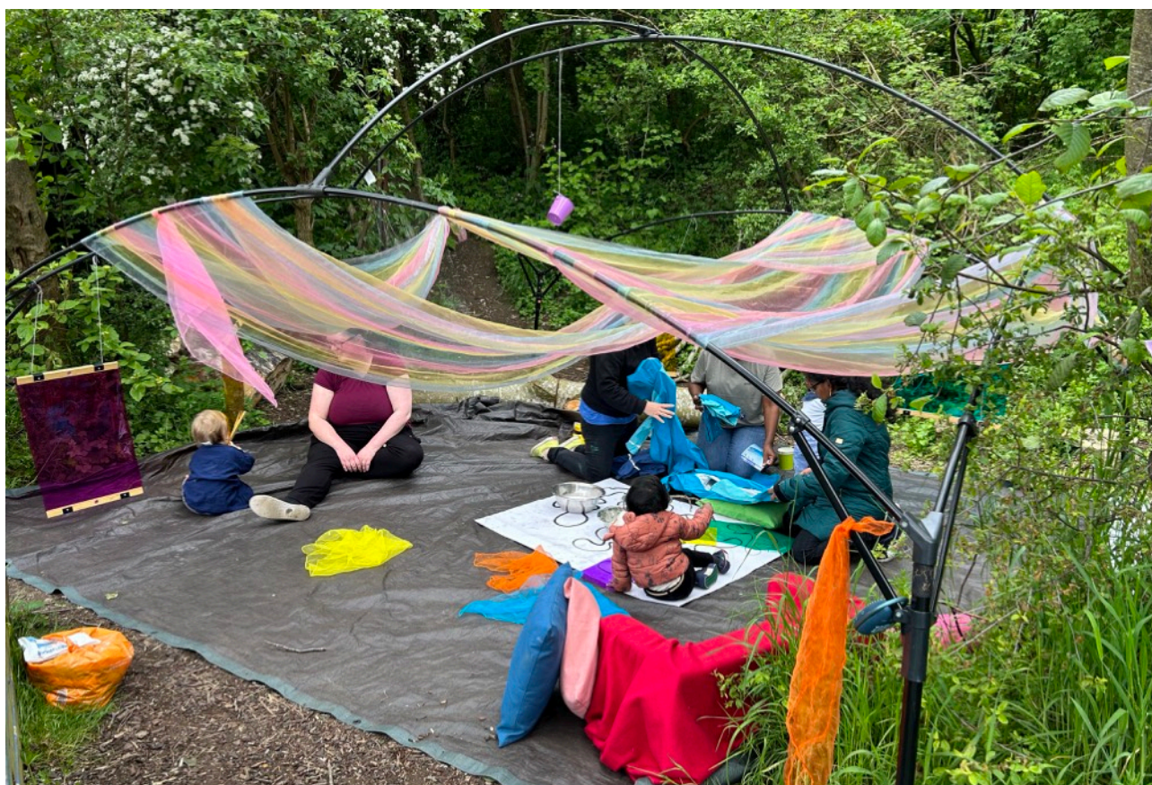
圖說：Expecting Something 活動現場紀錄

「Expecting Something」計畫為摘星自2020年移到目前辦公室所在位置WHALE Arts 現址後，原本是在室內空間進行的每週定期的藝術活動；然而，在疫情的影響下，所有活動暫停了幾個月後，但漸漸的感受到部分藝術活動需要例行舉行的必要，在符合英國及蘇格蘭當地政府的規定之下，將活動改到WHALE Arts後的戶外小花園進行，隨著疫情規劃鬆綁後，詢問所有定期參與的家庭們是否願意改回室內，大家都紛紛表達想要待在戶外花園，而活動地點也就延續至今。