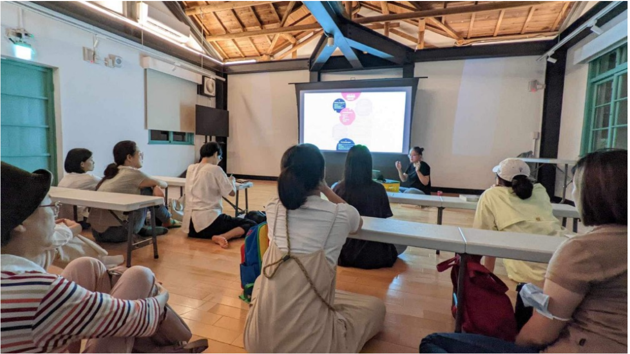
圖說：分享回台北場現場紀錄