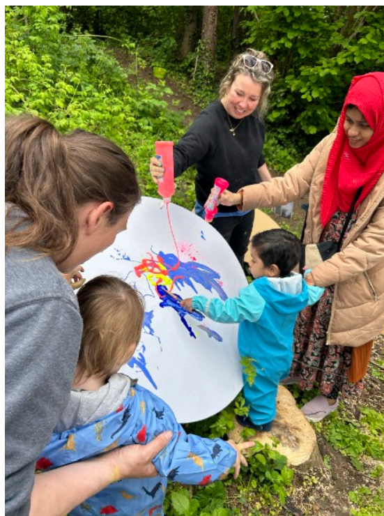
圖說：Expecting Something 活動現場紀錄