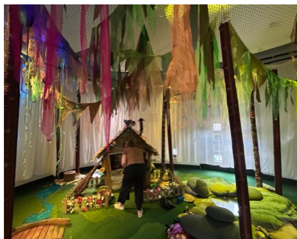
圖說：The Hullabaloo劇場外觀，以及室內裝置空間

疫情期間，考量所有家庭因為無法外出進行相關藝術體驗活動，其當地的衛生局與The Hullabaloo合作發展藝術體驗包的開發，藉由一紙箱的大小，在裡面放置故事書、絲巾、手指偶、但沙鈴，並且提供手冊說明可以如何藉由這些物品在家和自己的孩子互動、玩耍。衛生局將會在確認新生兒誕生之後，配送一包裏到這些家庭中，讓新生兒媽媽有不同的材料、玩具可以跟自己的孩子們玩耍。此藝術計畫在疫情期間推出，獲得許多家庭的正面回饋，也因此持續獲得衛生局的支持製作與派發中。由此，再次看到藝術組織與在地政府單位、衛生組織合作，提供給新生兒家庭不同面向的支持與協助，此實例可借鏡參考。