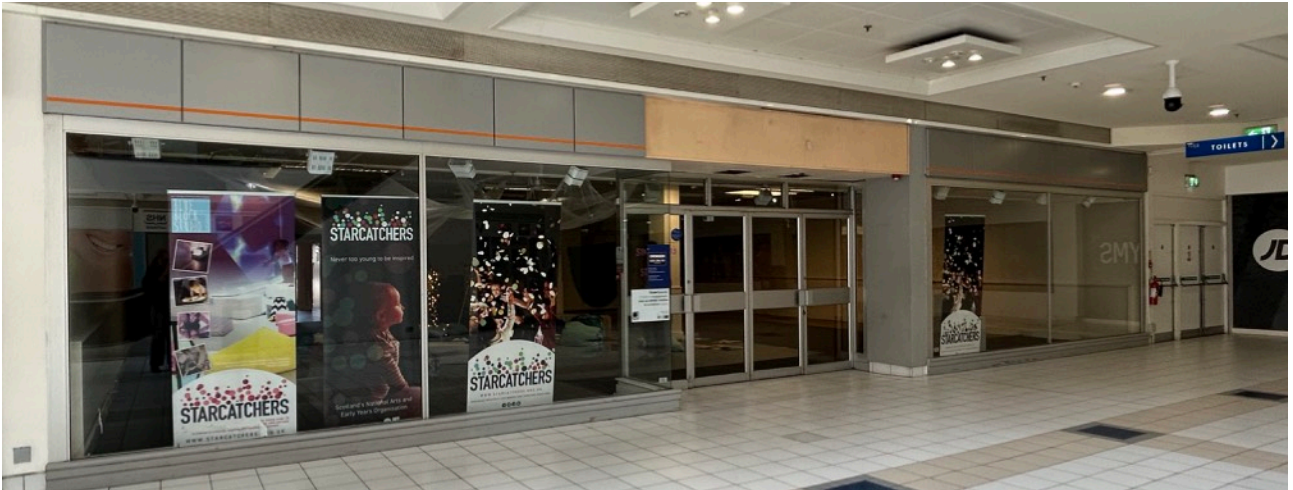
圖說：Starcatchers' Saturdays 寶寶空間

進出，也因此每組家庭停留的時間不同，有些家庭是短時間進來探索、遊戲後就隨即離去，有些家庭則是完整待滿整個時段後，再離去或是留下來到Community Wellbeing Space用餐。