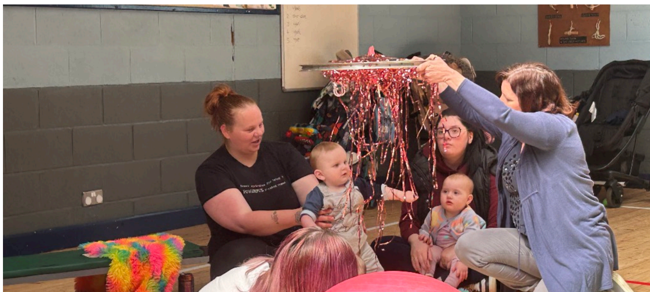
圖說：Play & Explore活動現場紀錄