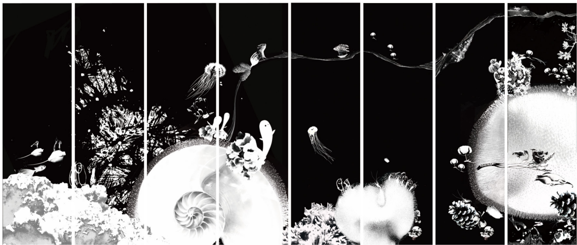
張靜予 CHANG, Ching-Yu