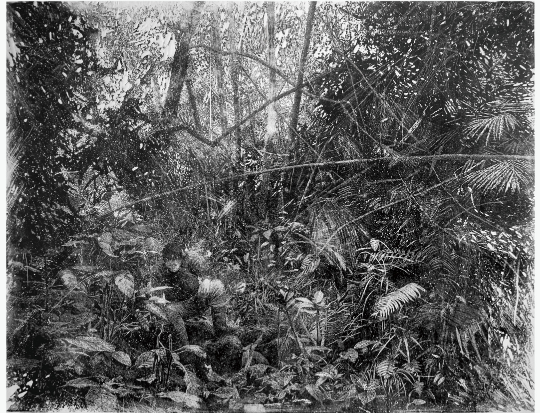
林冠斌 LIN, Kuan-Pin 殘存 Survival 油印木刻 Oil-based woodcut 90 x 120cm 2023