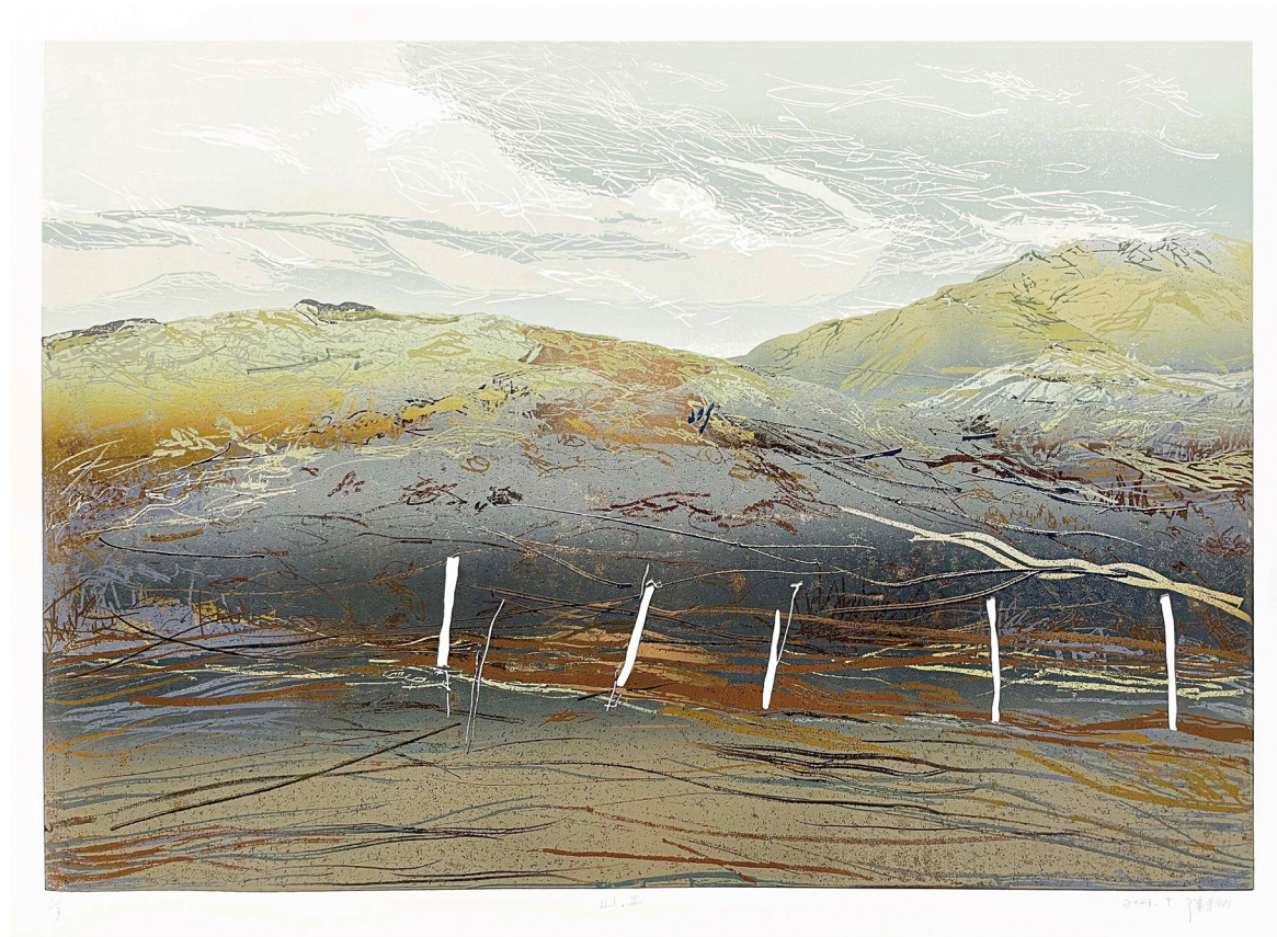
陳耘 CHEN, Yun