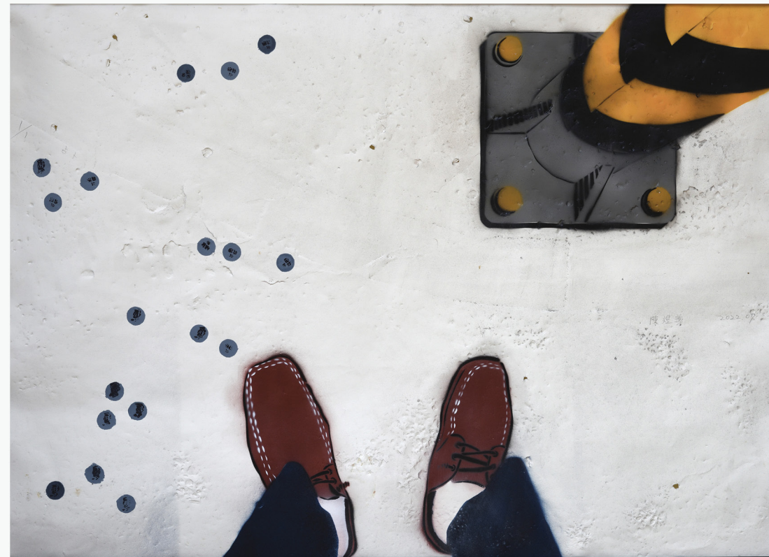
陳煜尊 CHEN, Yu-Tsun