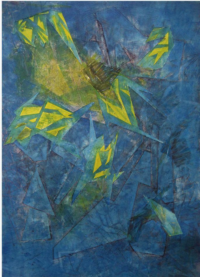
林信源 LIN, Hsin-Yuan 失序 / 交織 Disorde / Interweave 紙鑄模、一版多色 Paper casting, viscosity intaglio 88 x 63 cm 2023