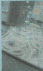
Above: Flies for the Puppets in the Green Mountains festival sit on the counter at the Bellows Falls Opera House.