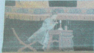
Left: Hand puppets entertain children at the Bellows Falls Opera House, Tuesday afternoon.

E ight performing groups from seven countries, Brazil, Bulgaria, Canada, France, Sweden, Taiwan and the United States, descended upon Windham County for an international festival of unusual theater called Puppets in the Green Mountains. The festival, hosted by Sandglass Theater, will be wrapping up this weekend with performances all day Saturday and all day Sunday. For more information visit www.puppetsinthegreenmountains.com or call 802-251-5070.