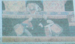
Above: The Carnival of Taiwanese Hand Puppetry is performed by the Happy Puppetry Company.