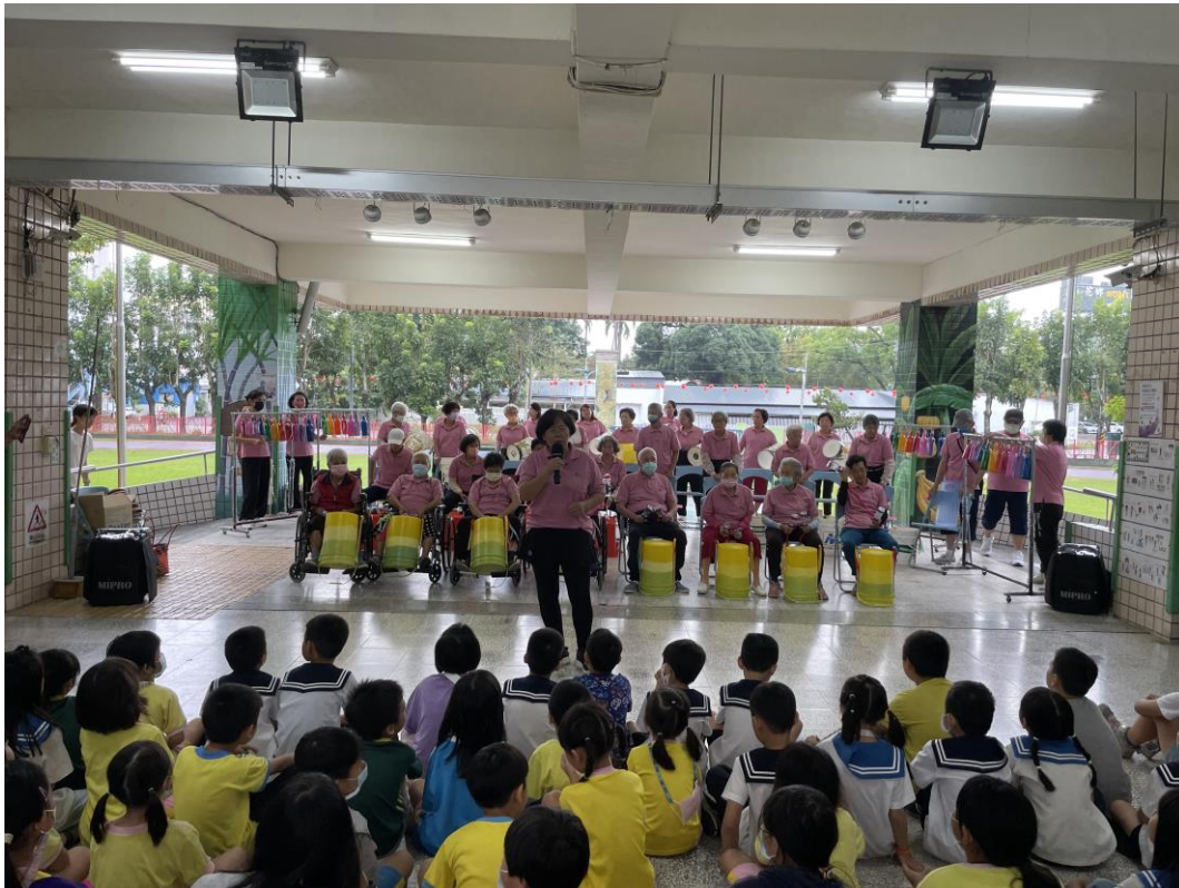
2024. 11. 12 旗山區旗尾國小與東平社區長者 (活動照片)