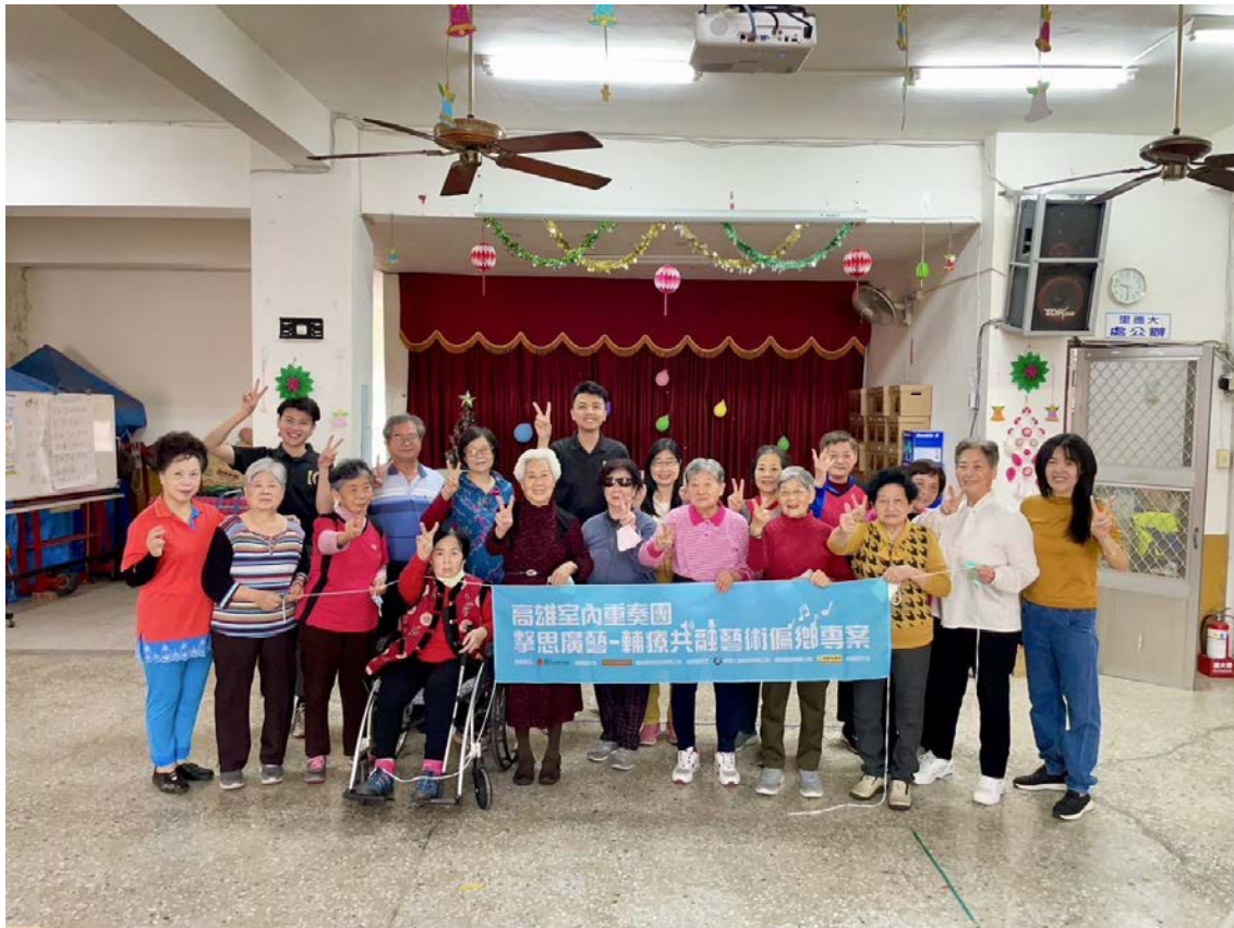
繪本創作(生命故事書) (活動照片)