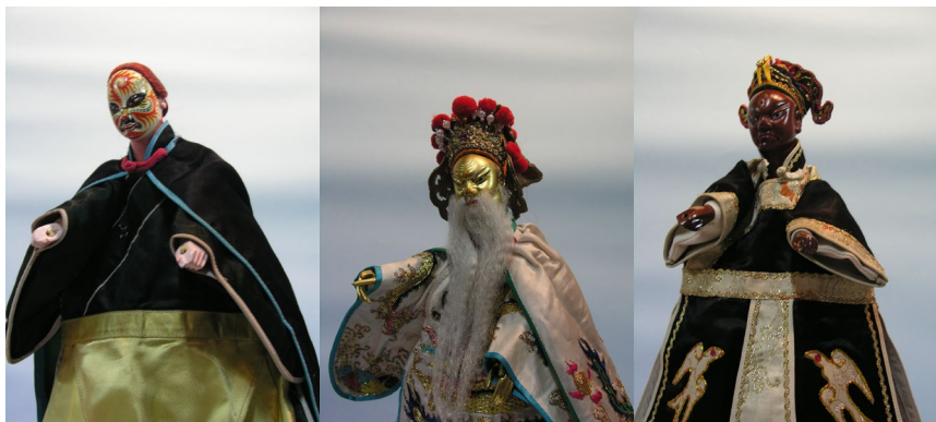
左圖依序為吉芝陀、龍瑞王、華光

華光打開天眼一看，知真龍瑞王在蓮花座後，大罵賊禿。如來見華光無禮，佛手一招，將華光天眼招回，訓斥華光勿生禍端，華光唯唯諾諾，抱恨而退。華光尋母不著又失了天眼，惱怒文殊，普賢二人，乃幻化觀音假像，欲大鬧清涼山，火燒文瑞院，以報前仇。真觀音知文瑞院有難，降臨清涼山，以照魔鏡照出光華光本相……。