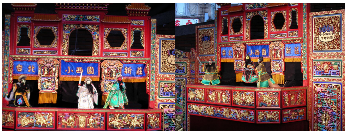
圖為三國演義首部曲－黃巾之亂