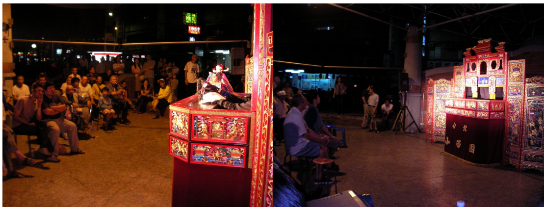
圖為清涼山演出盛況

華光在南京蕭家莊三轉世，投胎聖母吉芝陀為子，龍瑞王駕祥雲要入靈山恭禮，見南京妖氣沖天，知孽畜邪心不改，萬民受害，將吉芝陀抓上雲端，欲打入酆都，永不超生。