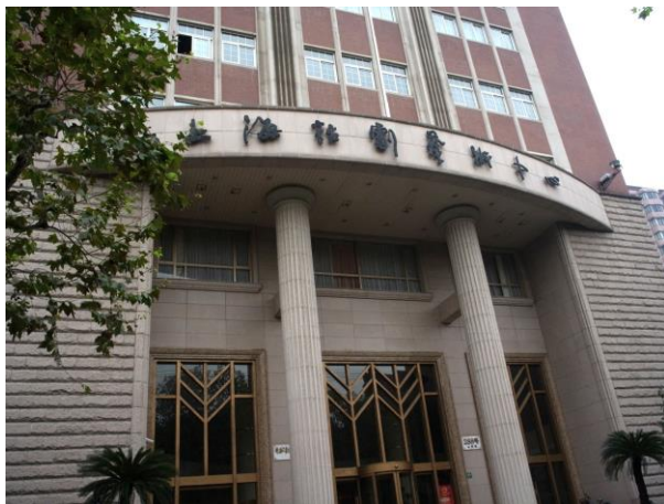
上海話劇中心外觀

建於 1995 年的上海話劇中心，不僅是引領上海話劇界的龍頭，話劇中心還擁有三個功能齊全、大小互異的專業劇場：藝術劇院、戲劇沙龍與 D6 空間，以滿足不同類型、形式的表演藝術。不斷引進各國的優秀製作，話劇中心已在上海培養了當代戲劇的穩固市場，也因此繼續吸引了來自世界各國優秀的表演團體，每年演出六百多場、觀眾人數多達十幾萬。在這期間除了和來自世界各地的藝術家交流，也曾多次邀請台灣的劇場界人士，參與各種形式的合作或互相參訪演出，與台灣藝術界有密切頻繁的互動往來，更加確立兩岸相異其趣的藝術發展特色。