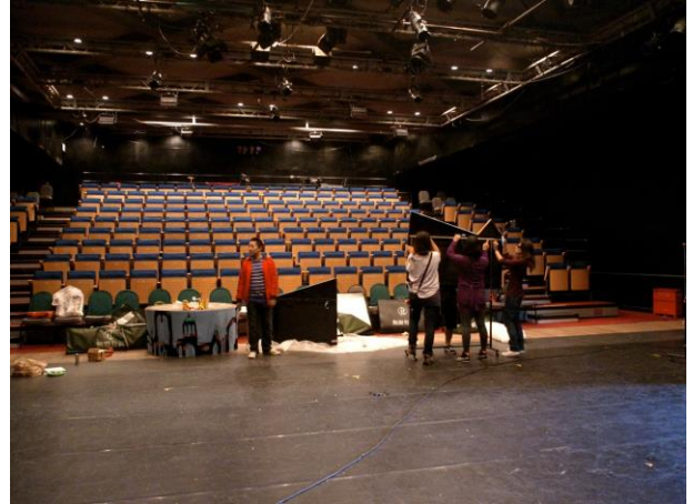
D6 空間 從舞台看觀眾席