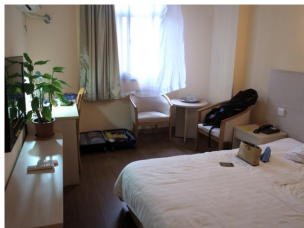
華宮酒店房間照片