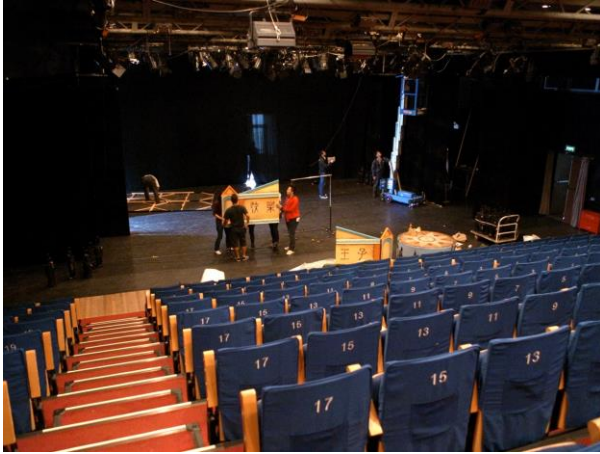
D6 空間 從觀眾席看舞台