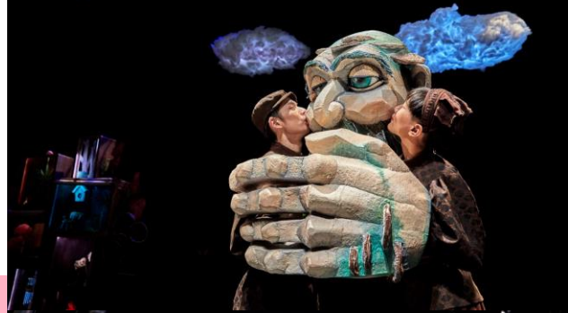
2022《搞砸的那一天》劇照