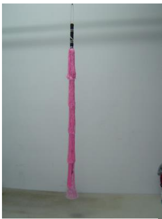
馬鞭：象徵騎馬，或是 快馬加鞭趕路

戲曲中所用的道具多半不是寫實的，即使一些真實的小物件，一般也只是虛擬其用途，例如燭台的使用大多數的場合是不會真的點燃，而酒杯也不會真的裝酒。受限於舞台的使用空間，舉凡屋舍城牆或是車馬船轎，都不會以真物搬上舞台使用，也因此衍生出虛擬的道具。譬如一塊布畫上城牆，便是城池；畫上輪子，便是車輦；紅旗代表火勢猛烈；藍旗代表水勢浩大。以馬鞭代替馬、以槳代替船，利用道具的虛擬性轉化無限的時空，使演員在舞台上更能揮灑自如。更值得一提的是，舞台上常擺置一桌二椅的實體道具，有時代表一張床、有時呈現出廳堂或是家的感覺，使表演的空間更具想像力。