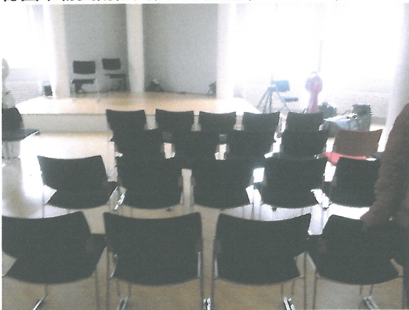
德國畢勒費爾德文化局表演廳正門