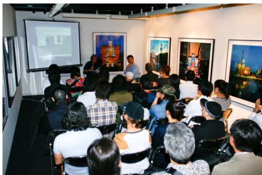
東京銀座 Nokin Salon 攝影藝廊