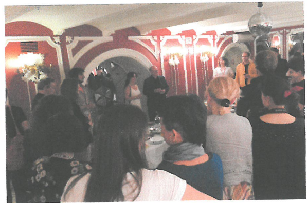
FOMENKO'S WORKSHOP THEATRE 外觀 & 室內

Mossovet 劇院 (Государственный академический театр имени Театр Моссовета) 是莫斯科最古老的劇院之一，1923 年時由劇場企業家 S. I. Prokofiev 所創立，最早的名稱是 the Theater of Moscow Provincial Council of Trade Unions (MGSPS)。1938 年改名為莫斯科市議會劇院 (Teatr Moscovskovo soveta)，沿用至今簡稱為 Mossovet Theatre。從 1940 年到 1977 年，劇院在 Yury Zavadsky 的帶領之下快速的進步興盛，並成為眾多蘇聯知名藝術家的家，其中包括：Vera Maretskaya, Mikhail Kozakov, Yury Kuzmenkov 等人。1964 年，基於劇院的傑出藝術成就奠定了當時它重要的學術地位。1970 年代中期開始，在 Pavel Khomsky 的帶領下尋找劇場新的藝術表現方式，除了在 894 席次主要劇場演出的當地古典劇碼及現代劇改編作品外，也嘗試在屋頂區域的 120 席次小劇場演出較小的學生作品。