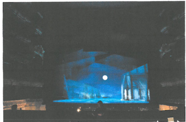
BOLSHOI THEATRE 外觀 & 室內

Fomenko' s Workshop 戲院(Театр «Мастерская Петра Фоменко»)本身啟用於 2008 年 1 月份，當時是由莫斯科市政府決議幫助長年來一直沒有自己表演場所的 Fomenko' s Workshop 劇團建造一個擁有現代劇場技術的劇場，同時也成為他們第一個屬於自己的家。而 Fomenko' s Workshop 劇團是在 1998 年由 Petr Fomenko 帶領一批俄羅斯戲劇學院 (GITIS) 的學生所創立的。在劇團成立至今的二十幾年歲月中，他們已製作超過四十多場的演出製作。