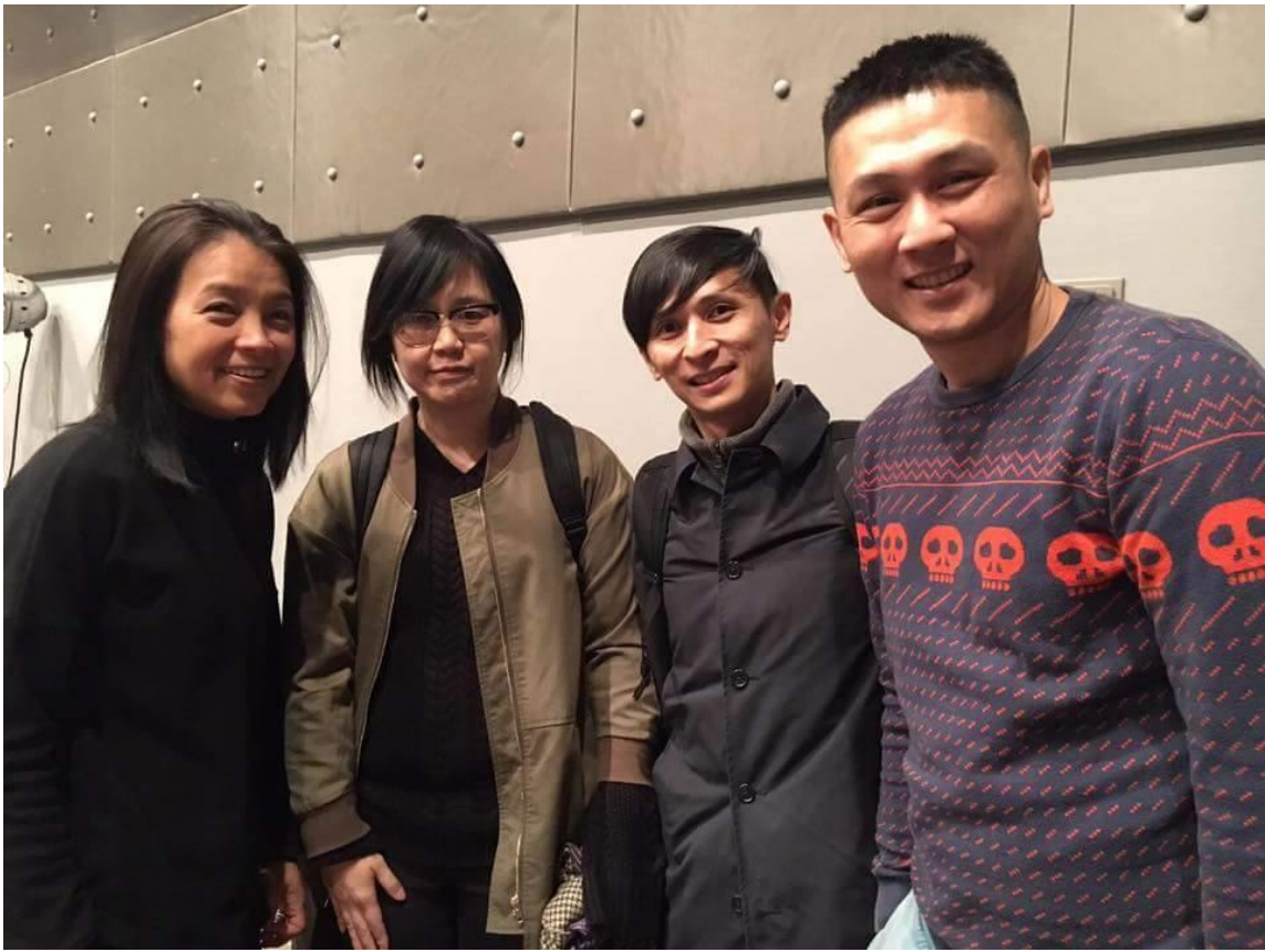
亞洲四城編舞家：臺灣、日本、馬來西亞、泰國