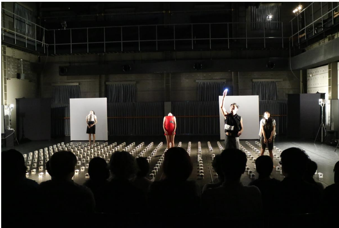
世紀當代舞團演出《吉光片語》