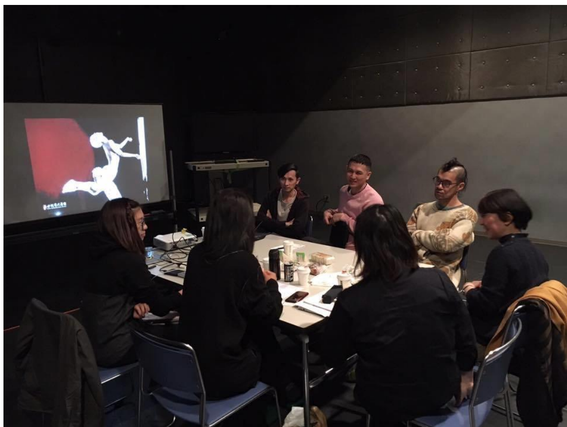
研討會：亞洲四城編舞家交流狀況