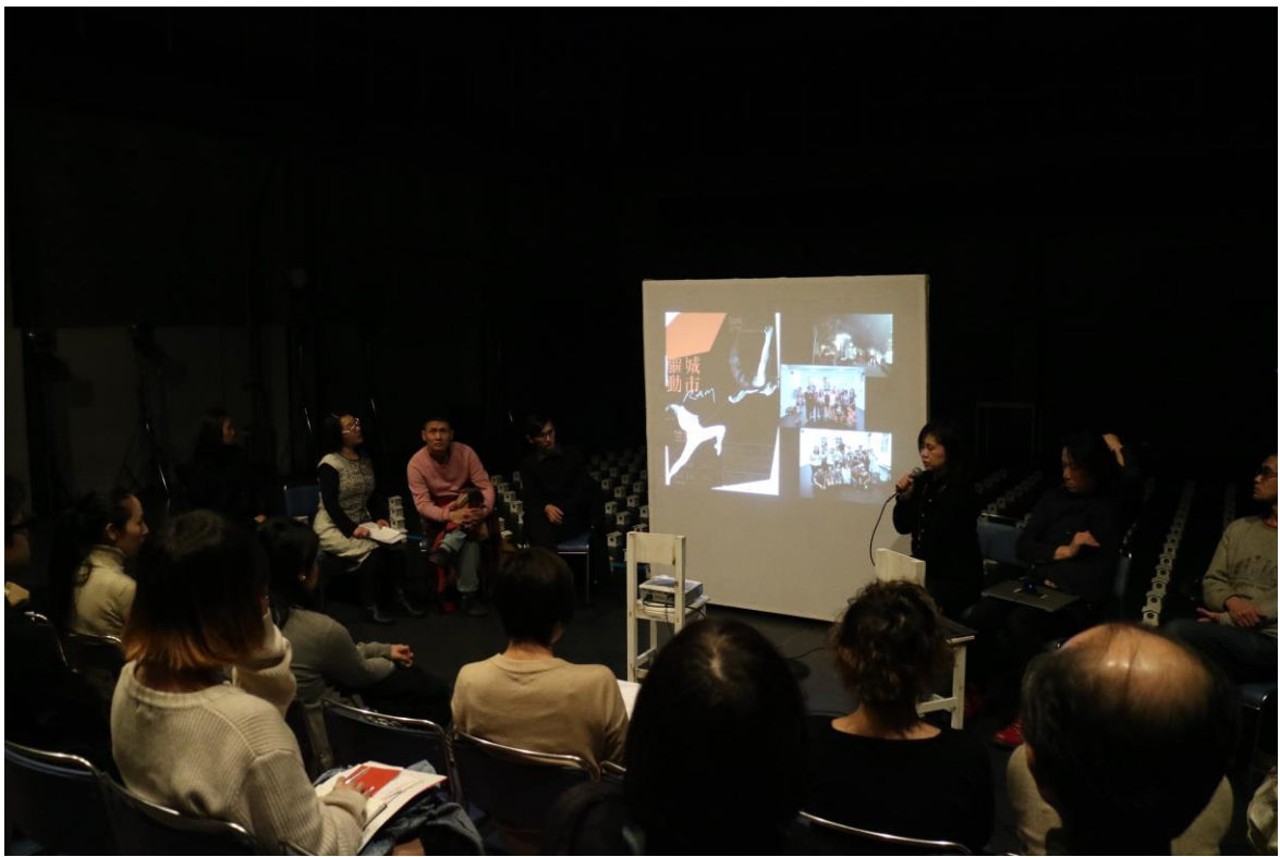
演後座談：驅動城市介紹