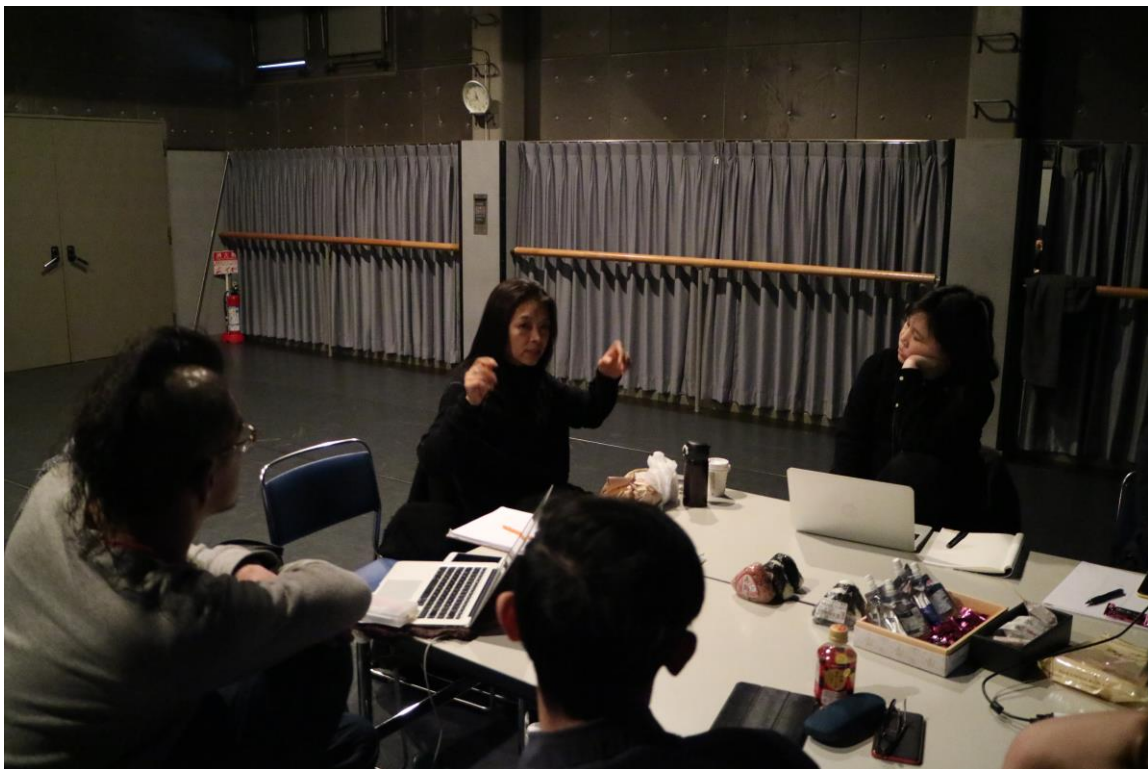
研討會：亞洲四城編舞家交流狀況