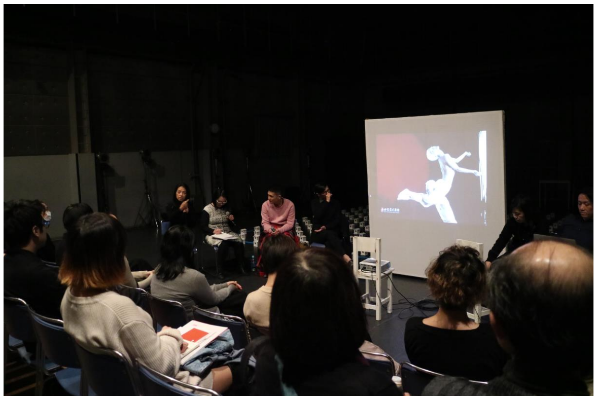
演後座談：團隊介紹