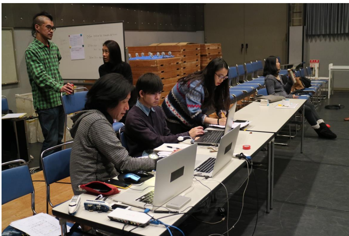
與影像設計及劇場技術進行溝通及調校