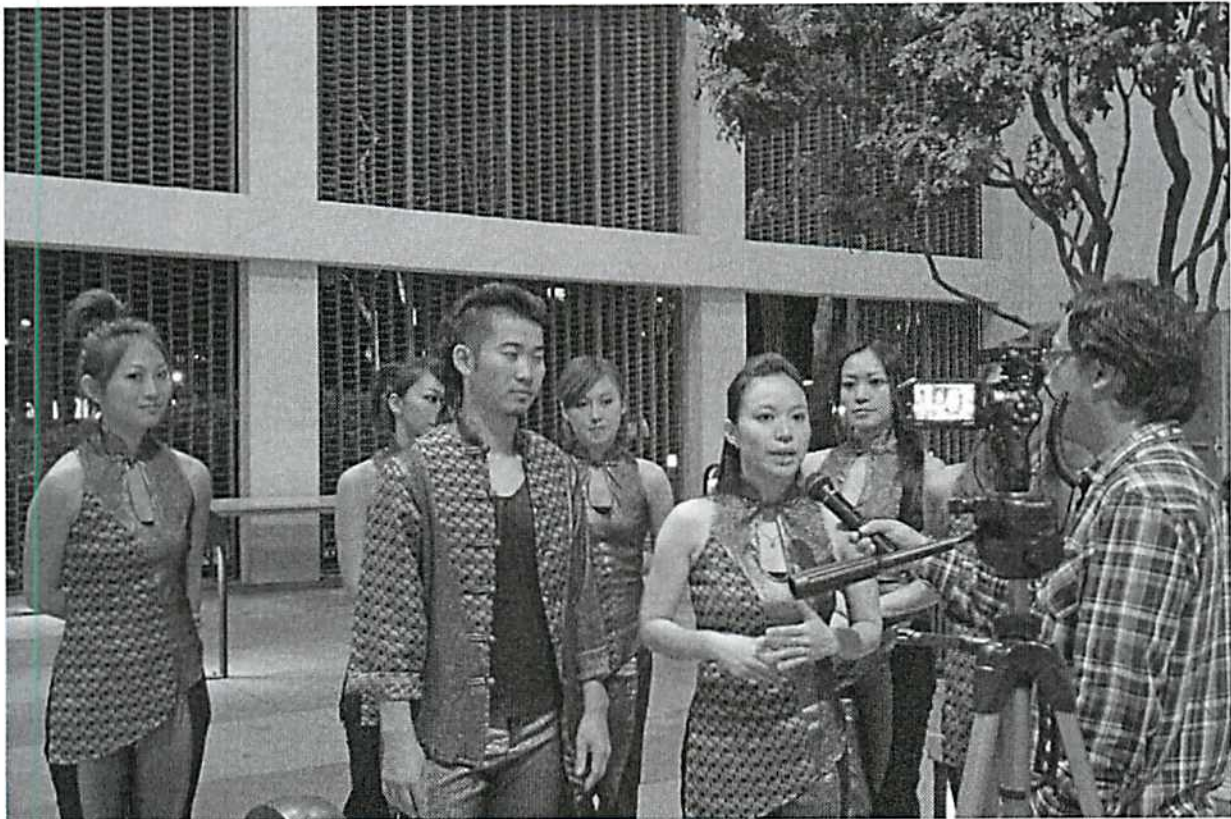
▲演出後接受電視台採訪