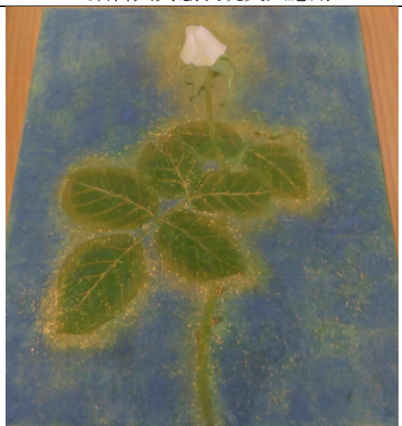
色彩與灑箔的變化