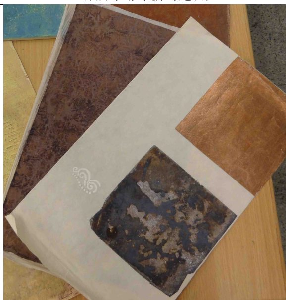
箔類與質感的應用-2