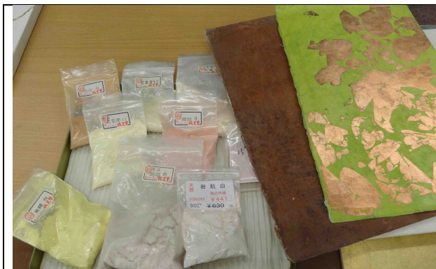
色彩與箔的關連解說