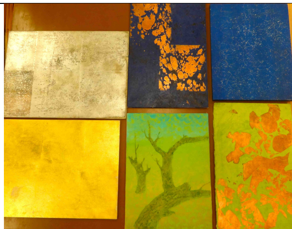
箔類基礎表現方式