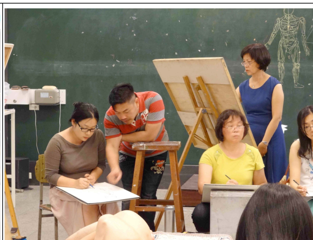
個別指導－人體速寫練習