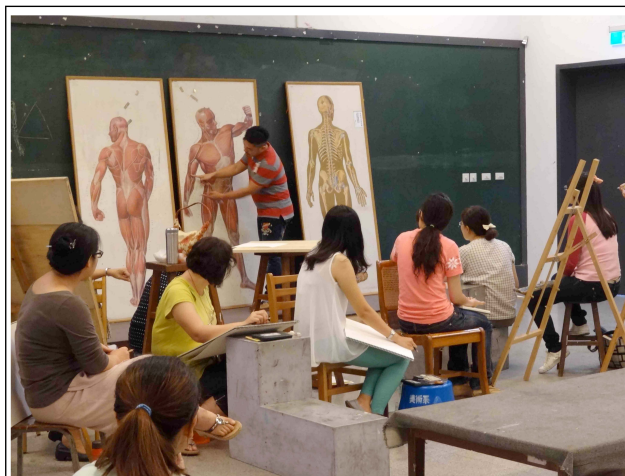
人體寫生－骨骼及肌肉結構說明