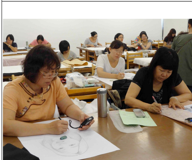
學員埋首構圖修正及轉寫練習