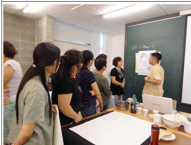
學員認真聽講－構圖檢討