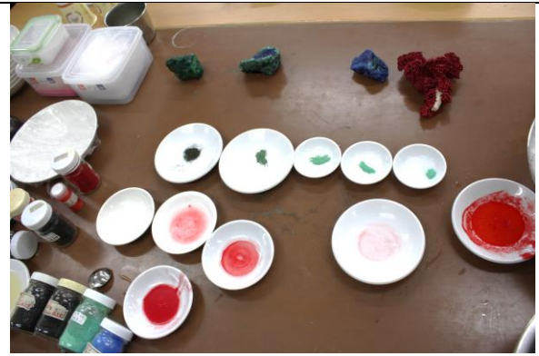
礦物顏料顏色變化說明