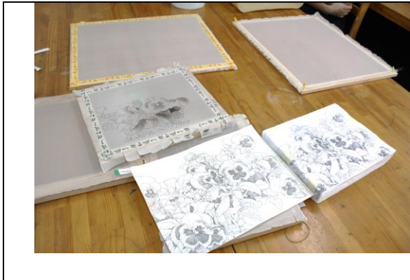
各階段之示範絹本準備