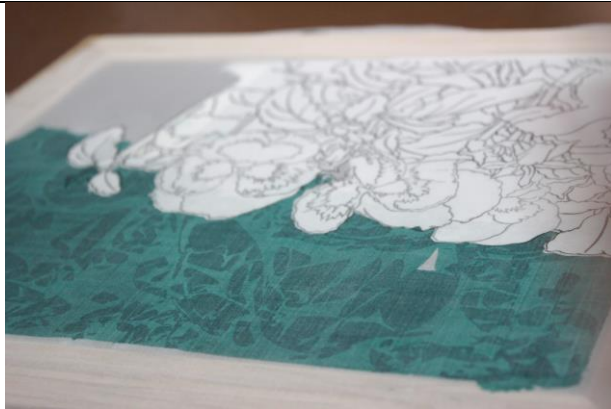
課程中示範技法的運用範例 1