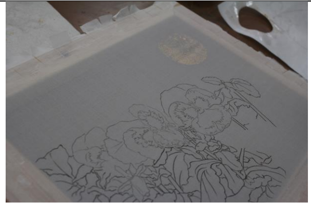
課程中示範技法的運用範例 2