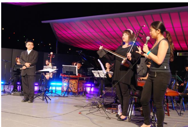
2015/08/21 皇宮花園演出照片