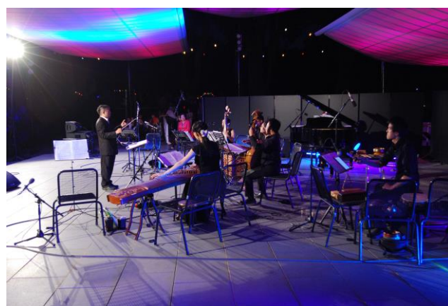
2015/08/23 新媒體藝術中心彩排照片