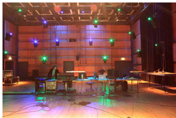
C、Ernst-Reuter-Saal 音樂廳 http://www.ernst-reuter-saal.de/r/home.html