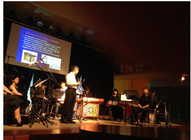
2015/08/28 聖奧古斯丁 Aula Missionsprokur, Steyler Missionare 彩排演出照片