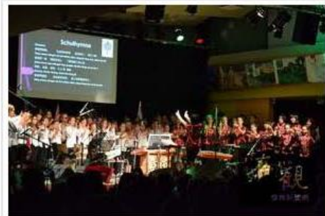
德國北萊茵西伐利亞邦的聖貞中學8月27日舉行「台灣之美」(Taiwan Beauty) 慈善音樂會，圖為鳳山高中與聖貞中學學生合唱演出。

特別的是，聖貞中學將中文列為選修外語之一，該校學生已經修習中文數年，也參加德國政府主辦的「未來的夥伴：中小學校」國際交流計畫 (Pasch)，與台灣的鳳山高中交流。鳳山高中約有1/3學生選修德文，這個暑假更是第一次由老師帶隊赴聖貞中學交流兩週。本次慈善音樂會便由德國學生以中文主持、台灣學生以德文主持，兩校學生並上台合唱中文及德文歌曲，在場觀眾均對台德交流的豐碩成果報以熱烈掌聲。駐法蘭克福辦事處秘書蔡慶禪致詞表示，去年小巨人絲竹國樂團在杜塞道夫的演出，技驚全場，獲得極大迴響，相信這次再次赴德演出，定能讓德國觀眾再對台灣文化驚艷。本次售票慈善音樂會在該校大禮堂舉行，許多來賓甚至站著聽完全場，杜塞道夫、科隆波昂地區的各僑團負責人及僑務榮譽職人員都到場支持參與這場德國少有的台德音樂交流盛事。