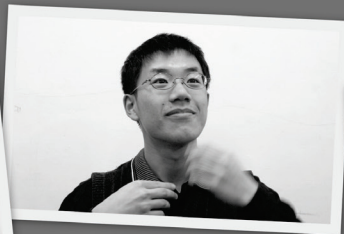
Bass 2 施行一