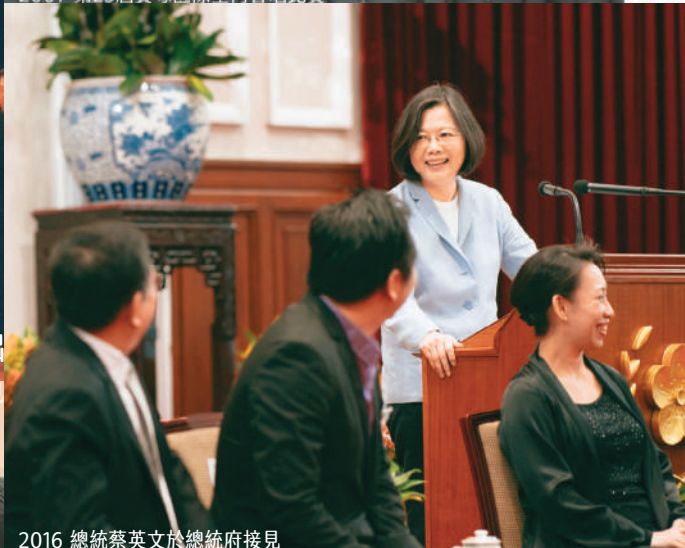
2016 總統蔡英文於總統府接見