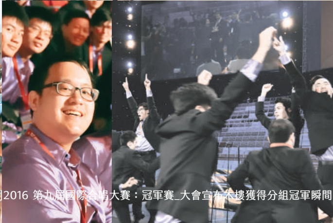
2016 第九屆國際合唱大賽：冠軍賽_大會宣布木樓獲得分組冠軍瞬間