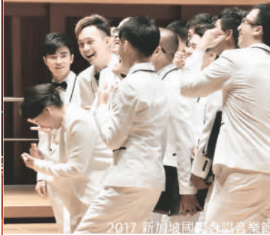
2017 新加坡國際合唱音樂節