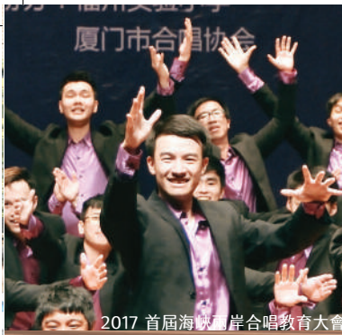
2017 首屆海峽兩岸合唱教育大會