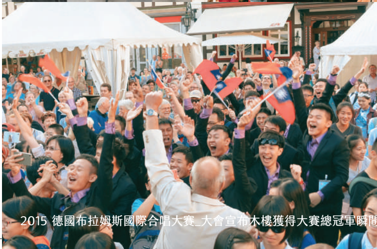
2015 德國布拉姆斯國際合唱大賽_大會宣布木樓獲得大賽總冠軍瞬間