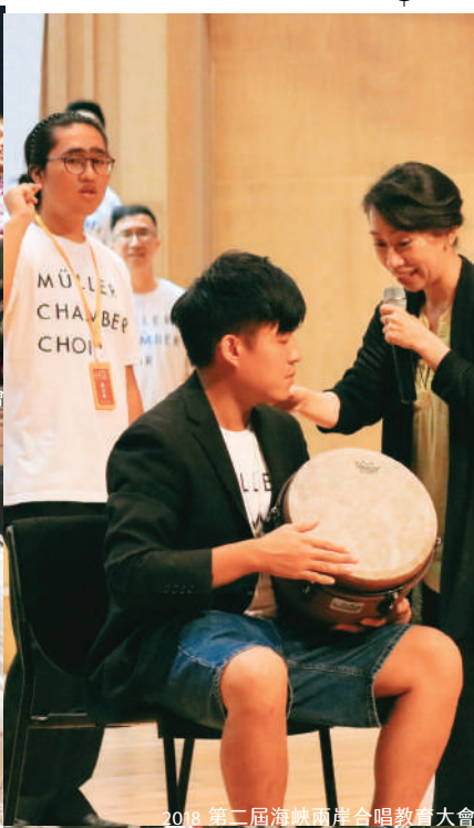
2018 第二屆海峽兩岸合唱教育大會