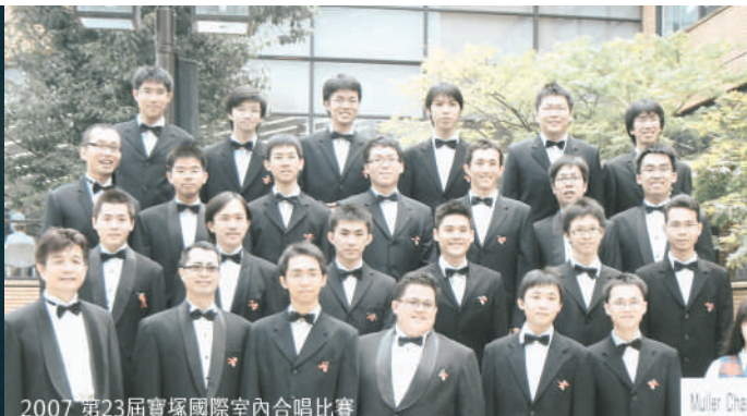
2007 第23屆寶塚國際室內合唱比賽