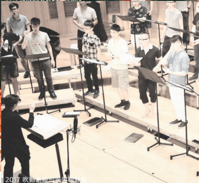
2017 吹動出國的風雲雜誌