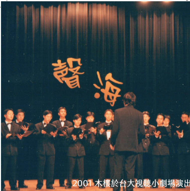
2001 木樓於台大視聽小劇場演出