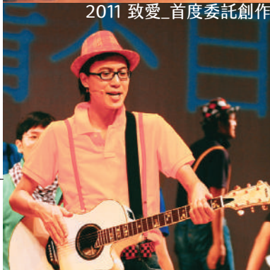
2011 致愛_首度委託創作