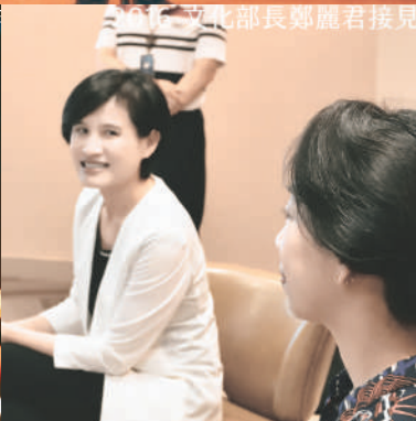
2016 文部長鄭麗君接見