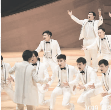
2019 堪薩斯州美國合唱指揮協會ACDA全國總會演出