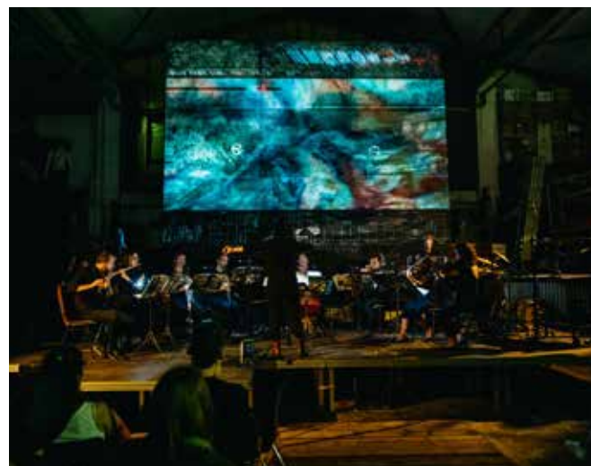
圖說：脈動音樂節。

14 天。創辦人為作曲家貝艾特·傅雷爾（Beat Furrer）與小提琴家恩斯特·科瓦契奇（Ernst Kovacic）。傅雷爾為奧地利維也納當代樂團的創始人，在他的帶領下，維也納當代樂團逐漸壯大，成為現今當代音樂樂壇中數一數二的樂團。脈動音樂節舉行的同時也有脈動學院（Impuls Academy），目的是要讓參與的學生能在紙上理論與實際演出中同步學習，內容有個別課、室內樂、樂團、專題演講，像個小型的達姆史塔特音樂節。脈動學院的長笛講師為愛娃·傅雷爾（Eva Furrer），她擔任過許多當代音樂樂團的長笛成員，同時也是一位瑜伽講師。