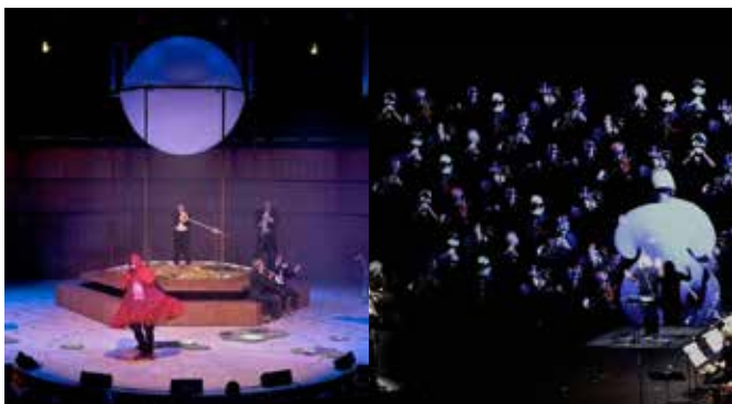
圖說：八橋藝術節。

一年帶來 2 萬 5 千人次造訪的八橋音樂節起始於 2011 年，每一年的 5 月都會舉行。是一個較年輕的音樂節。節目類型有當代音樂、爵士、世界音樂、電子音樂並融合裝置藝術。這個音樂節重新詮釋「表演」這兩個字，把表演帶進城市各角落，所以音樂便不再被動，也不再只發生在傳統的音樂廳、而是在微光的櫥窗中、觀光的遊艇上、貫穿現代人生活各個層面。