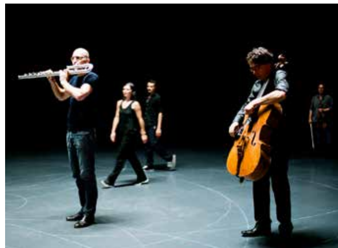
圖說：德國達姆施塔特國際當代音樂節。

「Ferienkurse」意為假期課程，但是內容非常豐富，更像是音樂節。從創立的 1946 年開始至今，已有超過 5000 部作品首演，現在這個音樂節每兩年舉行一次。參加者主要是器樂家與作曲家。在音樂節到了尾聲時，會有個名為「Kranichsteiner Musikpreis」的當代音樂比賽。獲獎者將會有 3000 歐的獎金。我其實是在去年（2020）就想要準備去這個音樂節，但是全球疫情嚴重，2020 年的音樂節延期至 2021 年了。達姆施塔特國際當代音樂節在今年（2021）加入了 Apple Podcast，節目名稱叫做「Darmstadt On Air」，每一集的內容都是有關當代音樂大師對於音樂想法之