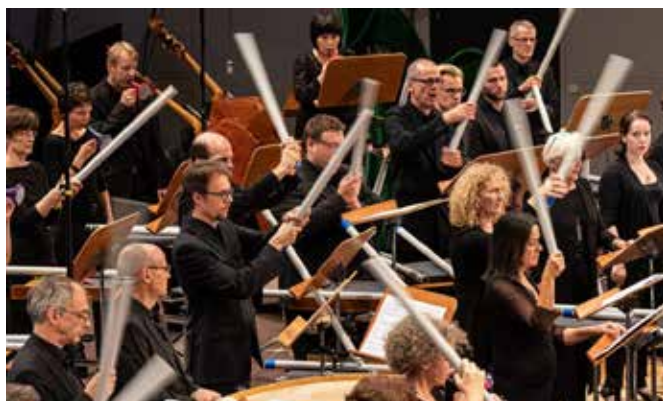
圖說：多瑙埃辛根音樂節演出。

多瑙埃辛根位於德國西南方的黑森林區，是最古老的當代音樂節。起始於 1921 年，每年的 10 月，為期 4 天滿滿的音樂節目與工作坊。今年這個音樂節也要邁入第 100 歲了。至今演出曲目領域橫跨爵士至當代室內樂音樂。這些曲目會由德國西南廣播聲音實驗室（SWR Experimentstudio）結合西南廣播電台交響樂團（SWR Symphonieorchester）之外，也會邀請知名團體如維也納當代樂團（Klangforum Wien）、巴黎當代樂集 EIC 做呈現。