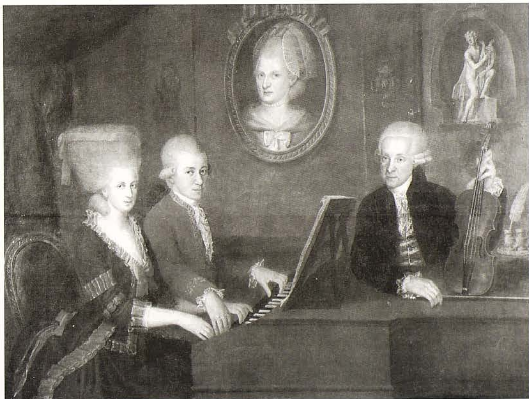
"The Mozart Family" by Johann Nepomuk de la Croce 1780