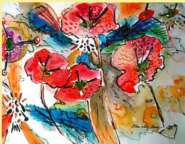
王怡雯繪《水彩素描：飛揚》