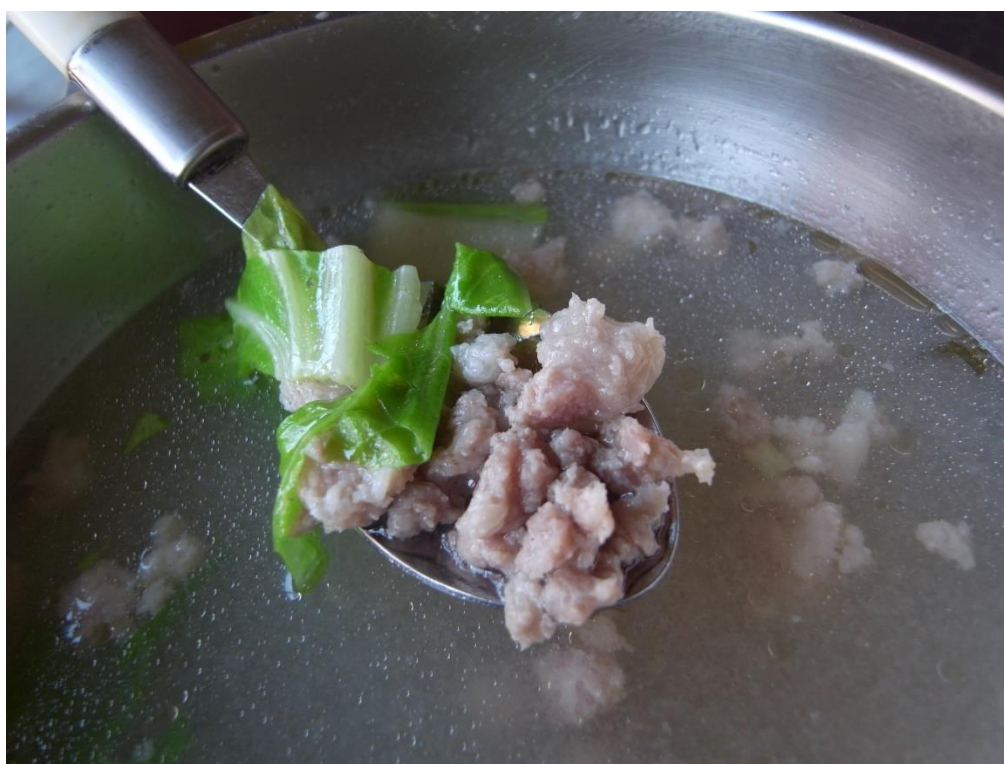
赤肉湯即肉脛湯（碎肉湯）