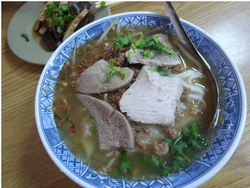
屏東佳冬粩條（肉片、豬肝）