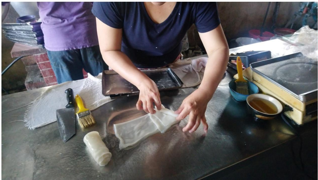
台南六甲面布粿（直接沾醬油吃）