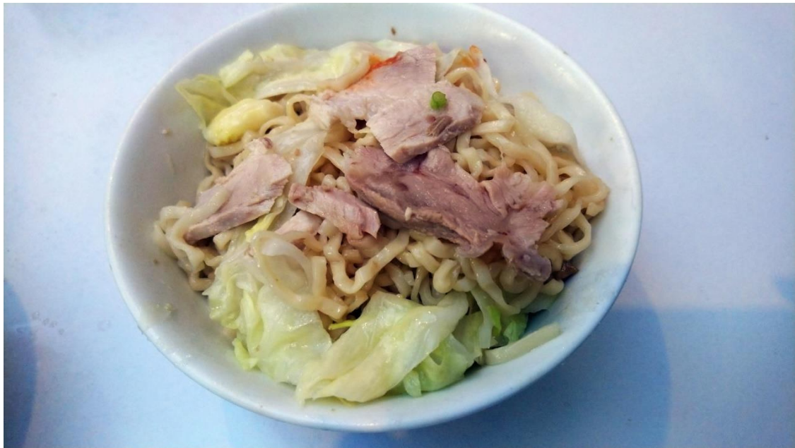
台南意麵上也有放肉片（取肉）