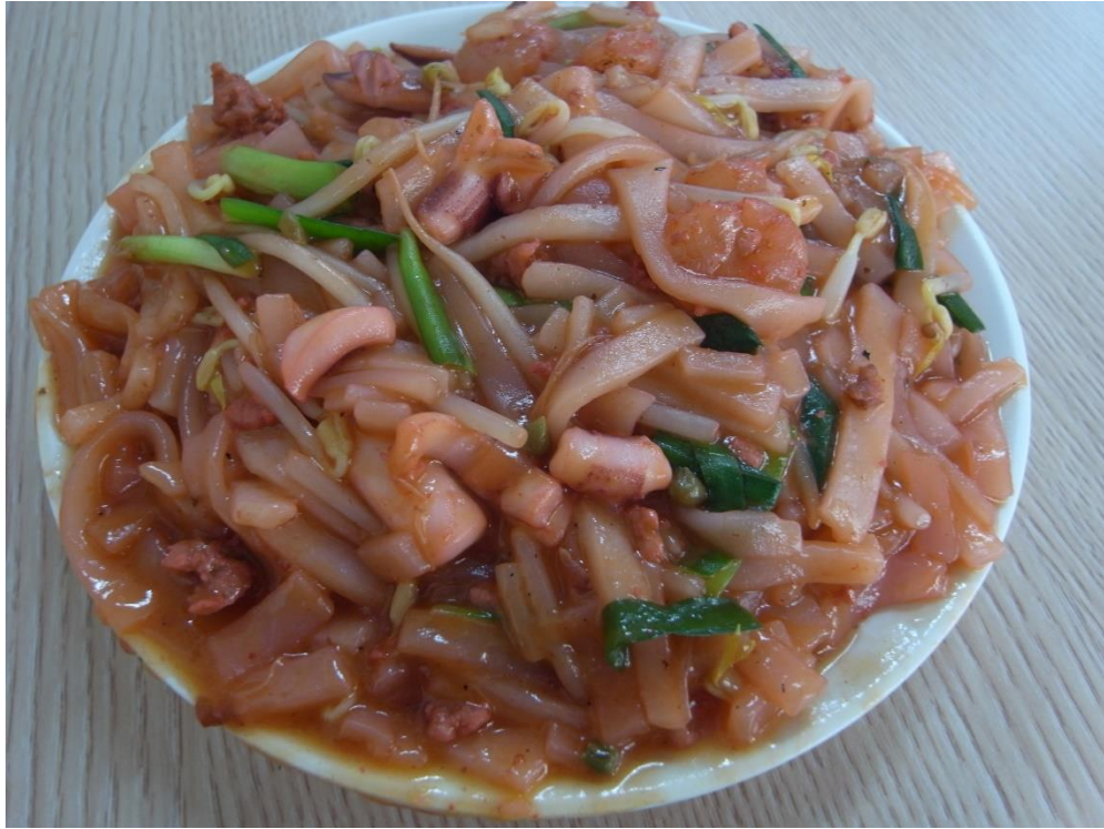
屏東潮州街上炒粿條