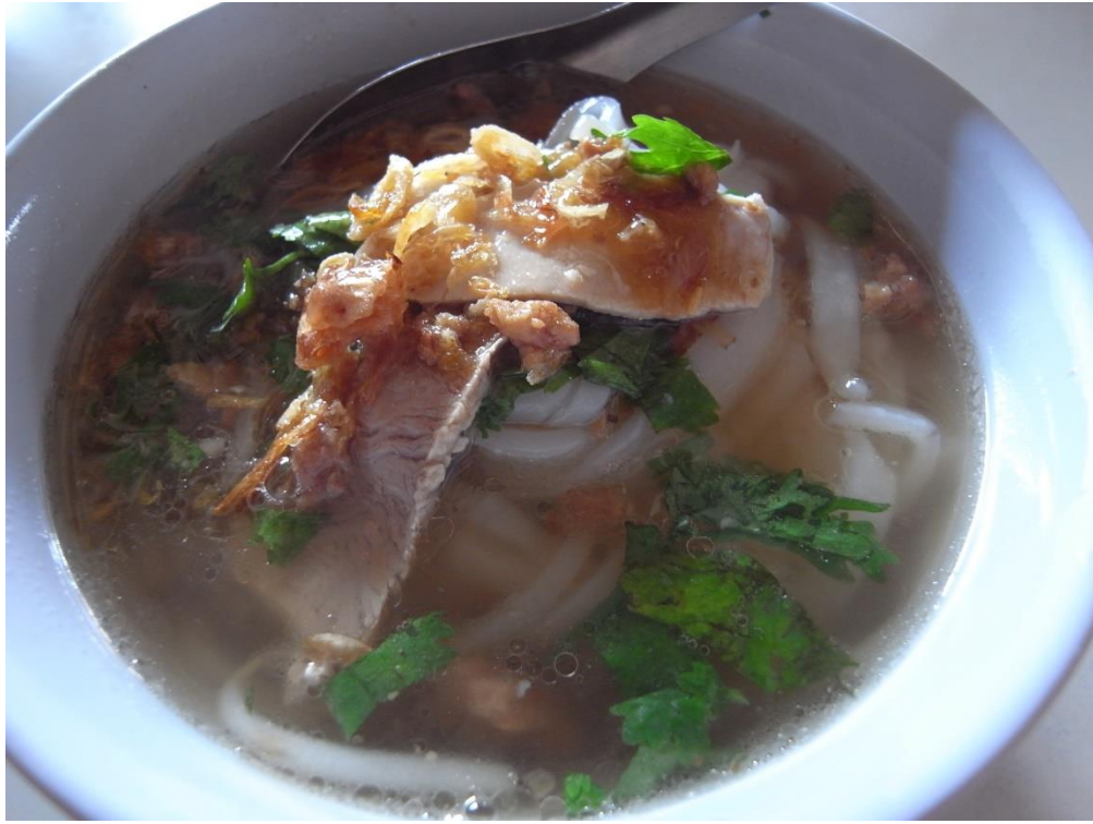
屏東萬巒五溝水粩條