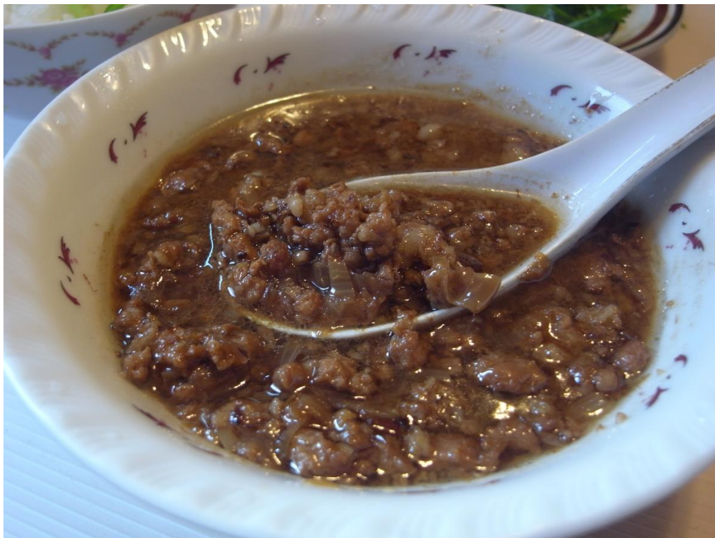
一般家庭煮的肉豉仔