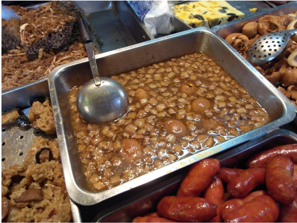
台南市場賣的肉燥