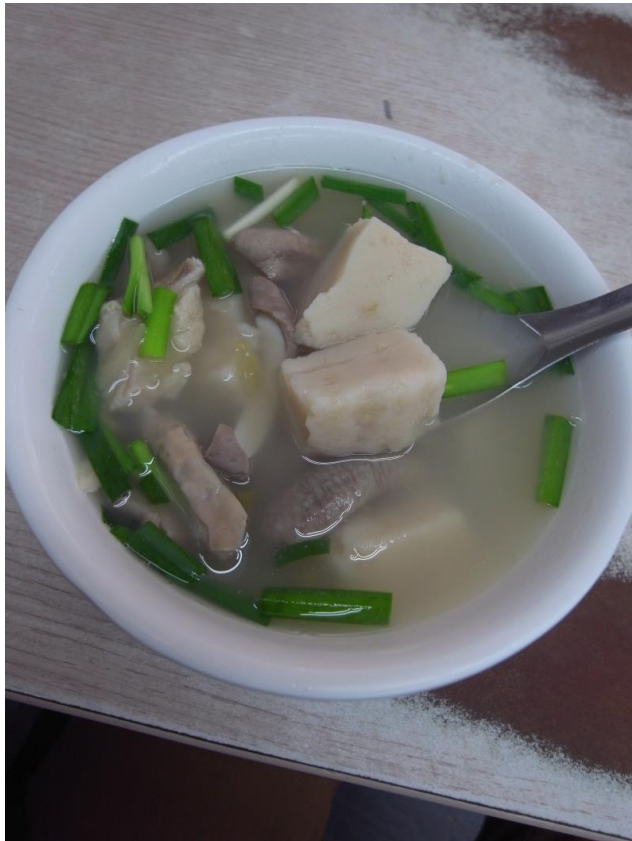
嘉義粿仔湯（蘿蔔糕切塊）