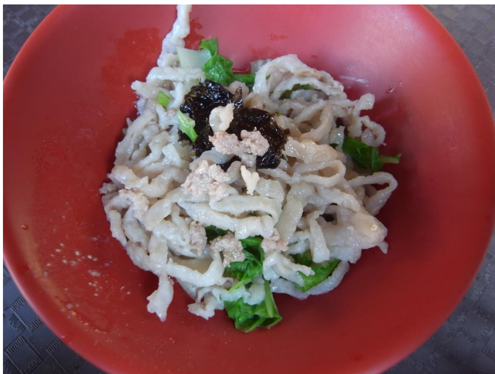
台南魚麵上有碎肉（脛肉）