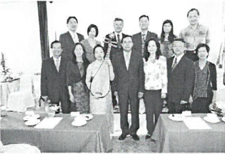
照片四：2013. 11/30: 駐泰國台灣大使館陳銘政大使及夫人伉儷(前排右四右三)、駐泰國台灣大使館新聞組陳志寬組長(前排左一)、駐泰國台灣大使館新聞組吳德信組長(後排左三)、旅泰著名台灣薩克斯風大師李賢教授(後排右一)、駐泰國台灣大使館秘書們及其夫人們，於台灣琵琶大使駱昭勻(Luo Chao-Yun)泰國台灣大使館琵琶獨奏會后共同合影留念！