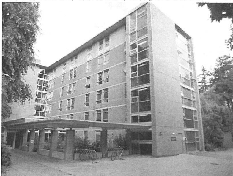
溫哥華為 UBC 大學安排住宿於學生宿舍 Korea House，一人一間，整潔舒適