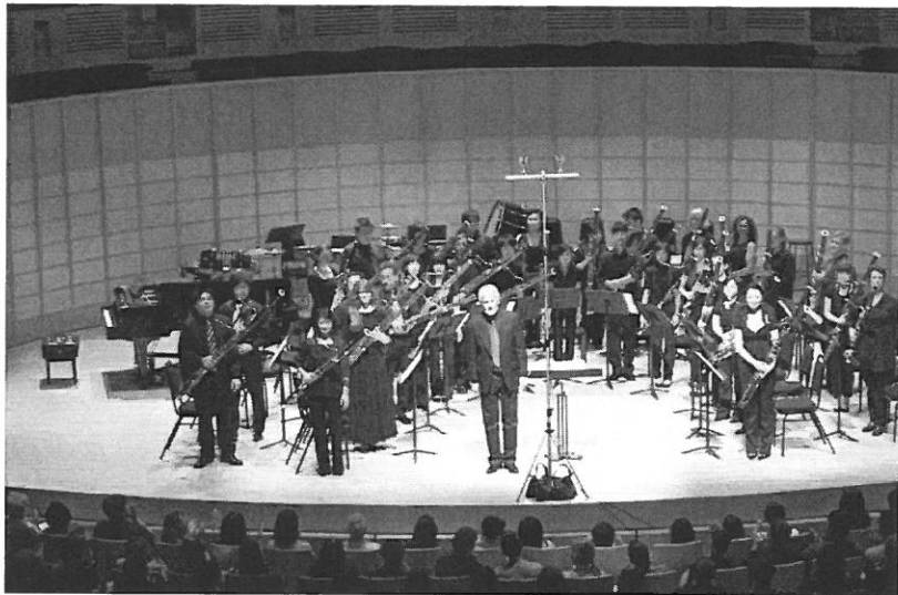
UBC 教授 Jesse Read 指揮藝術室內樂團與 UBC 學生大合奏