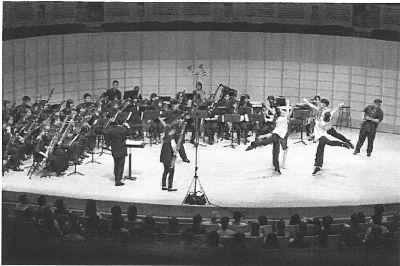
藝術室內樂團 結合焦點舞蹈團演出