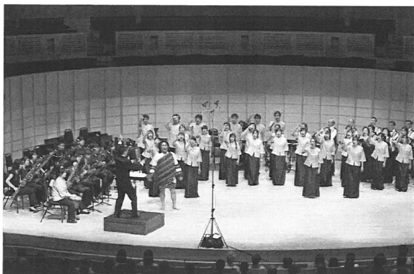
藝術室內樂團與合唱團演出