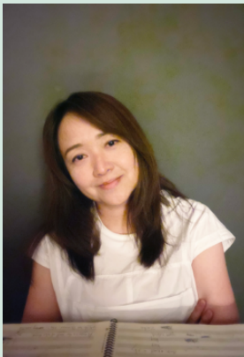
作曲家 / 趙菁文 Ching-Wen Chao

在新作《在影子上，彩虹的聲音們》，我還想試著讓這些色彩物件，聯繫到我在創作上的另一個喜好，也就是與童年元素的結合。音樂盒、風鈴、竹子、沙鈴、時鐘滴答、木魚、紙張、兒歌...，帶出許多「色彩」的角色，在一幕幕的情境中輪番上陣，與四件樂器們各有搭配與對話，上演「一場聲音與色彩互相滲透、糾纏的遊戲」。在經歷了一些顛沛流離的探索後，回到夢幻與和諧，或是失控的愉悅；有聲響互相衝突的激烈高織度，也有奇怪的顏色漩渦，魔幻與現實...。這些彩虹的聲音們，述說著音樂的故事。