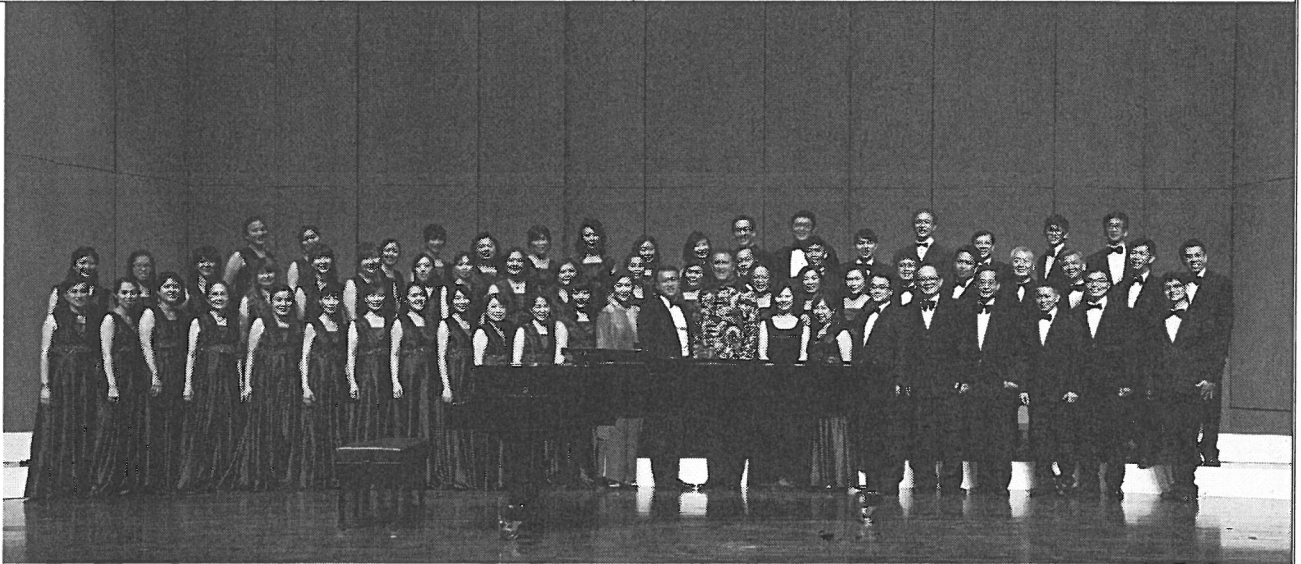
音樂會演出人員大合照