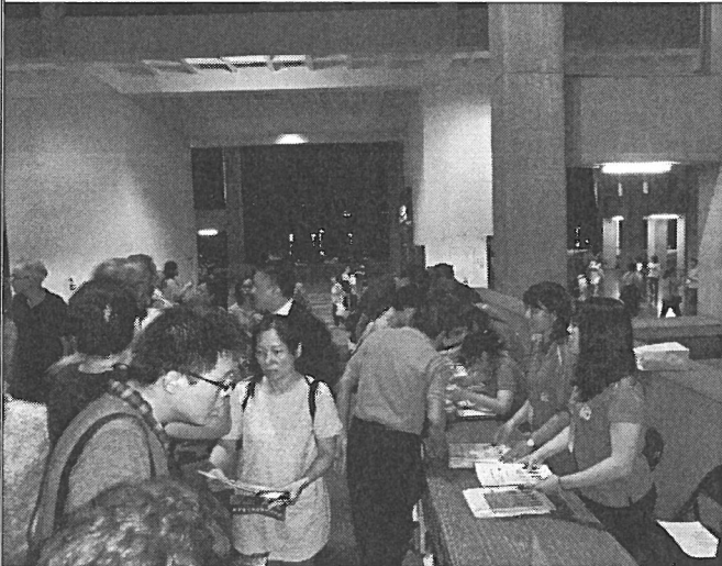
音樂會前台高室內週邊商品販售