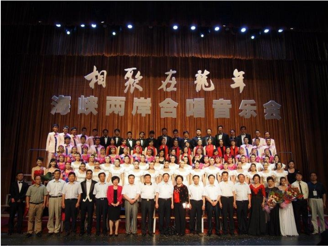
太原音樂會結束後與聯演團體大合照