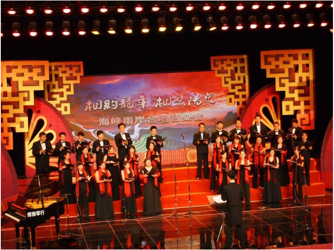
陽泉電視台演藝廳音樂會中