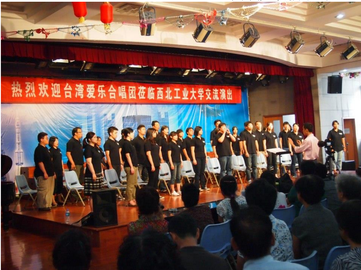
西安工業大學講座音樂會