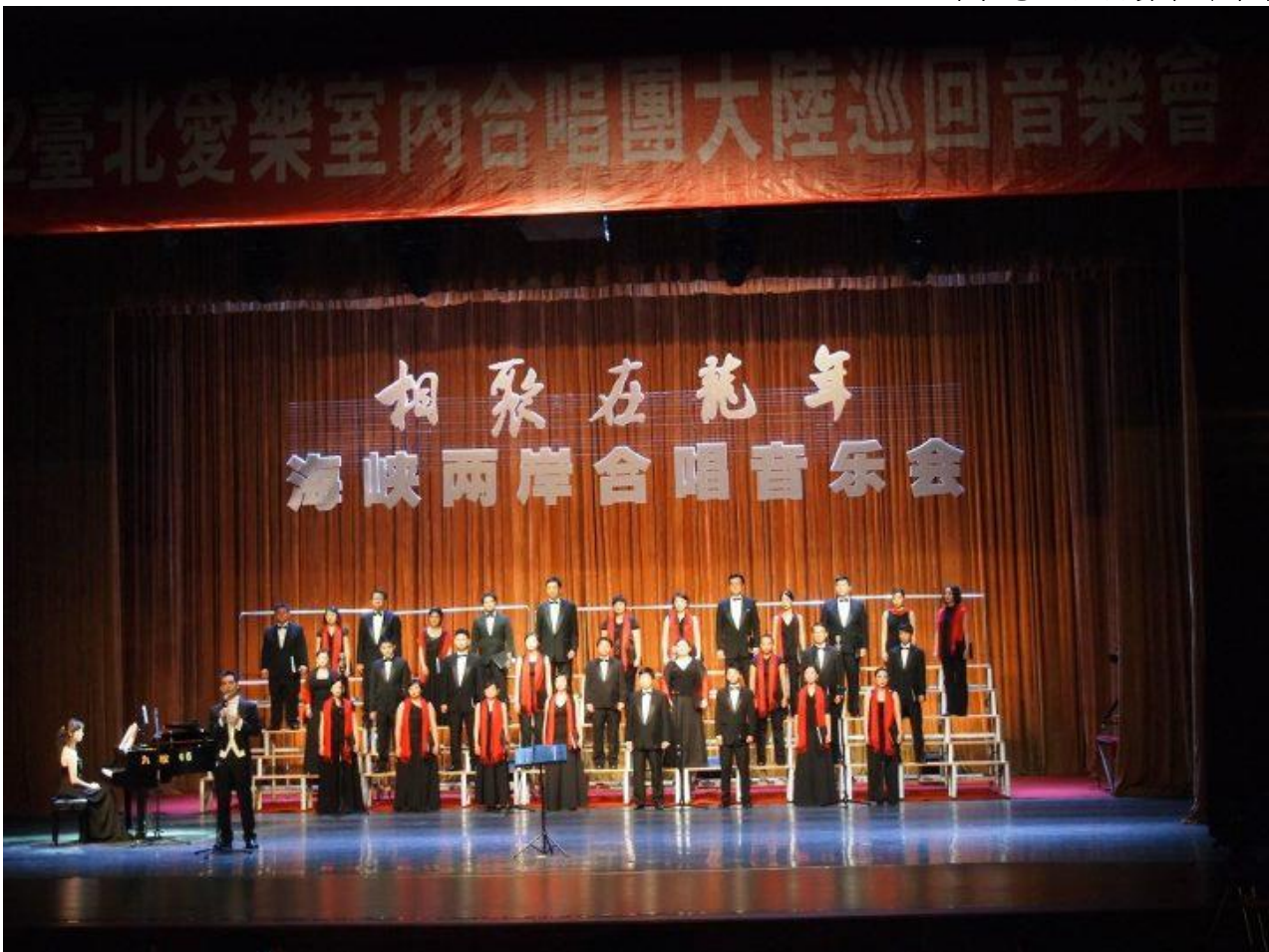
太原青年文化宮音樂會中