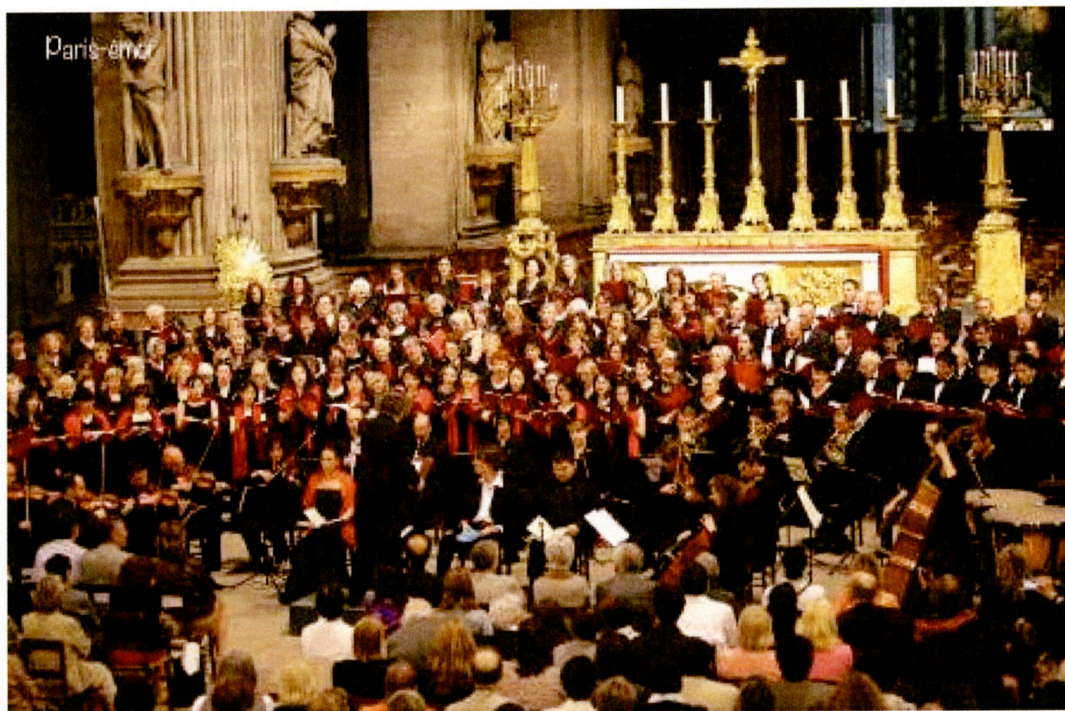
台北愛樂室內合唱團與巴黎當地連演團隊 Chœur Hugues Reiner 演出莫札特《安魂曲》於 Église Saint-Sulpice