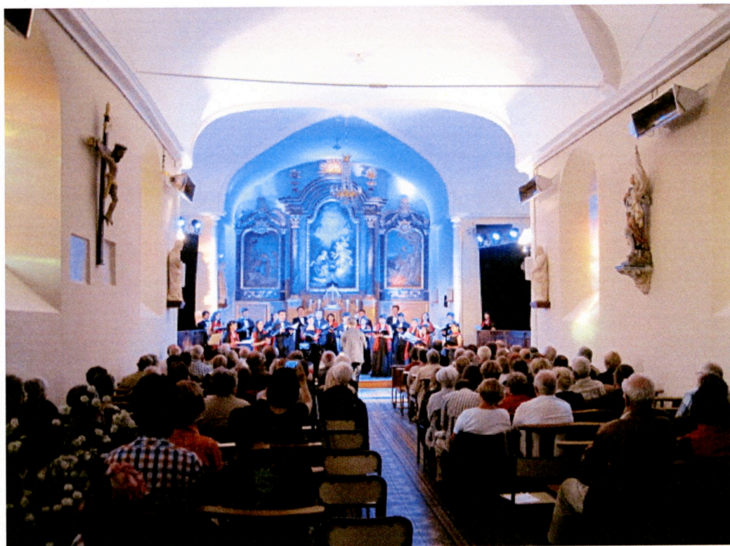
台北愛樂室內合唱團於法國下諾曼第 Surtainville- Église 演出