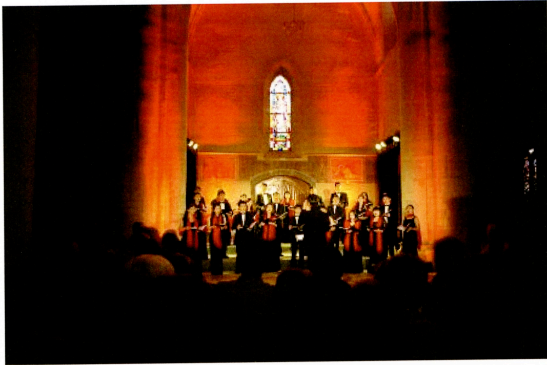
台北愛樂合唱團於法國下諾曼第 St-Fromond-Abbatiale 演出