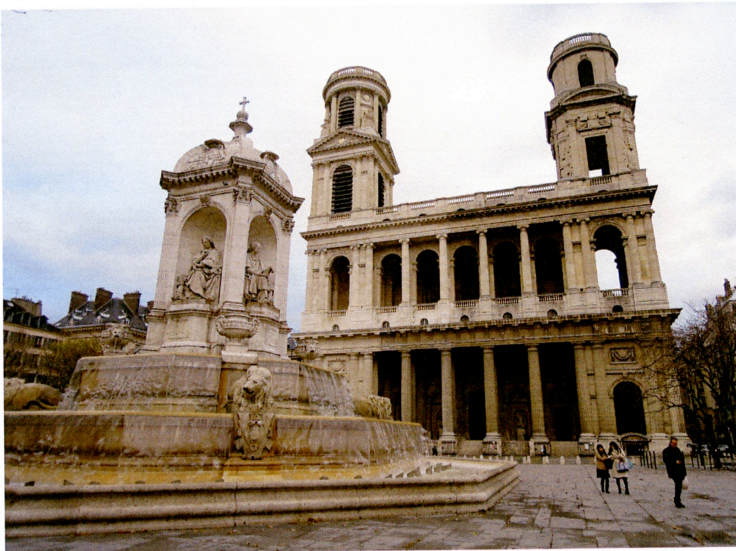
Église Saint-Sulpice 外觀