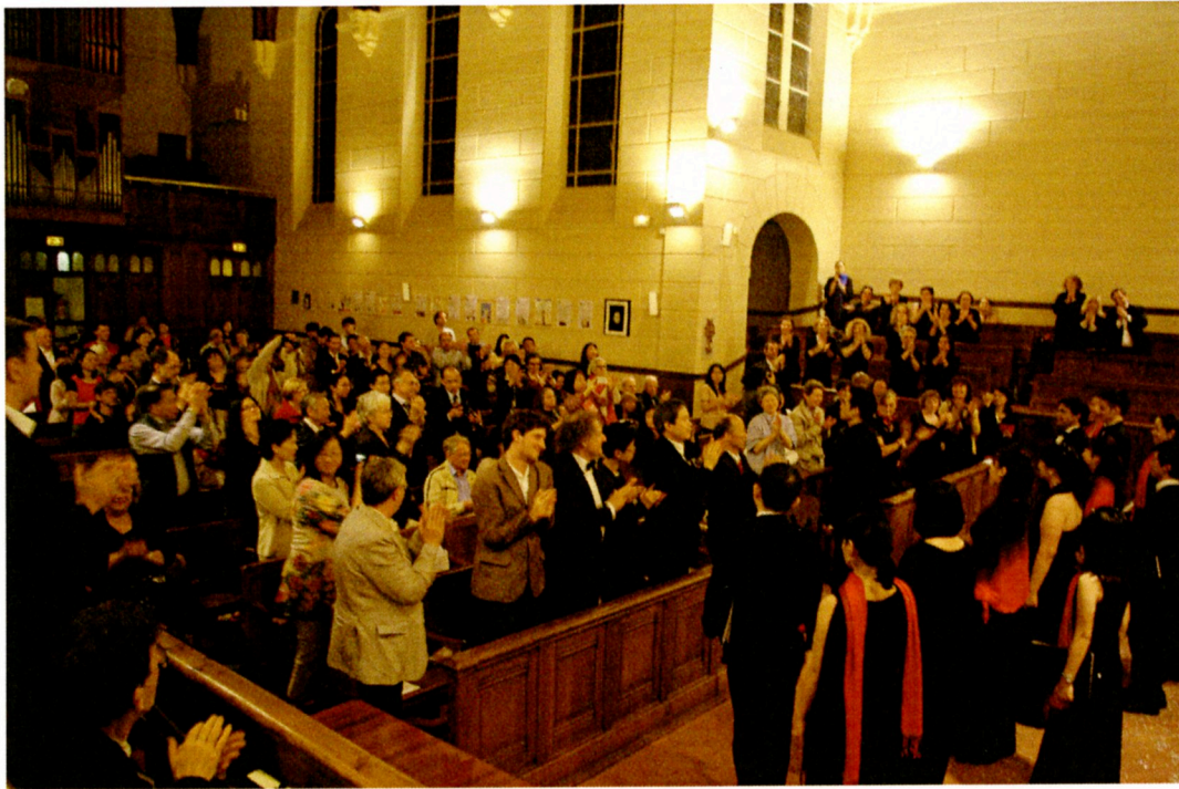
台北愛樂室內合唱團 於巴黎 Temple de passy 教堂演出，獲得滿堂彩