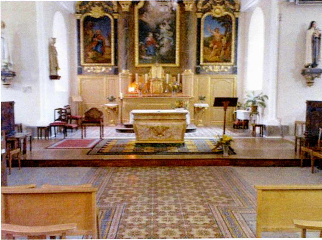
Surtainville- Église 舞台