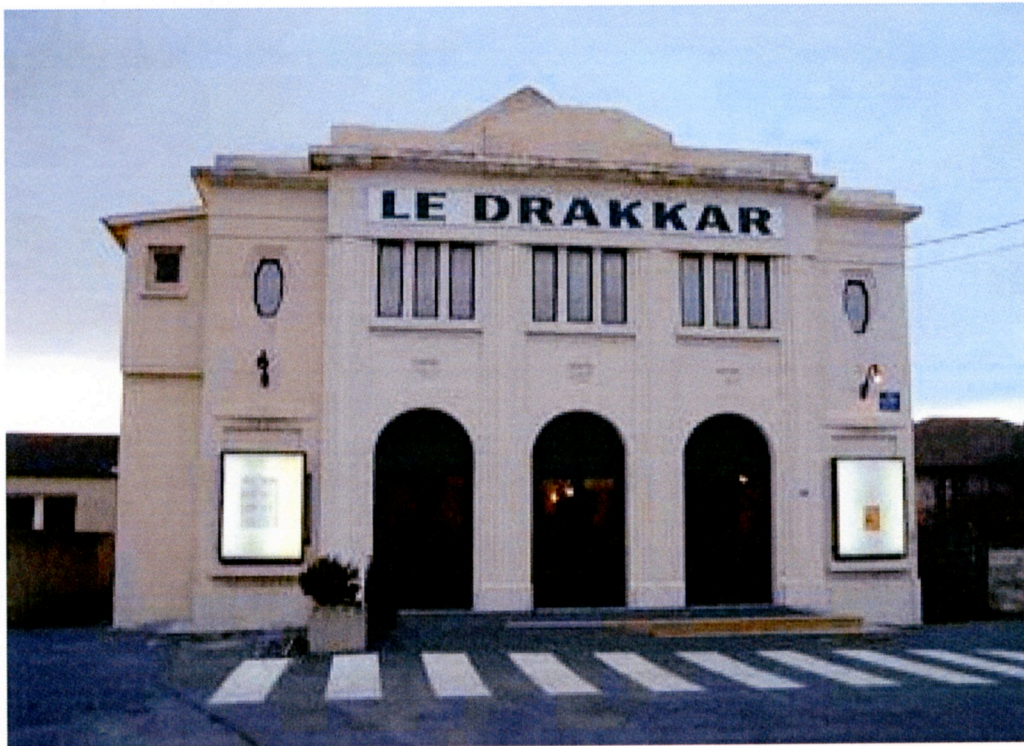
Luc-Sur-Mer-Cinéma Le Drakkar 外觀