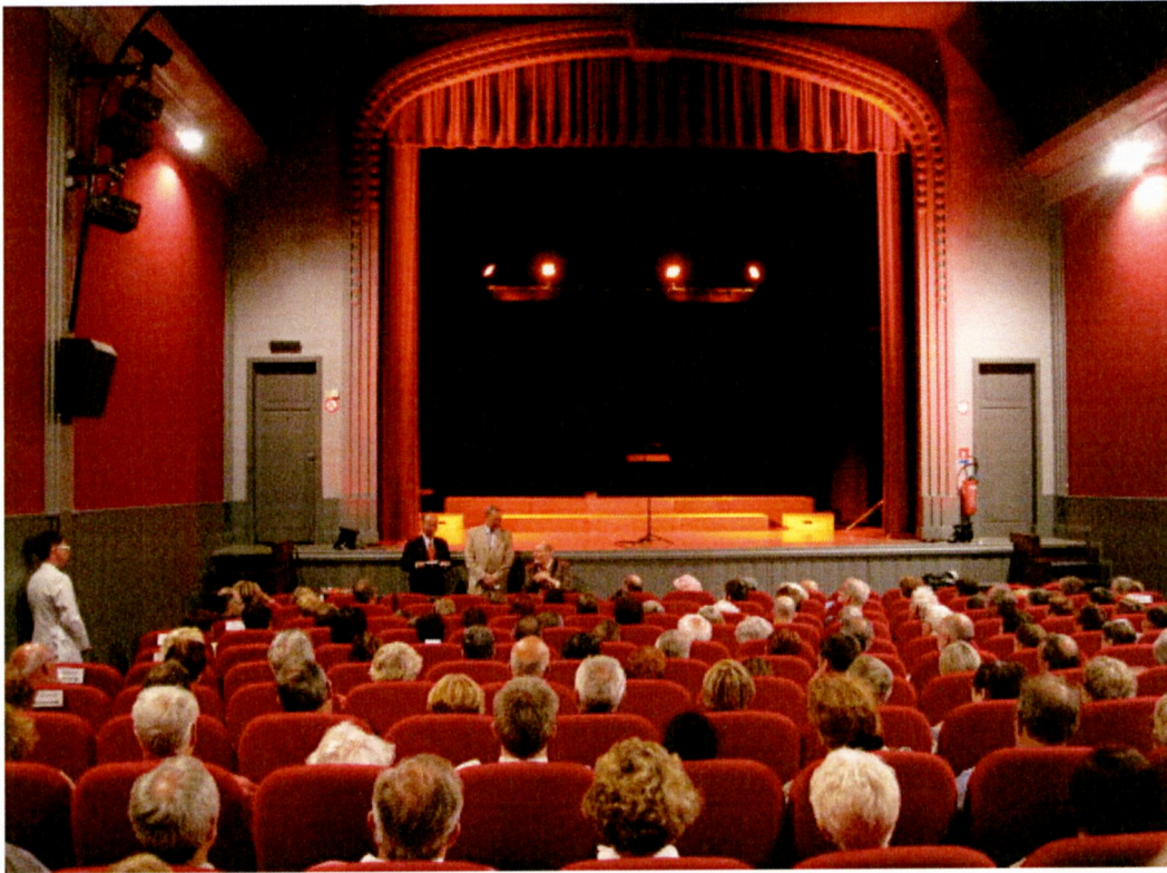
Luc-Sur-Mer-Cinéma Le Drakkar 舞台