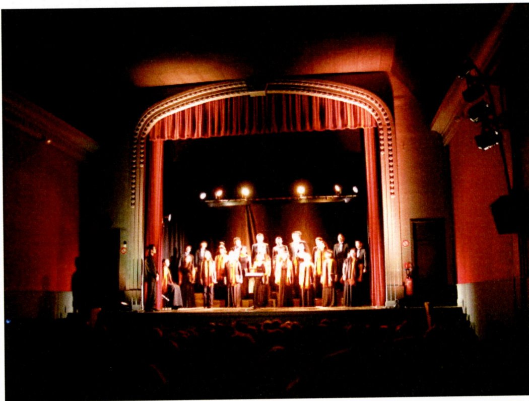
台北愛樂合唱團於法國下諾曼第 Luc-Sur-Mer-Cinéma Le Drakkar 演出