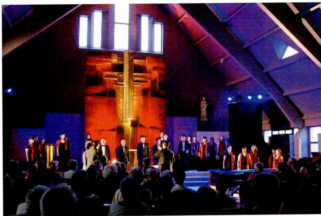
台北愛樂室內合唱團於法國下諾曼第 Agon-Coutainville-Chapelle ND des Flots 演出