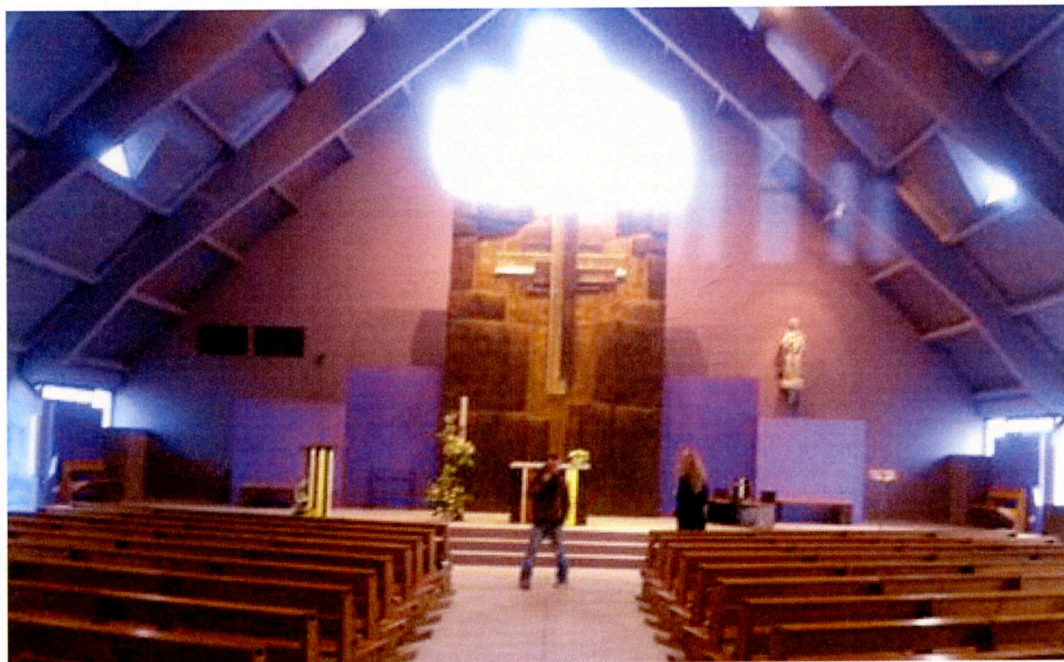
Agon-Coutainville-Chapelle ND des Flots 舞台