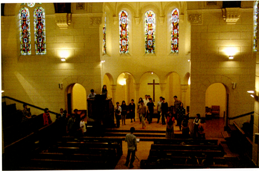
Temple de passy 舞台