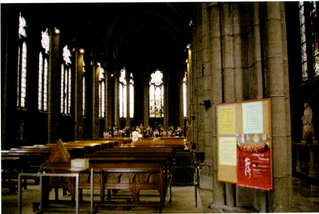
台北愛樂室內合唱團 綵排『印象台灣』音樂會