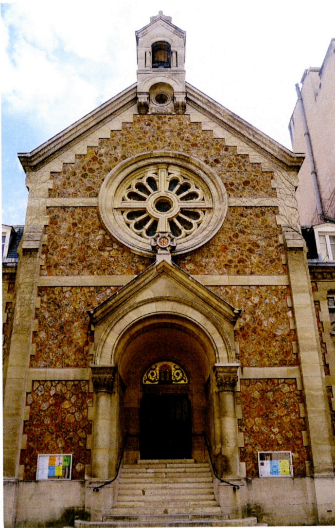
Temple de passy 外觀

2. 活動場地簡介（檢附場地室內外照片，或演出場地、舞台、劇場/音樂廳內外及觀眾席等之照片）：