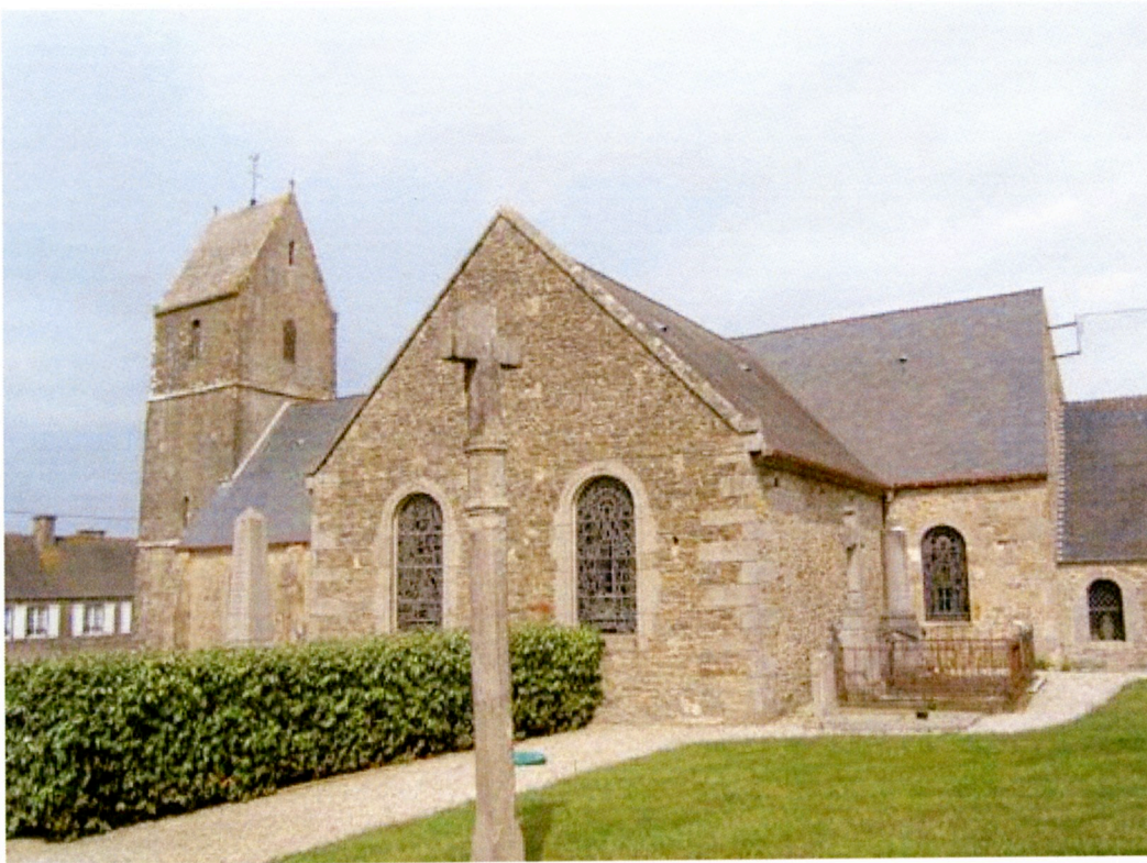
Surtainville- Église 外觀