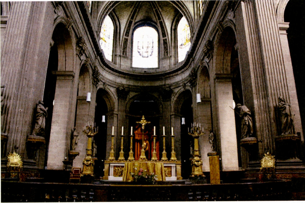
Église Saint-Sulpice 舞台