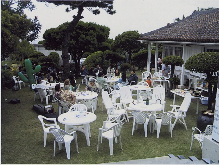
展期中館方舉辦餐會招待美軍官方以及政府相關人士參與