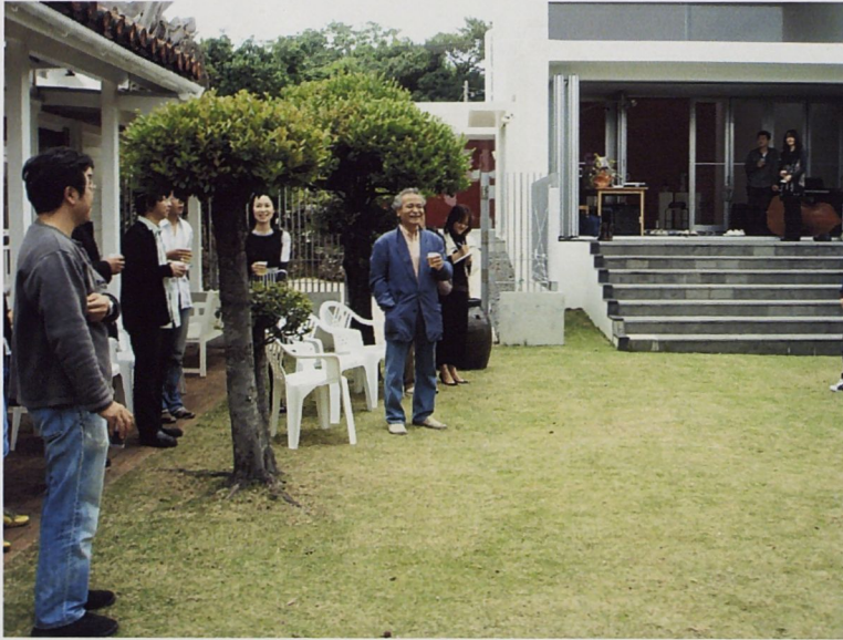
開幕茶會時美術館館長大田先生在會場致詞