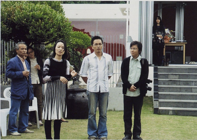
開幕時介紹台灣藝術家