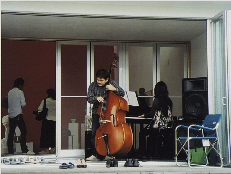
開幕時的爵士樂演奏