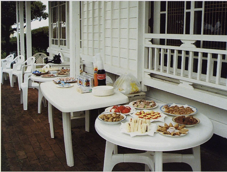
開幕茶會美術館招待餐飲