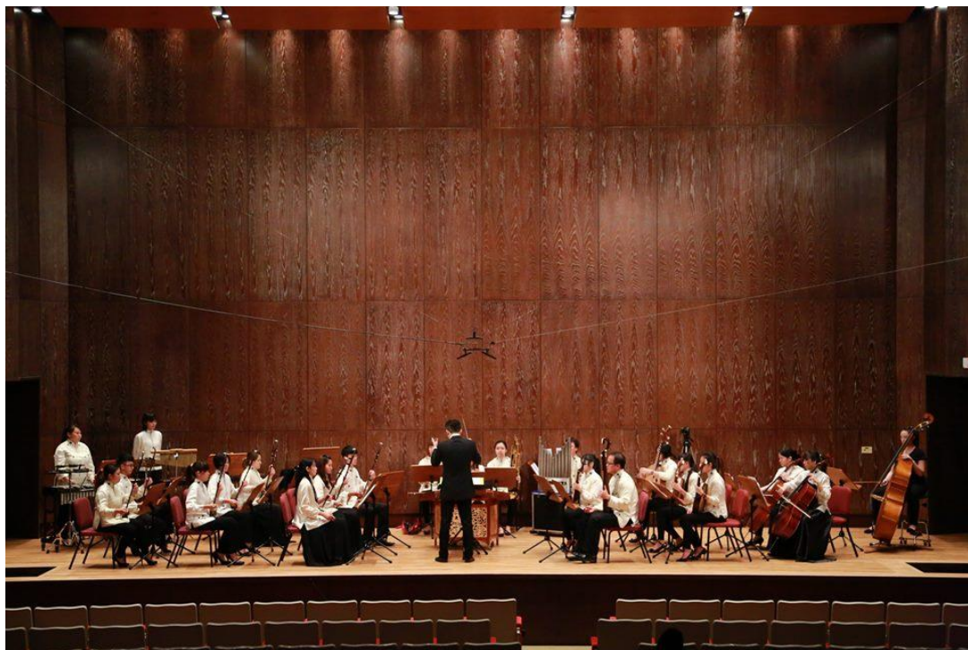
▲105/9/3 演出實況－聯合民族管弦樂團合照