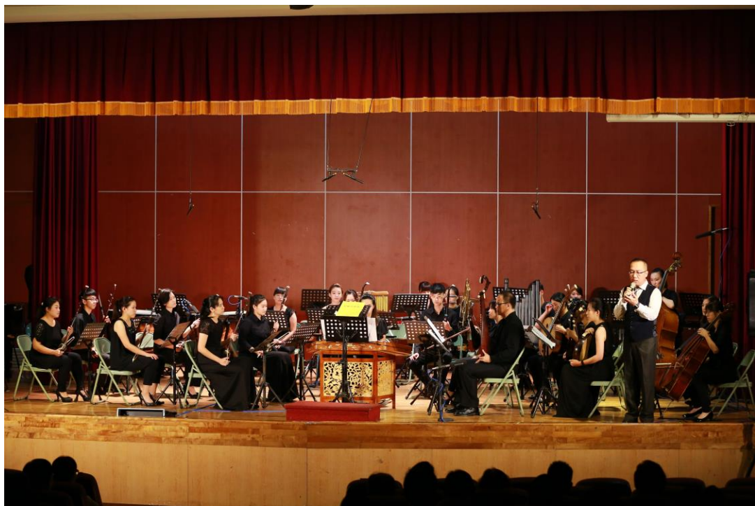
▲105/9/3 演出實況－聯合民族管弦樂團合照