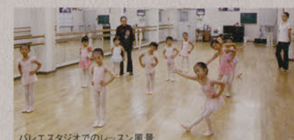
バレエスタジオでのレッスン風景

内容 レッソンの始まりは挨拶から。まずマナーを学び、次にリズムに合わせて、まっすぐに立つ、体をやわらかくするなど、誰でも参加できるバレエの「はじめて」を体験します。