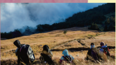
部落地圖 | 30min

為什麼要逃跑?賺取更多錢?追求更好的工作?本片透過草雲與維興的現身說法，呈現「逃逸外勞」的生命處境，他們拋開合法的工作身分，鋌而走險在外工作，在台灣窮盡青春，試圖為家人掙得一個更好的生活，也為自己改變未來的命運。