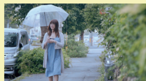
游移之身 | 32min

在土地與文化世代轉換消逝的歷程中，紀錄部落各年齡層的內部對話。透過自身對部落的想望與實踐，與青年進行部落地圖的製作。導演與家鄉環山部落青年用雙腳畫出部落的傳統領域，完成一趟守望祖先的來時路。