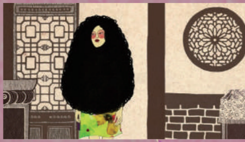
櫛髮 | 4 min

張聖容與金芳蓉兩位女數學家，成長在台灣 60 年代青梅竹馬的女生，本片真實紀錄兩位成功的女數學家，一生追逐數學夢的心路歷程。兩人的故事同時陳述學數學不但沒有性別限制，反而因為身為女性擁有細膩、安靜與專注的性格，成為學數學的一種優勢。