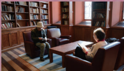
學數學的女孩們 | 75min

本片關於女數學家-徐道寧做為台灣第一位女數學博士，和她一生奉獻給台灣數學教育的故事。影片藉著自述與訪談，勾勒她的生平與成長歷程，側面觀察她作為一位女性，在動盪的時代下，如何以她特有的女性特質、性格與抱負，投注他畢生智慧與精力於台灣科技與人格教育，並發揮其強大影響力。