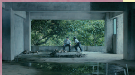
日正當中 | 18min

「海星女孩」擁有特殊敏感體質，在水裡悠然自得，但離開水面就瞬間僵硬動彈不得。透過不斷書寫、繪畫、自我對話，在鏡頭安靜凝視下，帶著觀眾一同潛入平靜的海底，呈現水面上與水面下截然不同的面貌，展現如孩子般最真誠的告白。