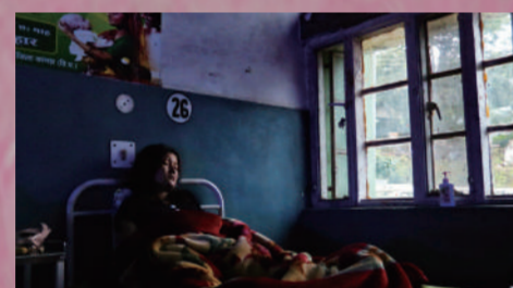
流亡之後 | 72min

Last Night 有兩個意義，一是「前一個晚上」，一是「最後一晚」。這是最後一夜能觸碰你的肌膚，天亮以後，我們發生的事情嵌入我的身體，成為我血液皮肉的一部分，有時在日常突然感到一瞬冰冷，大約就是記憶如幽靈般穿透身體，提醒我們從來都存在。