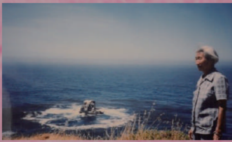
科技與性別-數學女鬥士：徐道寧 73min

本片關於女數學家-徐道寧做為台灣第一位女數學博士，和她一生奉獻給台灣數學教育的故事。影片藉著自述與訪談，勾勒她的生平與成長歷程，側面觀察她作為一位女性，在動盪的時代下，如何以她特有的女性特質、性格與抱負，投注他畢生智慧與精力於台灣科技與人格教育，並發揮其強大影響力。