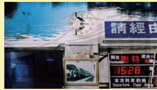
小團圓記 | 39min

天生頭髮毛燥不堪的女孩，每天整理頭髮時，梳子總是會斷成兩截，女孩只好再度上街買把新梳子，這次為了重要的日子，非得買到一支能把頭髮變柔順的梳子。設定主角的頭髮天生毛躁，來呈現梳頭髮上由毛躁到柔順的心情轉折，代表每個女生都愛美的心情，特別是在訂婚、結婚的日子，希望自己能呈現最美麗的一面。