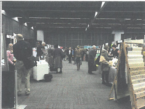
室內(保存修復材料設備展覽會場)