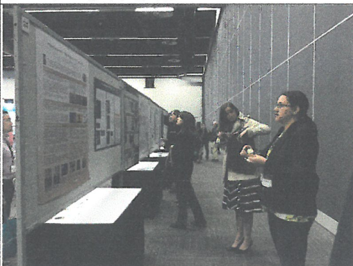
室內(海報發表展場)