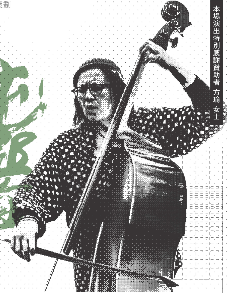
本場演出特別感謝贊助者 方瑜 女士