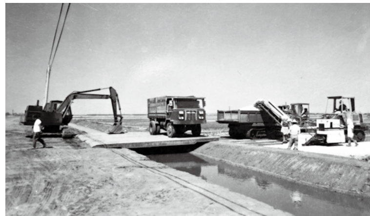
「面前溝」需鋪設6塊鐵板，以便卡車停靠。