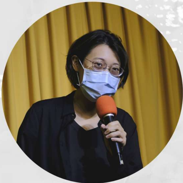
創作提案、演出：蔡茵茵