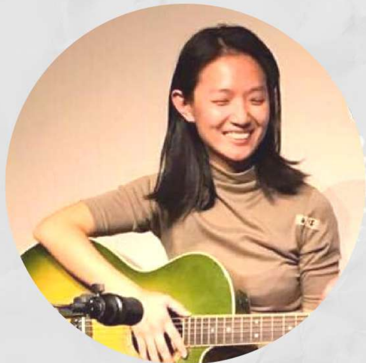
創作提案、演出：賀湘儀