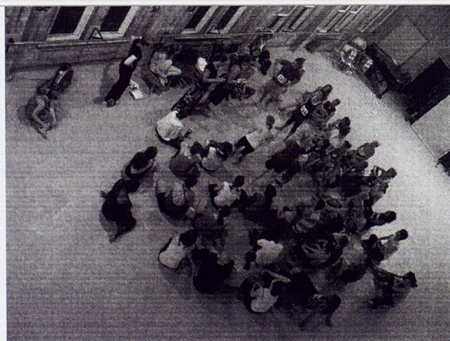
參與 Collins 老師 Audition