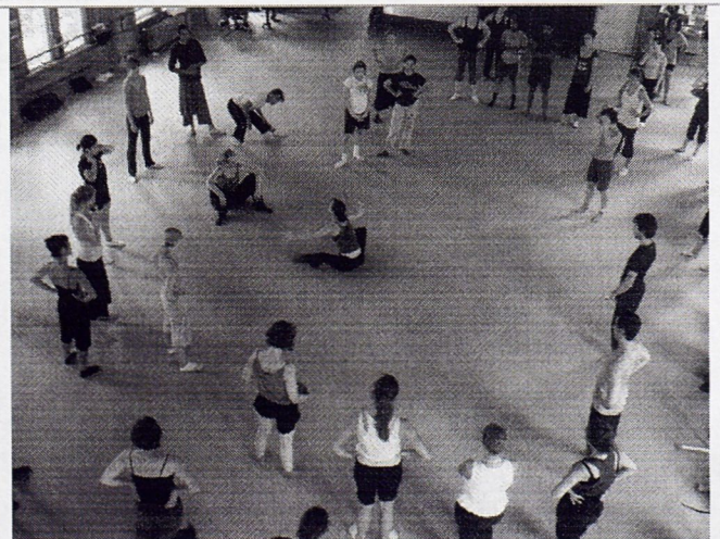
本課程由沈偉舞團的舞者帶領教學，體驗其舞團的肢體風格