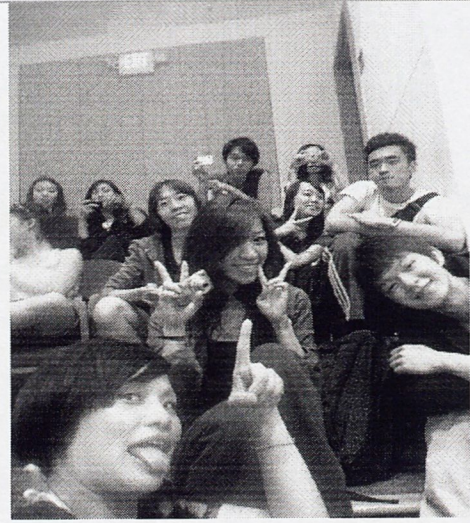
所有參與 ADF 學生的第一個會議，宛如小型的地球村