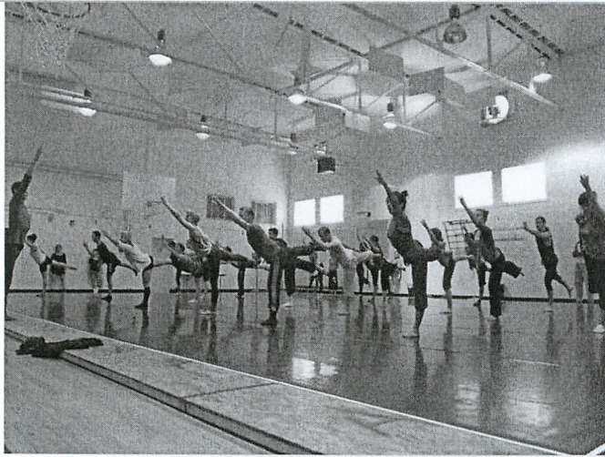
圖 5、Jesse Zaritt 的技巧課