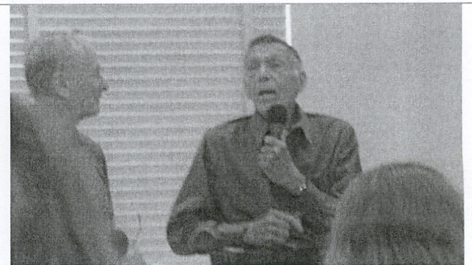
圖 2、學員親自與現代舞泰斗 Paul Taylor 對話