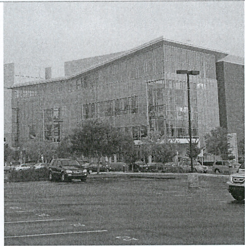
Durham 當地新的演出劇場 DPAC