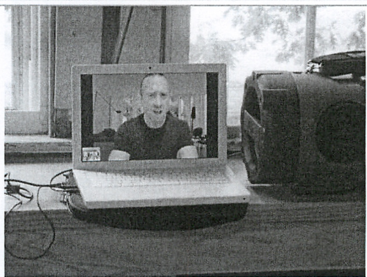
圖 8、學員美國現代舞大師與 Forsythe 透過視訊編舞