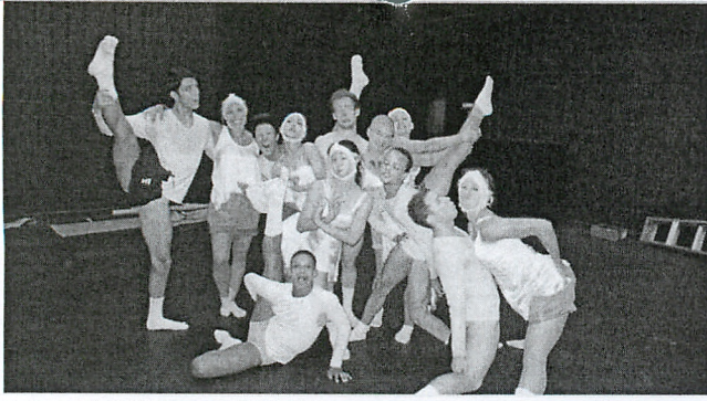
圖 3、台灣學員與 ADF 國際學生一同參與俄國編舞者 Tatiana Baganova 的作品—SEPIA