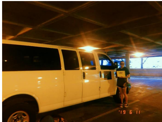
這是我們抵達德罕機場，來接我們去住宿地方的車