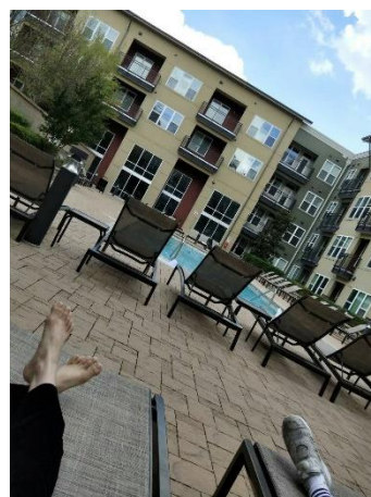
這是位於一樓的泳池