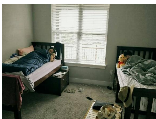
雙人房（我們住四人，所以內包含兩間雙人房）