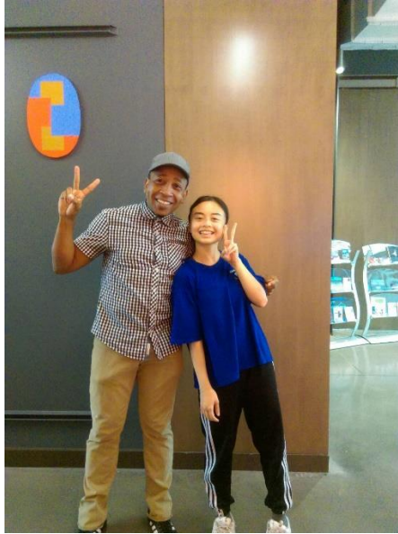
Afro-Contemporary Technique Anderson