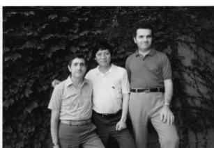
左起祕克林神父哥哥、 鄭思森老師、祕克林神父