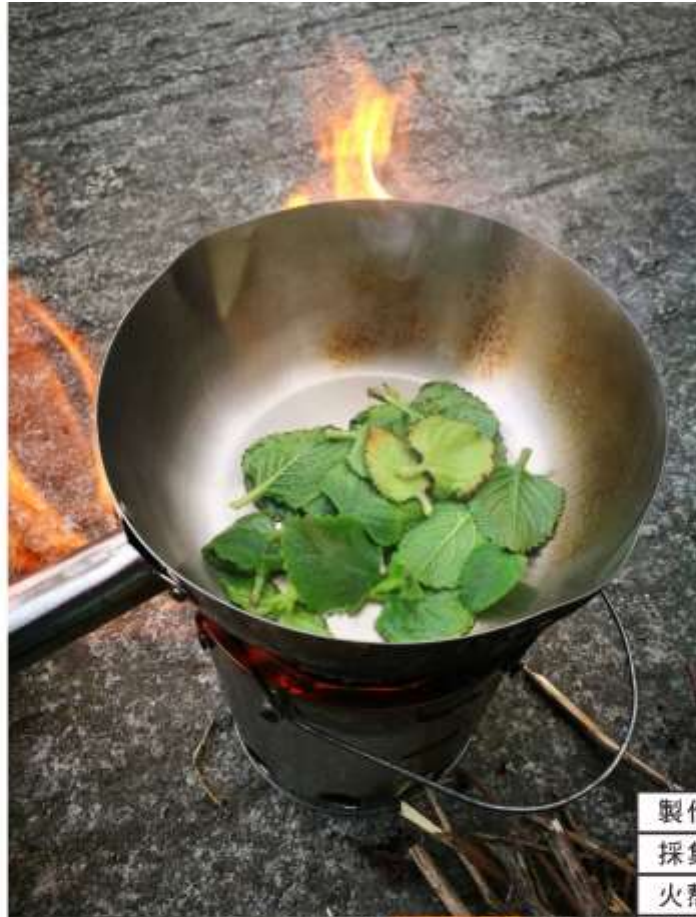
製作止癢膏 採集左手香以木汽化爐小火熬製，材料為左手香、 自製的冷壓椰子油與蜜蠟