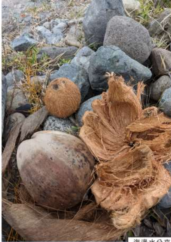
海邊水分來源-地上撿拾的椰子