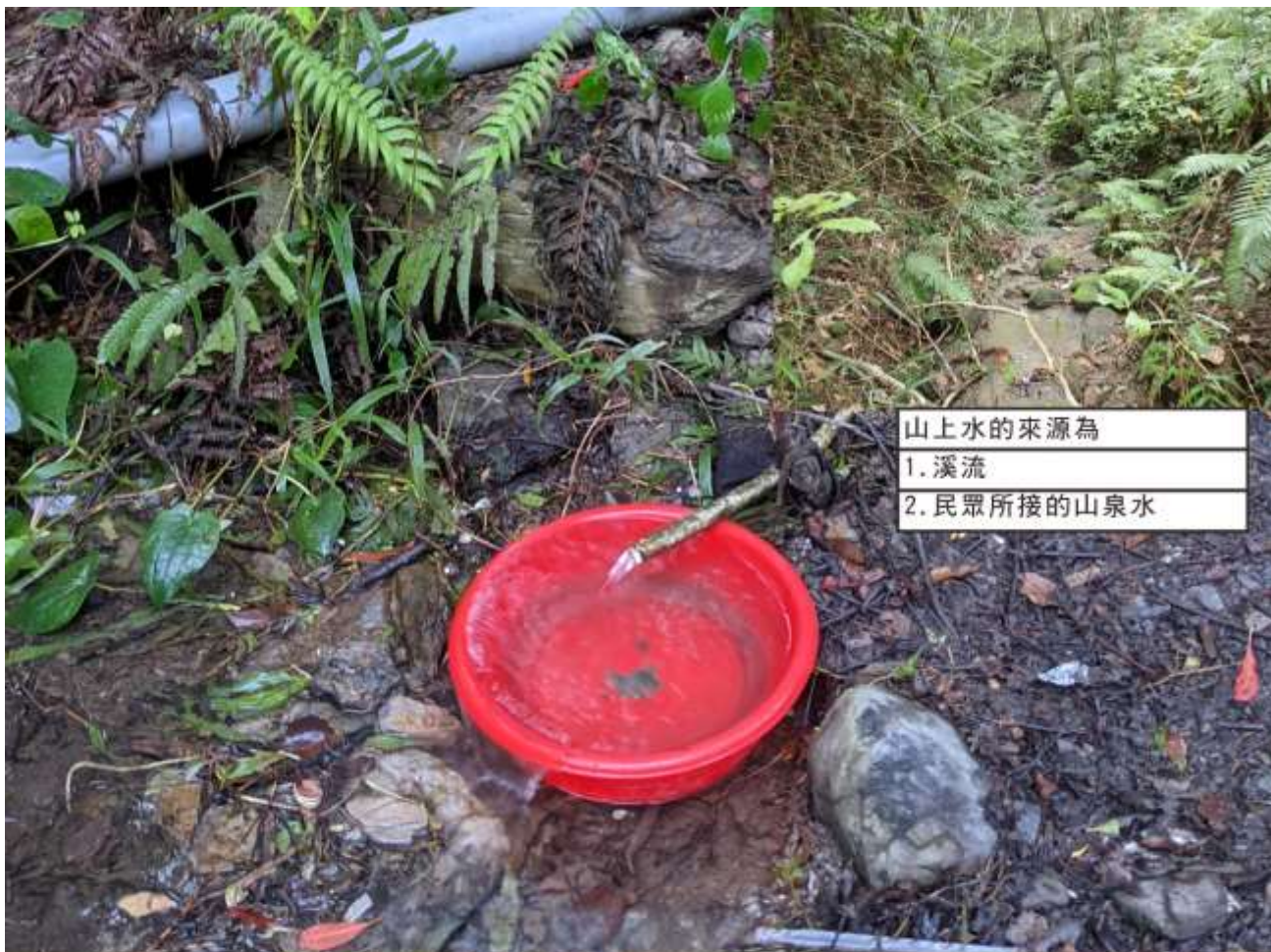
山上水的來源為 1. 溪流 2. 民眾所接的山泉水