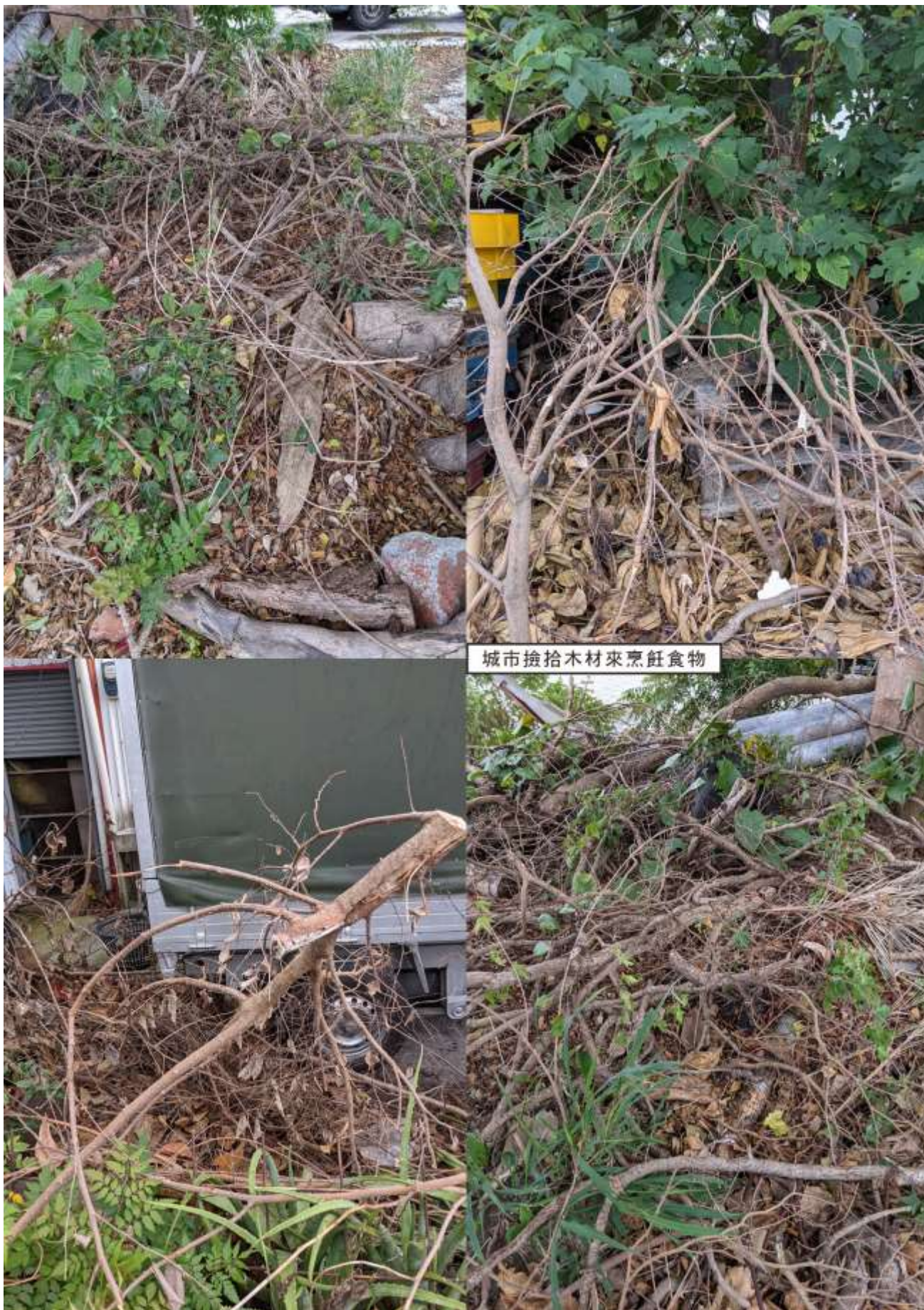
城市撿拾木材來烹飪食物