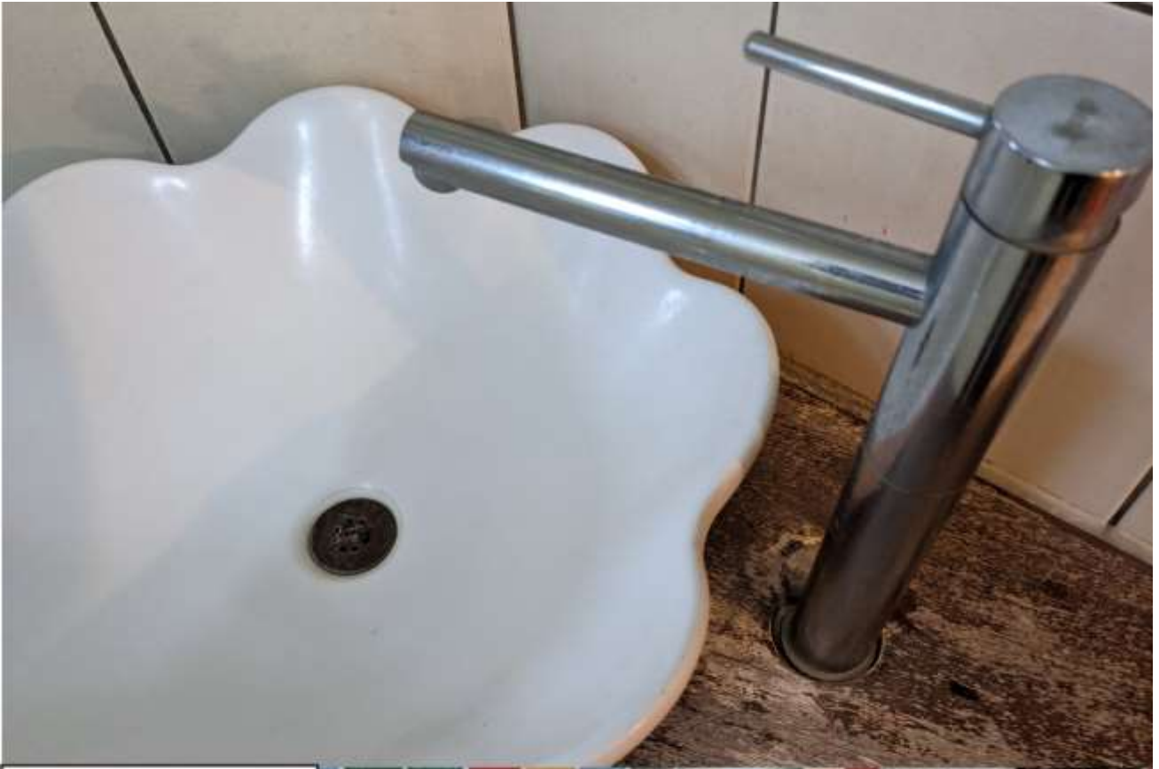
城市水的來源為 公共廁所