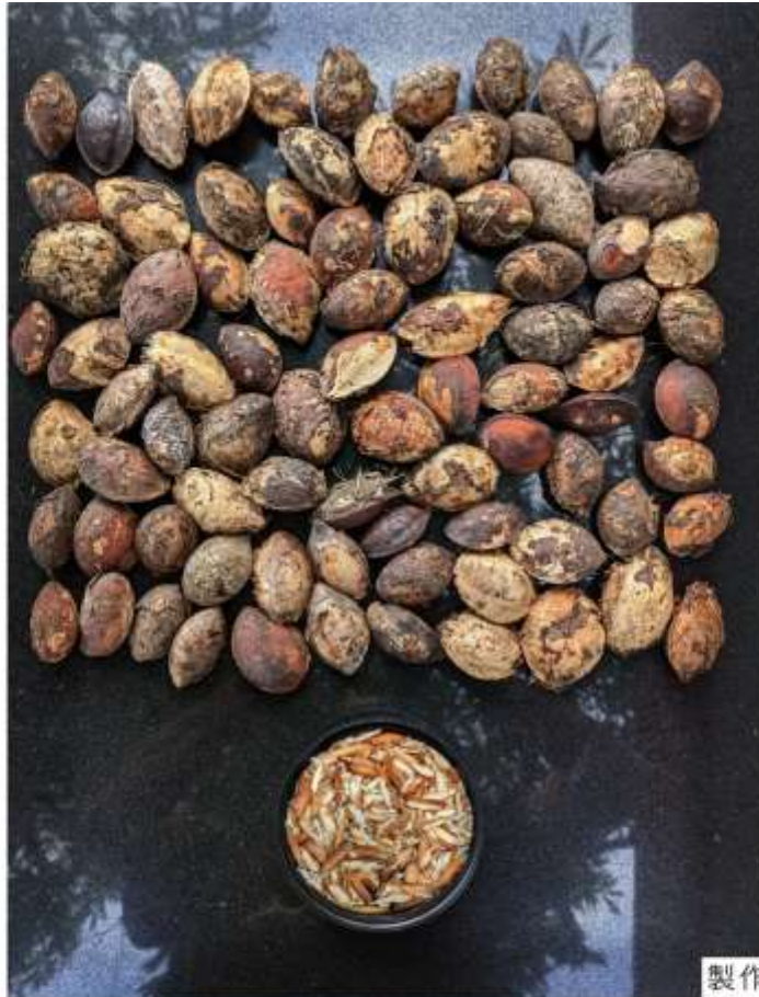
製作乾糧 採集大葉欖仁的果仁，擊開後，取出種子與麵粉一併烘烤，作用為-當找不到食物時的緊急食物