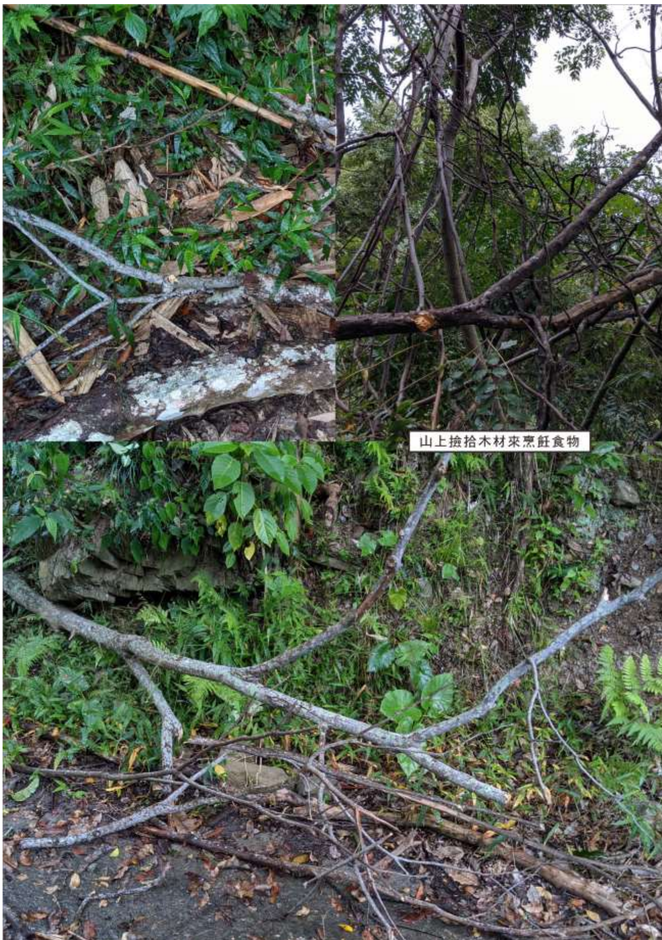
山上撿拾木材來烹飪食物