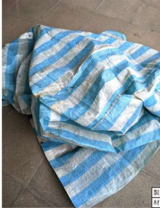
製作防蚊帳篷 材料為-回收帆布、紗窗、 棉繩以手工縫製