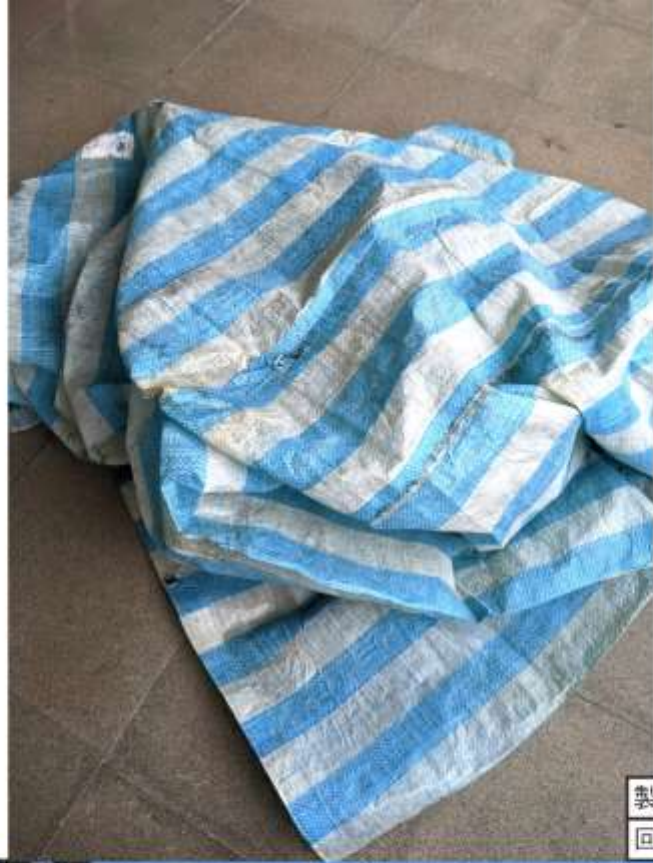
製作雨衣 回收的帆布手工縫製