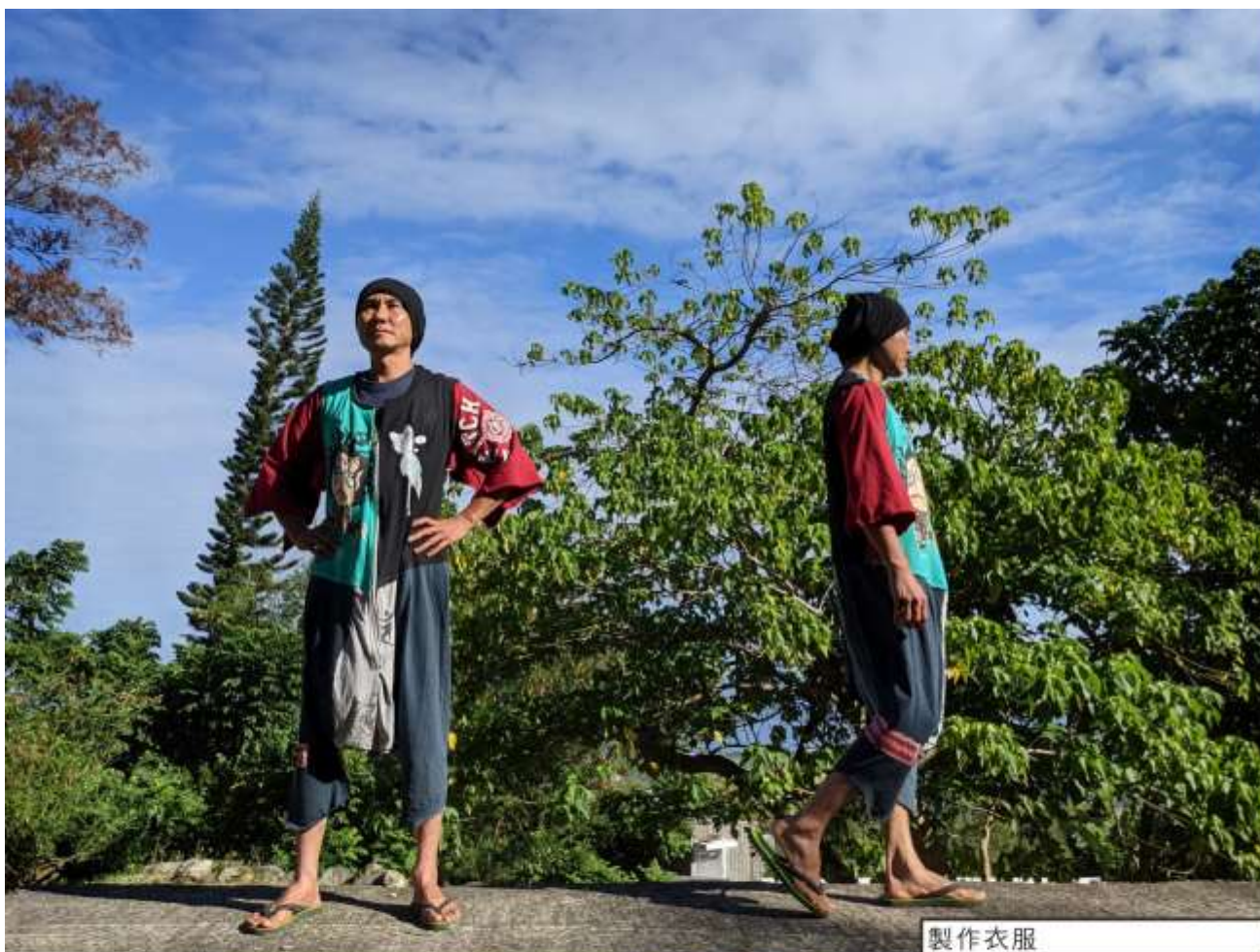
製作衣服 材料為-回收的衣服