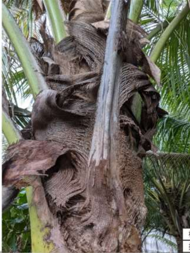
椰子菜瓜布 撿拾地上的椰子纖維 來清洗含油脂的鍋具