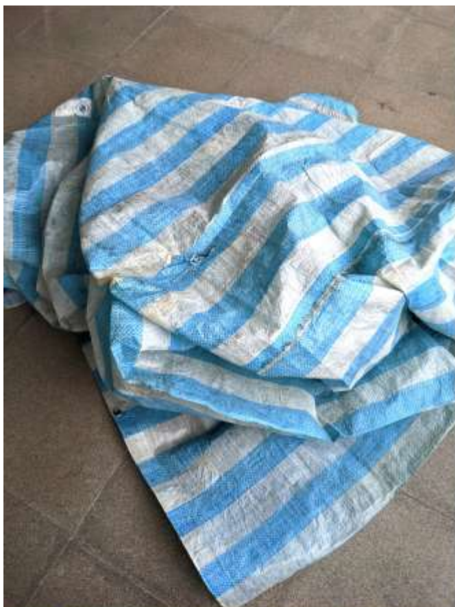
製作斗笠 回收的帆布與撿拾的竹子 來製作斗笠