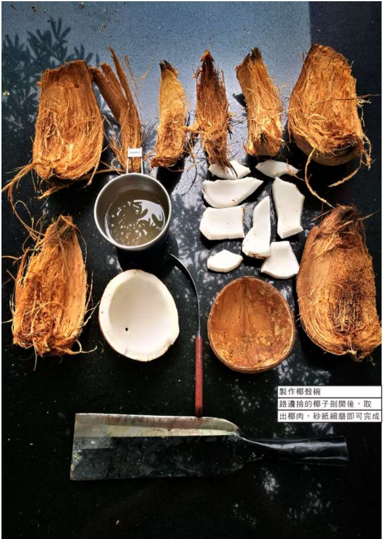
製作椰殼碗 路邊撿的椰子剖開後，取 出椰肉，砂紙細磨即可完成