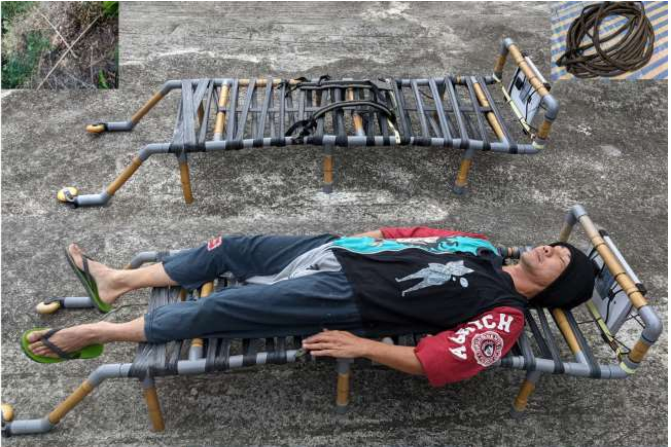
製作行動托具 材料為-回收的內胎、撿拾的竹子、水管、回收的輪子、回收的肩背袋、太陽能板