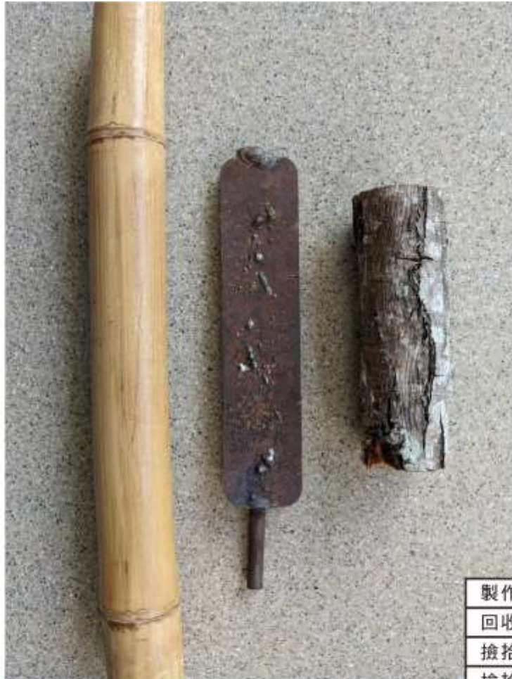
製作刀具 回收的鐵磨製 撿拾的樹枝為刀柄 撿拾的竹子為護套 劈材與切菜使用