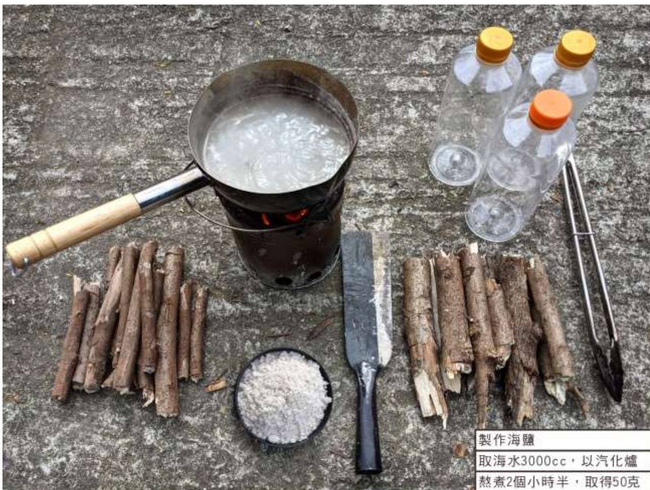
製作海鹽 取海水3000cc，以汽化爐 熬煮2個小時半，取得50克 的海鹽