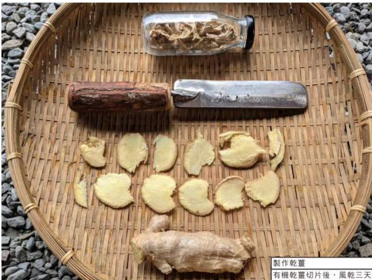
製作乾薑 有機乾薑切片後，風乾三天 烹飪使用，戶外可食用植物 普遍性涼，以薑來平衡