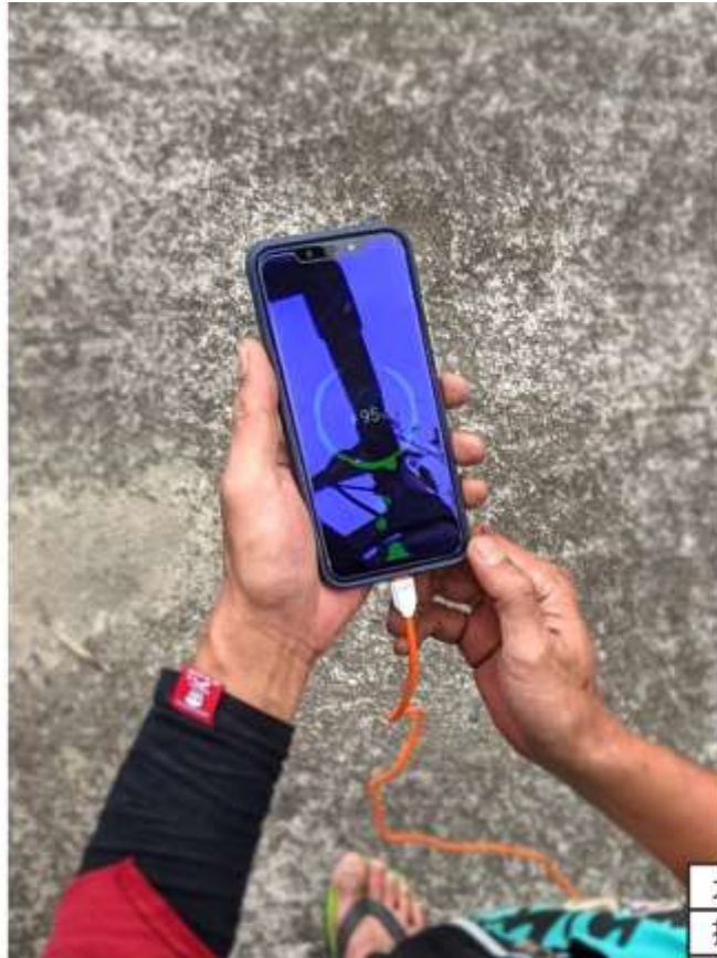
太陽能充電器 提供手機充電使用與 GoPro使用