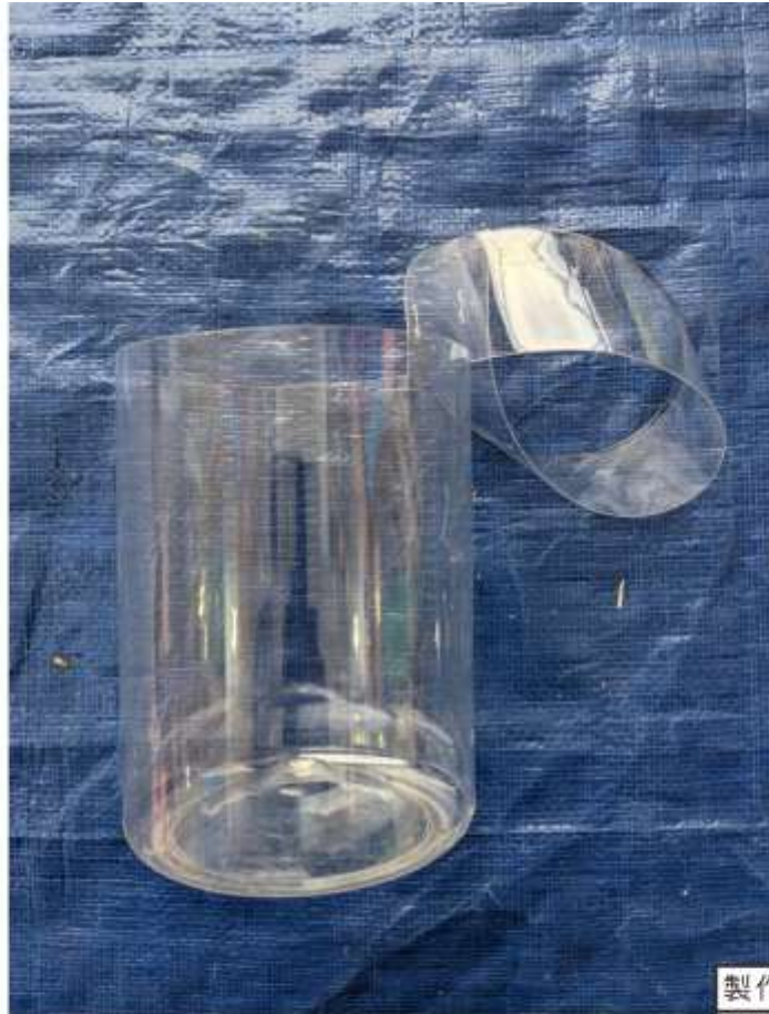
製作杯子 材料為-回收的寶特瓶