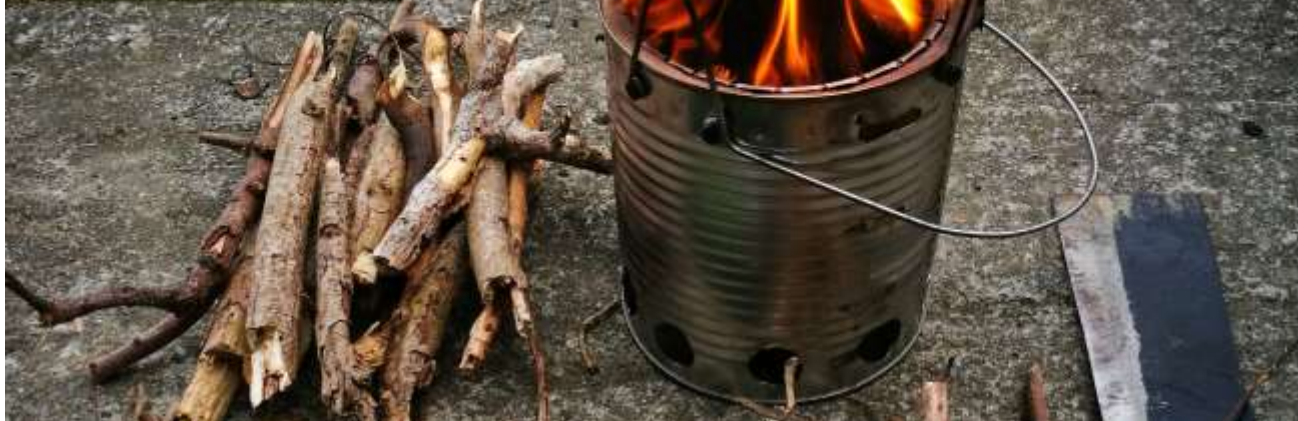
製作汽化爐 材料-回收的鐵桶 烹飪使用