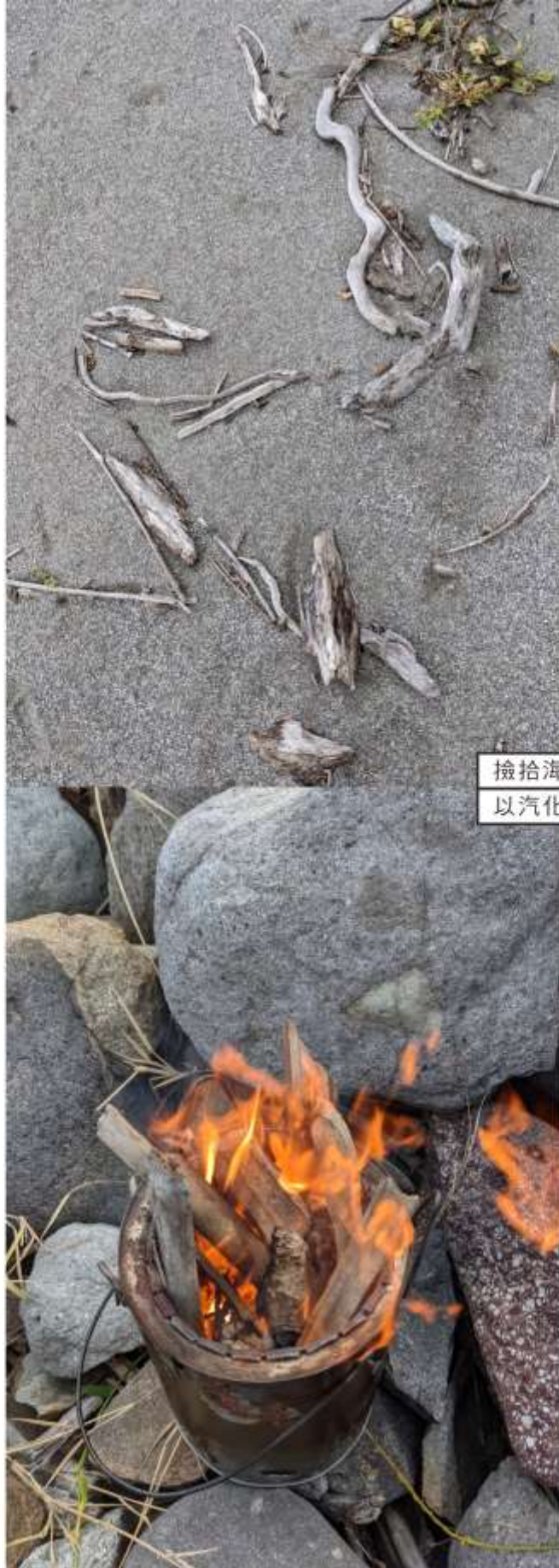
撿拾海邊的漂流木 以汽化爐烹飪食物