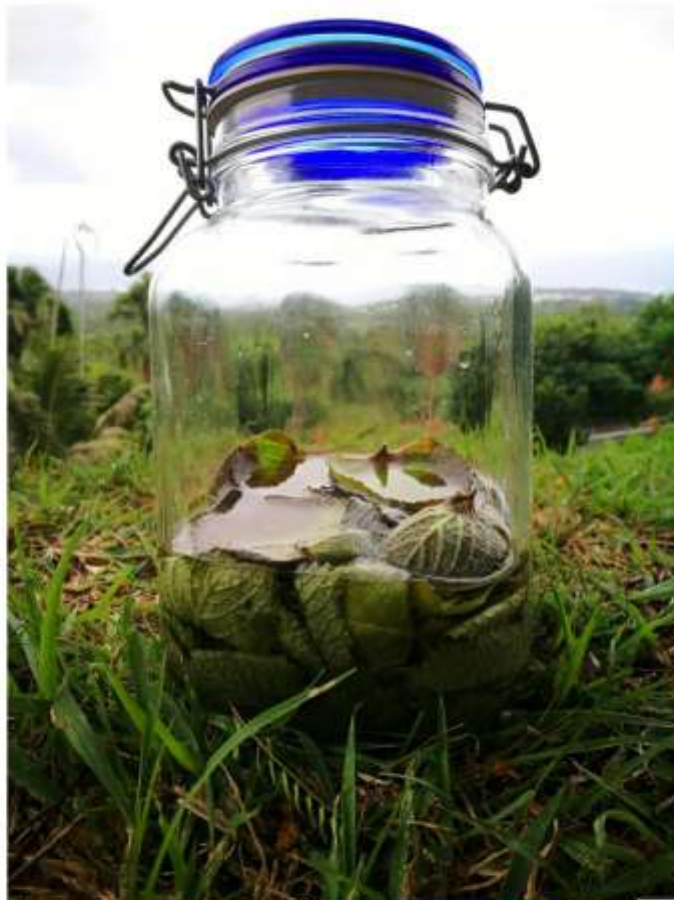
製作防蚊液 材料-採集的左手香與米酒