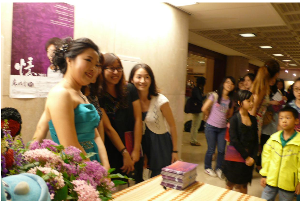
2014/9/12 桃園縣政府中壢藝術館