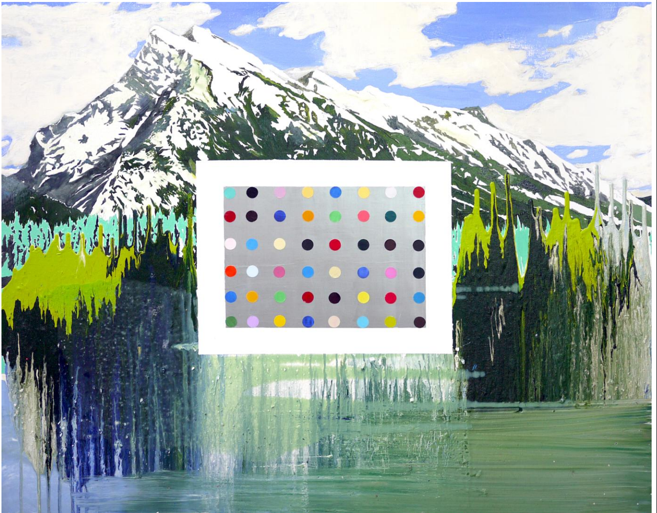
赫斯特喜歡的顏色 (Sketch) The Color Like Hirst (Sketch)