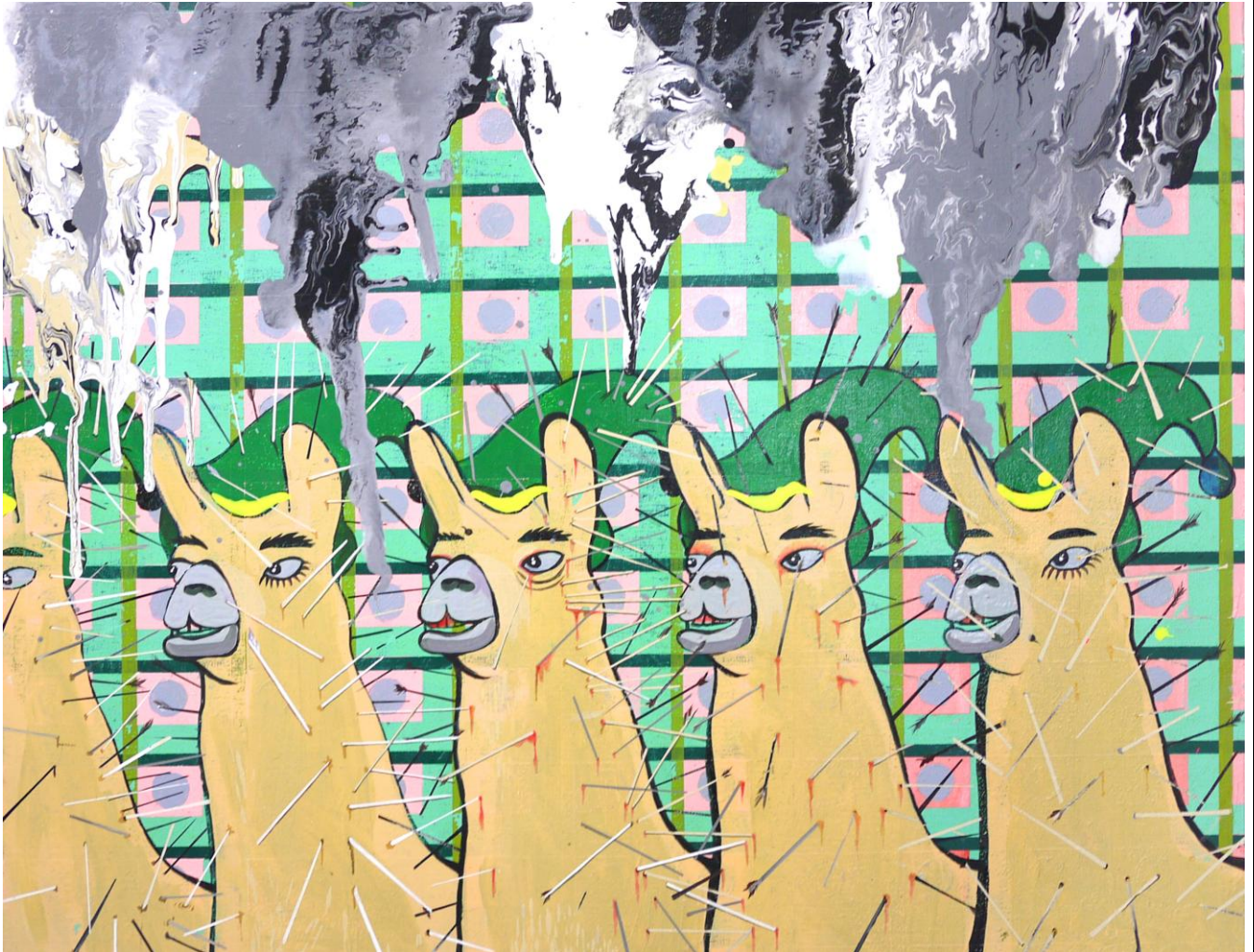
草馬借箭 This Horse Needs To Be Enslaved