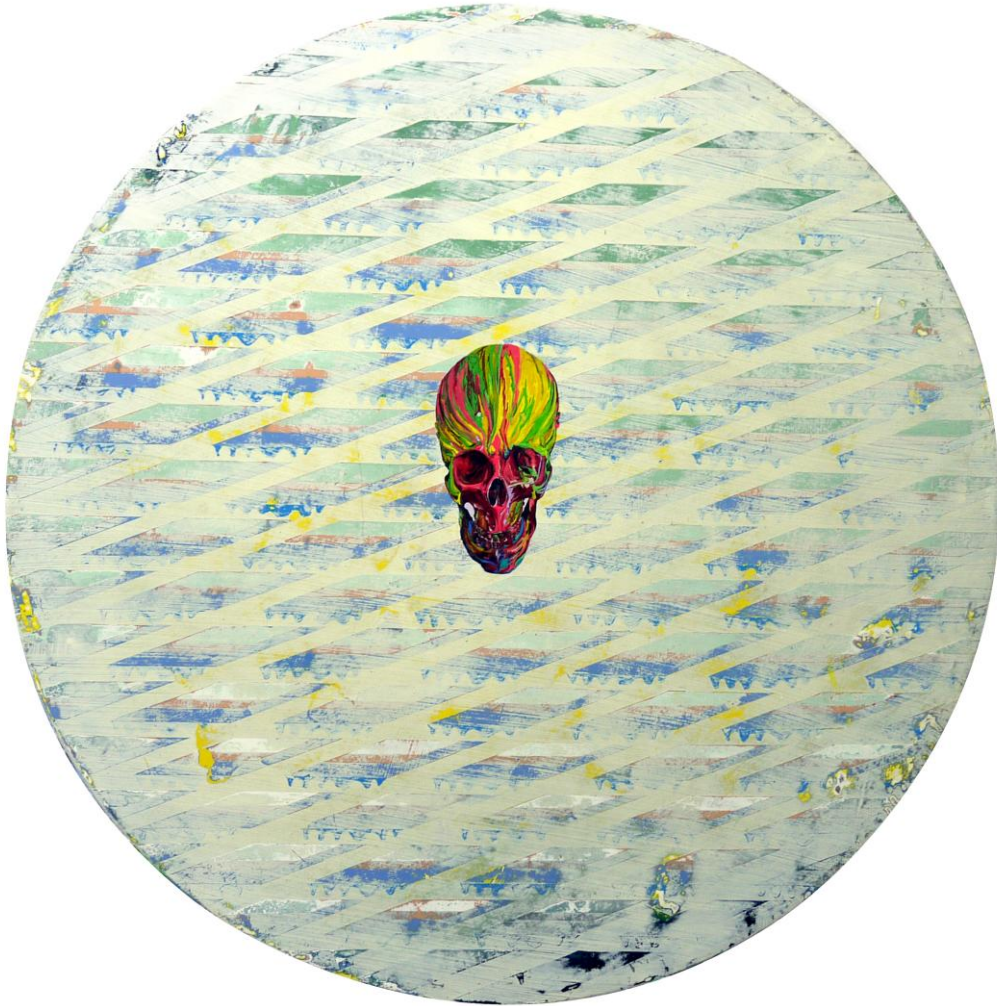
彩色骷髏頭 Color Skull