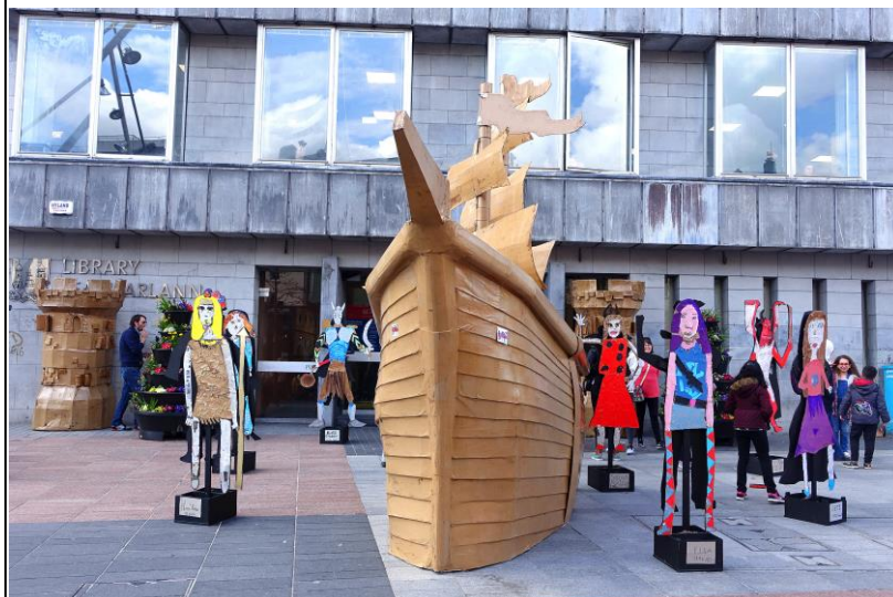
依照市徽（船、城堡）做成的立體造型——敘述科克歷史