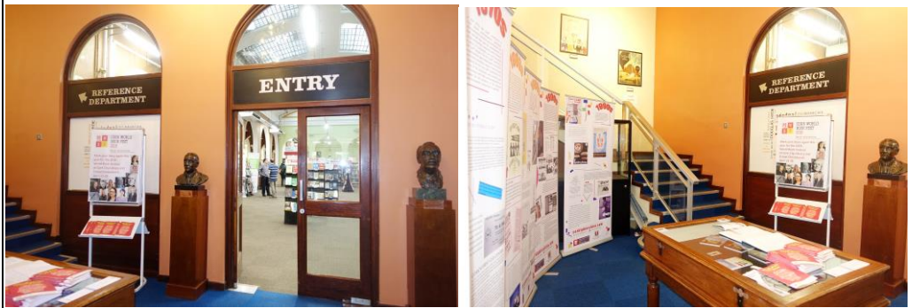
入館後，朗讀會場外，左邊是世界圖書節海報及手冊