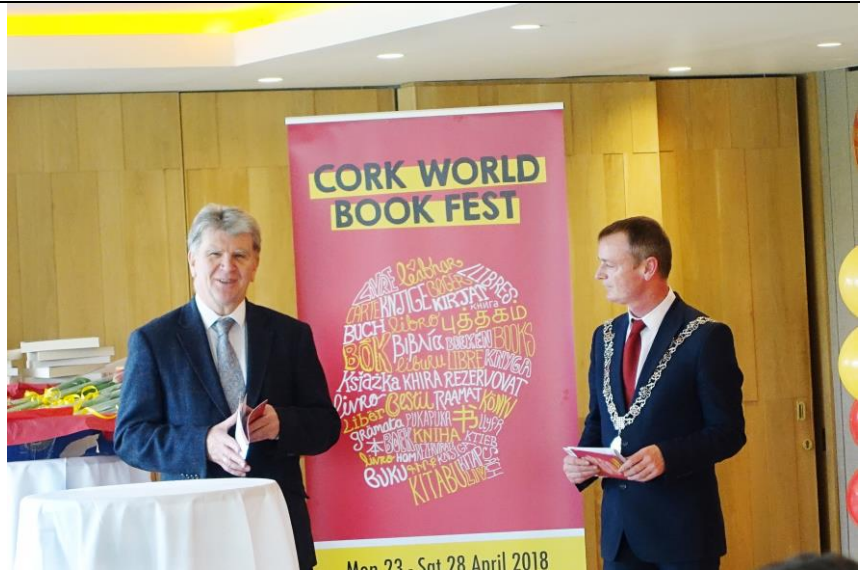
River Lee Hotel 宴會廳一隅—圖書館總館長（左）致詞