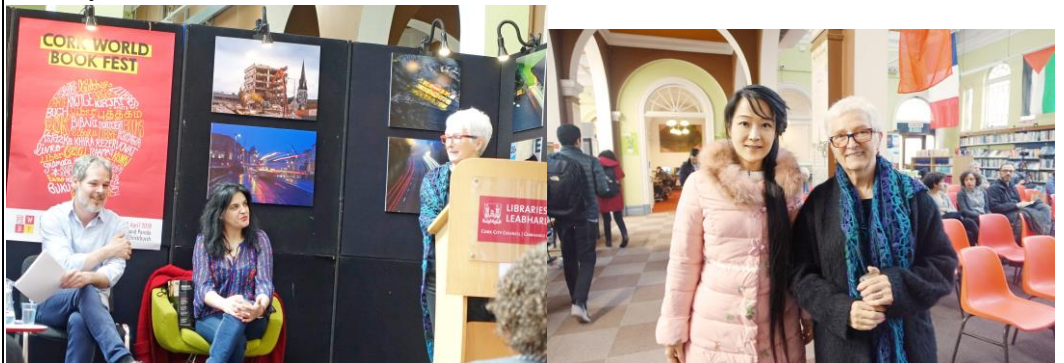
西班牙詩人朗讀會，(左圖)台上站立者為西班牙得獎詩人暨馬德里大學教授