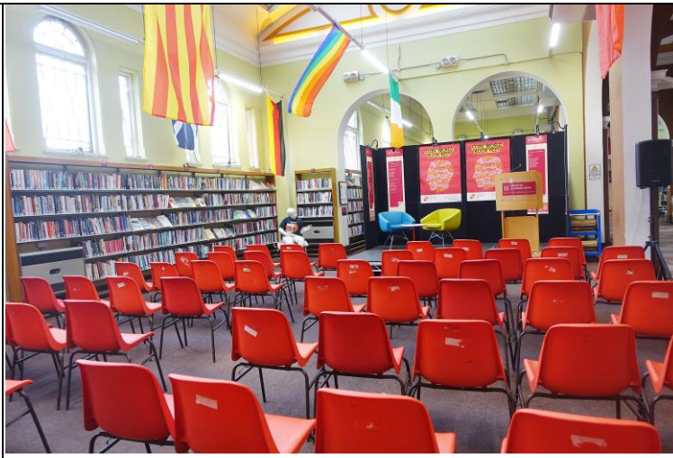
朗讀場所，為半開放式空間，右邊為入館必經之通道