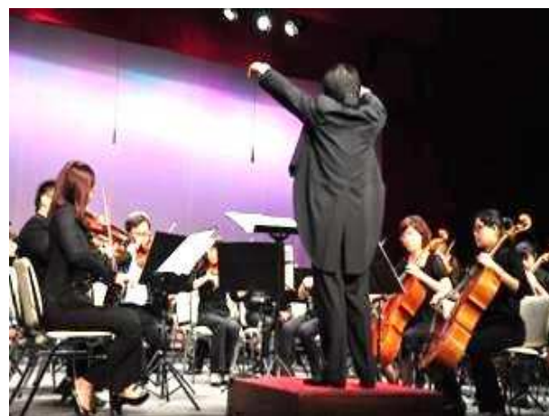
東西合弦泰雅交響夜-春之聲管弦樂團