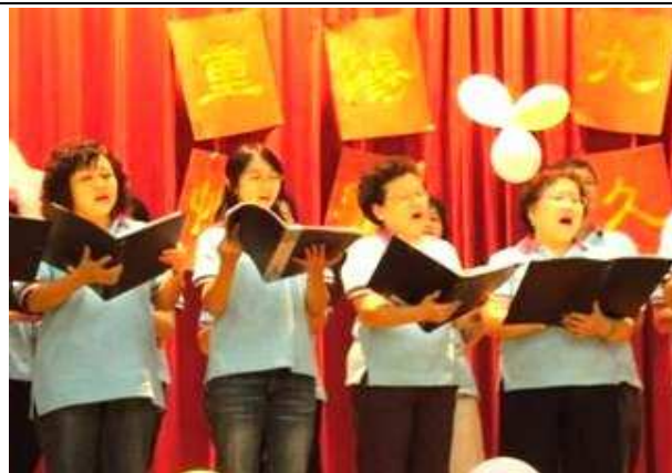
台北市關懷敬老音樂會-台電合唱團