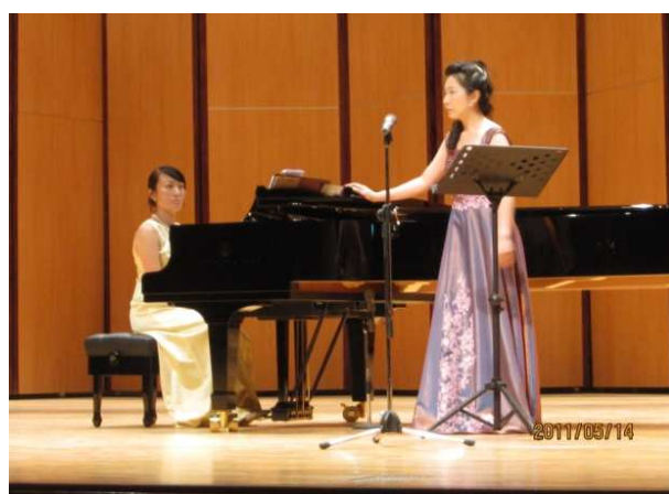
作曲家郭長揚教授懷鄉歌曲-光揚樂展