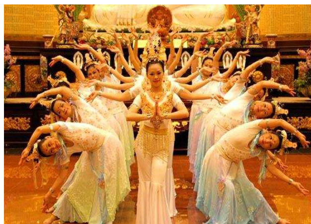
文山區舞蹈表演會-人間敦煌舞蹈團