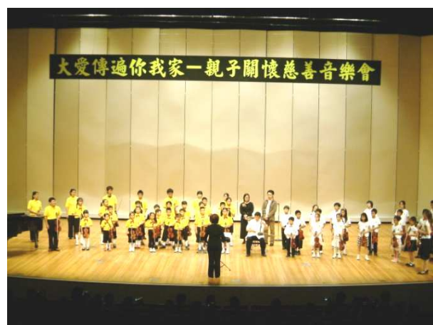
大愛傳遍你我家-親子關懷慈善音樂會