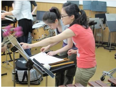
（圖二）日本練習紀錄