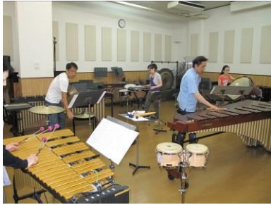
（圖一）日本練習紀錄