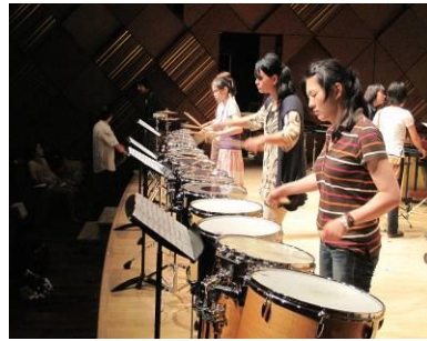
（圖三）演出當日舞台彩排