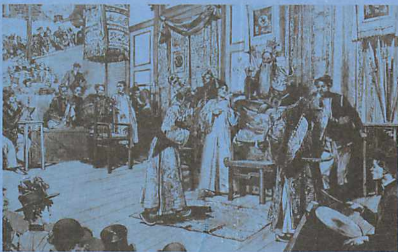
·安南民間劇團於1889年巴黎世博會的演出

關於爪哇音樂，德布西在寫給他的朋友盧易(Pierre Louÿs)的信中，如此讚美：「你或許還記得那充滿著種種細微變化的爪哇音樂，其中許多獨特的效果都是西方音樂詞彙難以形容的，我們的主音、屬音音樂與之相比，只能說是幼稚」。德布西此話可能有些誇大，但他能瞭解爪哇音樂的微妙，並在日後創作時深受啓發，應是沒有任何疑問的。根據當時留下的記載與圖像，1889年世博會中，來自爪哇的音樂包括一個搖竹琴(angklung)樂隊，一個五人組成的小型加姆朗樂團(gamelan)，伴奏四位少女的舞蹈。