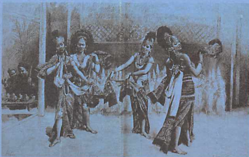
•四位爪哇女舞者在小型加姆朗樂團伴奏下，於1889年世博會的演出

德布西對東方的、「天籟」般音樂的嚮往，在下列這段詞語中表露無疑：「音樂是種神祕的數學，它的不同因素(旋律、節奏、力度)能做無限的變化。它能體現水的動態，風勢轉換的曲線；沒什麼東西比日落更具音樂性的！對真正曉得欣賞這個美景的人，它是某一本書中能學到最多的一章，這本書叫大自然，可惜的是，甚少音樂家懂得去翻閱它」。這段有關音樂與大自然的解讀，就像德布西許多與大自然有關的音樂一般，經常引起誤解。德布西不想直接去模仿大自然的真相，諸如日出、日落的過程，蟲鳴、鳥叫、水聲的「擬聲」；德布西感到興趣的，就像印度音樂、爪哇音樂一般，他們共同關注的是大自然抽象式的動態、韻律、色調、層次的變化，簡而言之，那是大自然的奧秘與精髓。德布西藉著音樂抽象、飄渺的本質，去渲染、經營一首首聽覺上的意境或詩境，正如他一再用來當作他的音樂的一個標題「意象」(image)一般。